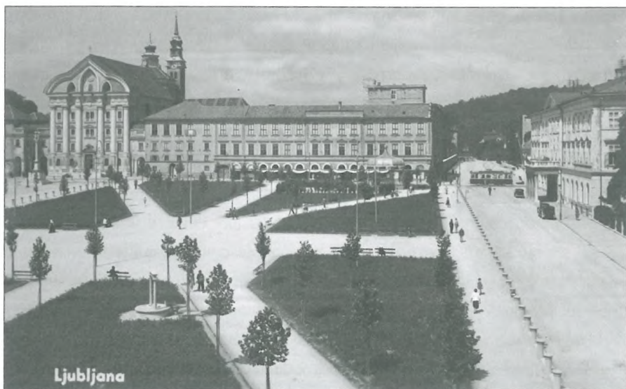
Park Zvezda pred drugo svetovno vojno