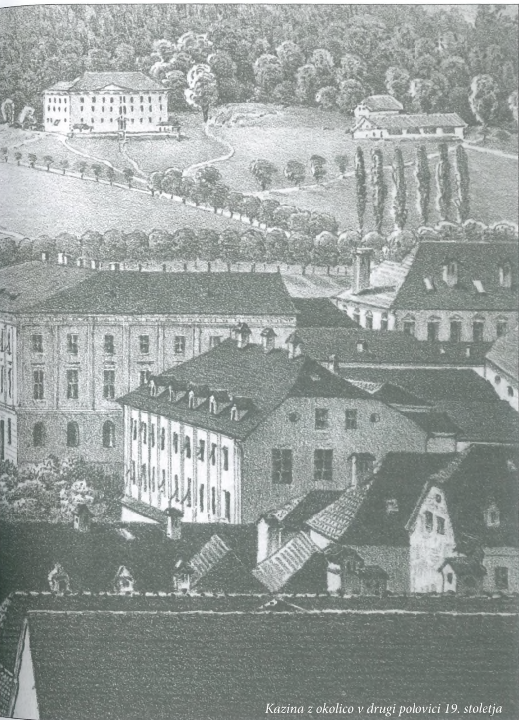
Kazina z okolico v drugi polovici 19. stoletja