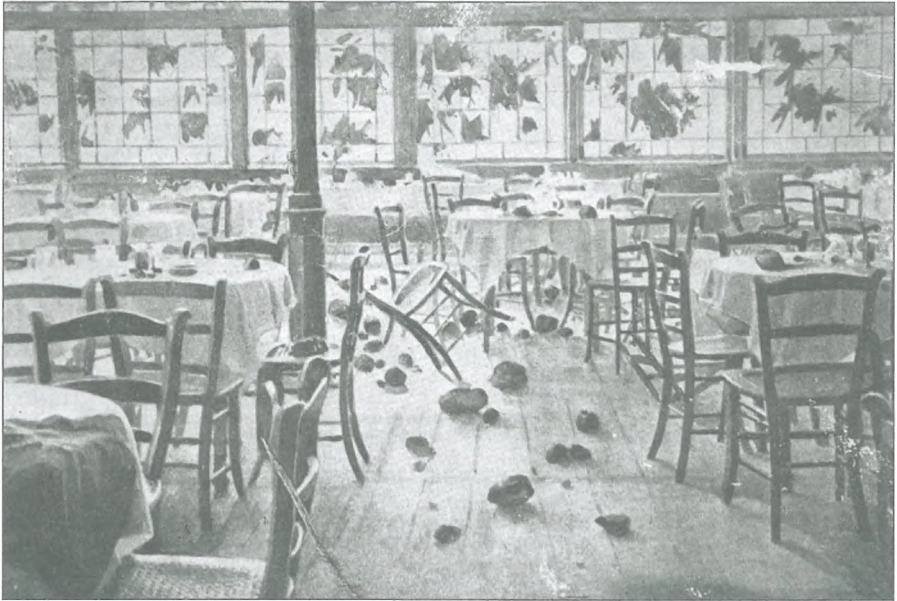
Kazinska restavracija po protinemških demonstracijah septembra 1908

Kazina je postala med slovenskimi nacionalisti tako osovražena, da jo je lahko skupila tudi takrat, ko protesti sploh niso bile naperjeni proti Nemcem. Pomladne demonstracije leta 1903 na Hrvaškem so v slovenskih deželah izzvale pravo solidarnostno gibanje. 19. maja 1903 je slovenska politika družno organizirala protestni shod v podporo Hrvatom in proti madžaronskemu banu Khuenu – Héderváryu. Po končanem shodu v mestnem domu pa je protimadžarska manifestacija dobila nenavaden obrat. Pred Kazino je shod mutiral v veliko protinemško demonstracijo, ki so jo oblasti zatrle šele s pomočjo orožništva in vojaštva. Množica je v parku Zvezda demonstrativno zapela »Hej, Slovani«, nakar je med ljudmi zavrelo, »začelo se je kričanje, letelo je kamenje, počila naj bi tudi dva strela, ki da sta priletela v okno Kazine.« Množica je hotela naskočiti kazinsko kavarno, a jo je policija razgnala. Kasneje se je izkazalo, da ni šlo za strele, ampak za projekte izvrstne frače, ki jo je lastnik »uporabljal za streljanje žab na Barju«. Demonstranti so trdili, da so na njih iz Kazine metali neke stvari in jih polivali z vodo, kar so »kazinoti« odločno zanikali. Že 7. junija 1903 so se izgredi pred Kazino ponovili, ko so ljubljanski turnarji v stavbi praznovali štiridesetletnico društva. Navkljub pozivom v časopisih, naj na nemške provokacije ne nasedajo, se je tudi tokrat na vogalu parka začelo zbirati večje število ljudi. Na kazinskem