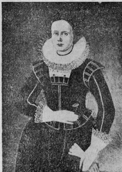
VALVASORJEVA PRVA ŽENA

Krstnik prej umrl. Lastninsko pravico nad laško gosposčino je sicer še obdržal deželni vladar, vse dohodke od gosposčine in sodišča (podložniške dajatve in tlako ter globe) pa je užival zastavni imetnik Valvasor na račun svojega posojila lastniku.