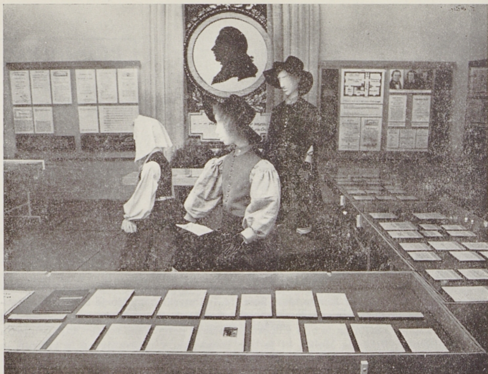
Dva pogleda na Linhartovo sobo v Radovljici