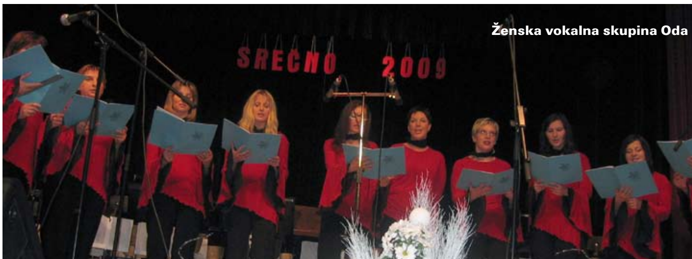
Ženska vokalna skupina Oda