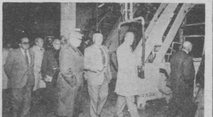
Španski borci so si na obisku v vevski papirnici ogledali tudi proizvodne prostore.

Zadnji dan so se španski borci ogledali gradnjo PST in vevsko papirnico kot pomembno organizacijo boja za delavske pravice že pred vojno, vojaško gimnazijo Franc Rozman-Stane, vojašnico Bratstva in enotnosti in Cankarjev dom. Tridnevni obisk je prehitro minil v tovariškem, prijateljskem ozračju. Nadvse zadovoljni so se španski borci poslovili od nas. AM - JK