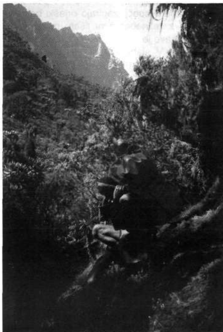
Nosač v zgornjem delu doline Bujuku

Pred nosači lovimo pot po suhih otočkih suhe trave nad jezerskim bregom. Ko se steza dvigne, je bolj suho in hitro pridobivamo višino mimo lobelij in skozi pravi gozd orjaških senecij. Osem nas je in kar dobro nam gre od nog; zgodnji smo še. Edini težji prehod je grapa, kjer pa je pot dobro nadelana. Še nespora-