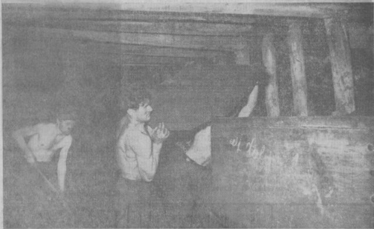
Tako so pred večimi leti transportirali velenjski lignit. Sedaj pa je delo mehanizirano.

Upravni odbor rudnika lignita Velenje je na svoji 4. redni seji, dne 26. 7. 1966 med drugim obravnaval tudi operativni plan osnovne proizvodnje za mesec avgust in sprejel sklep s katerim je predvideno nakopati 320.000 ton premoga.