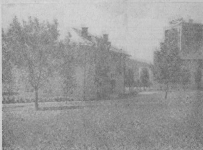
Le v nekaterih predelih Novega Velenja držijo prebivalci še tradicijo s tem, ko pazijo na urejenost okolice.