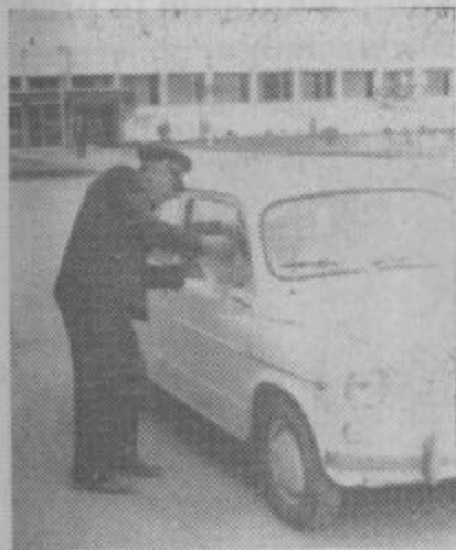
»Srečno vožnjo« — s Saleškim rudarjem!

vorimo o naših težavah, o prizadevanjih uredništva, da bi list popestrili in približali bralcem. Precej je bilo težav v domači hiši, pri tistih, ki z denarnimi