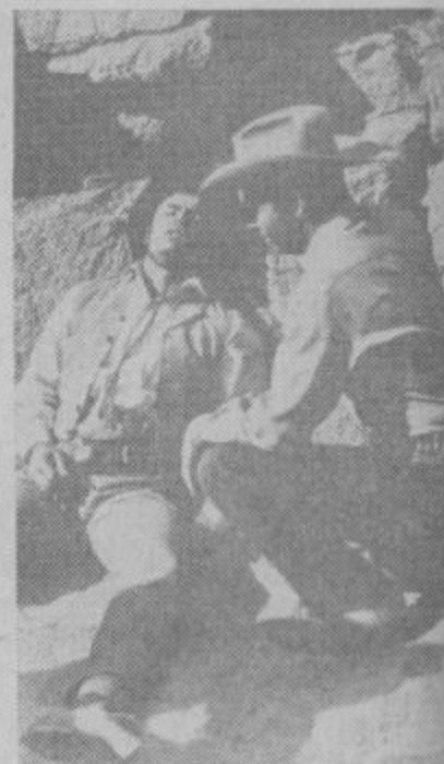
Prizor iz filma »Izgon iz pekla«, ki bo na sporedu 25. in 26. avgusta v Velenju.