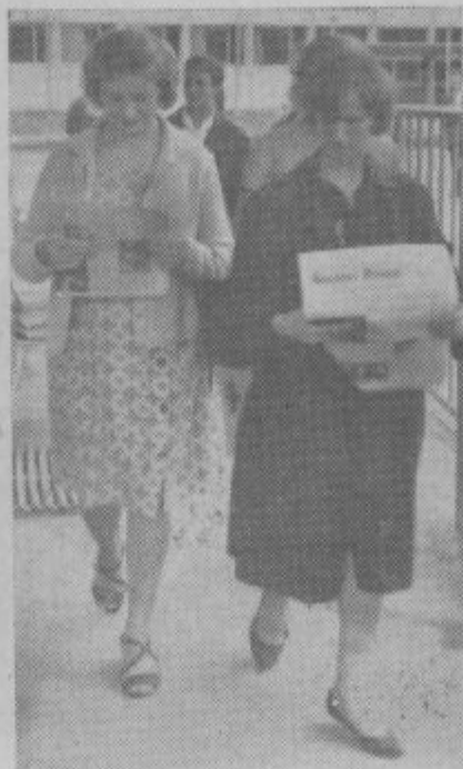
Tudi za njiju bo v Saleškem rudarju kaj zanimivega.

vorimo o naših težavah, o prizadevanjih uredništva, da bi list popestrili in približali bralcem. Precej je bilo težav v domači hiši, pri tistih, ki z denarnimi