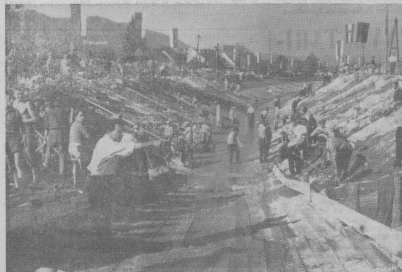
To fotografijo z udarniškega dela pri regulaciji Pake objavljamo zato, da bi tisti, ki so se v Velenje šele naselili, znali spoštovati »kabrice« nekaterih.

Ravno ob tem se največkrat spotaknemo. Na nekaj vprašanj, posebno tistih iz zborov volivcev, nam je odgovoril direktor podjetja tova-