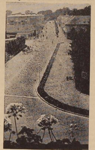
M. Soboti — Ul. Š. Kovača

Ob tej svečanosti bodo priredili tudi krajski kulturni program. Pričakujejo, da se bo poleg gostov zbralo na otvoritveni svečanosti tudi precej ljudi iz tega okolja. Nova avtobusna garaža v Sotini bo velika pridobitev za prebivalstvo tega dela Goriškega, saj bo že v bližnji prihodnosti omogočila tudi otvoritev direktne avtobusne zveze Sotina-Ljubljana. Mimo tega bo koristna tudi za vse bolj se razvijajoč turizem in maloobmejni promet v teh krajih. Predvideno je namreč, da bo obmajni prehod pri Sotini z otvo-