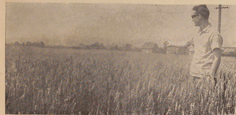
Po vsem Pomurju — žetev. Na sliki: polja pšenice KIK »Pomurka«, obrat Rakičan

povprečju okrog 43 stotov na hektar. Pridelek pšenice na poljih zasebnih kmetovalcev kaže nekoliko slabše, gibal se bo okrog 30 stotov po hektarju.