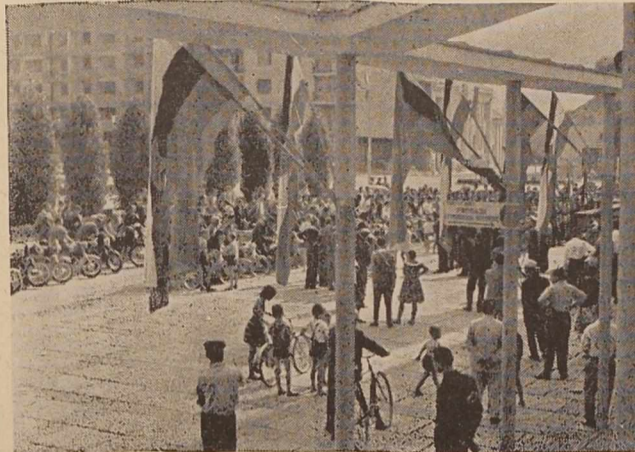
Tako je bilo na dopoldanskem praznovanju 4. julija v M. Soboti

vanja. V programu na proslavi so sodelovale godbe na pihala in moški pevski zbor DPD Svobode Ivana Kaučiča iz Ljutomeru, pionirji osnovnih šol ter DPD Stara cesta — Cezanjevci. Popoldne so bila športna tekmovanja in veliko partizansko rajanje.