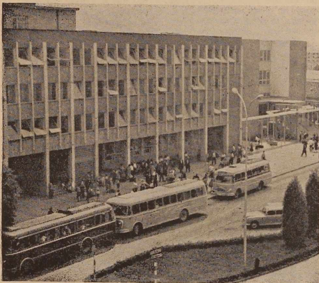
Murska Sobota — vedno živahno središče

Izleti bodo ob sobotah in nedeljah, udeleženci bodo plačali samo prevozne stroške, ostale stroške pa bo krila sindikalna podružnica. O obratu MTT hočejo s temi izletni omogočiti dan, dva prijetnega počitka večjemu številu delavk, ki svoj dopust ne bodo izkoristile v letoviških namoru in drugod.