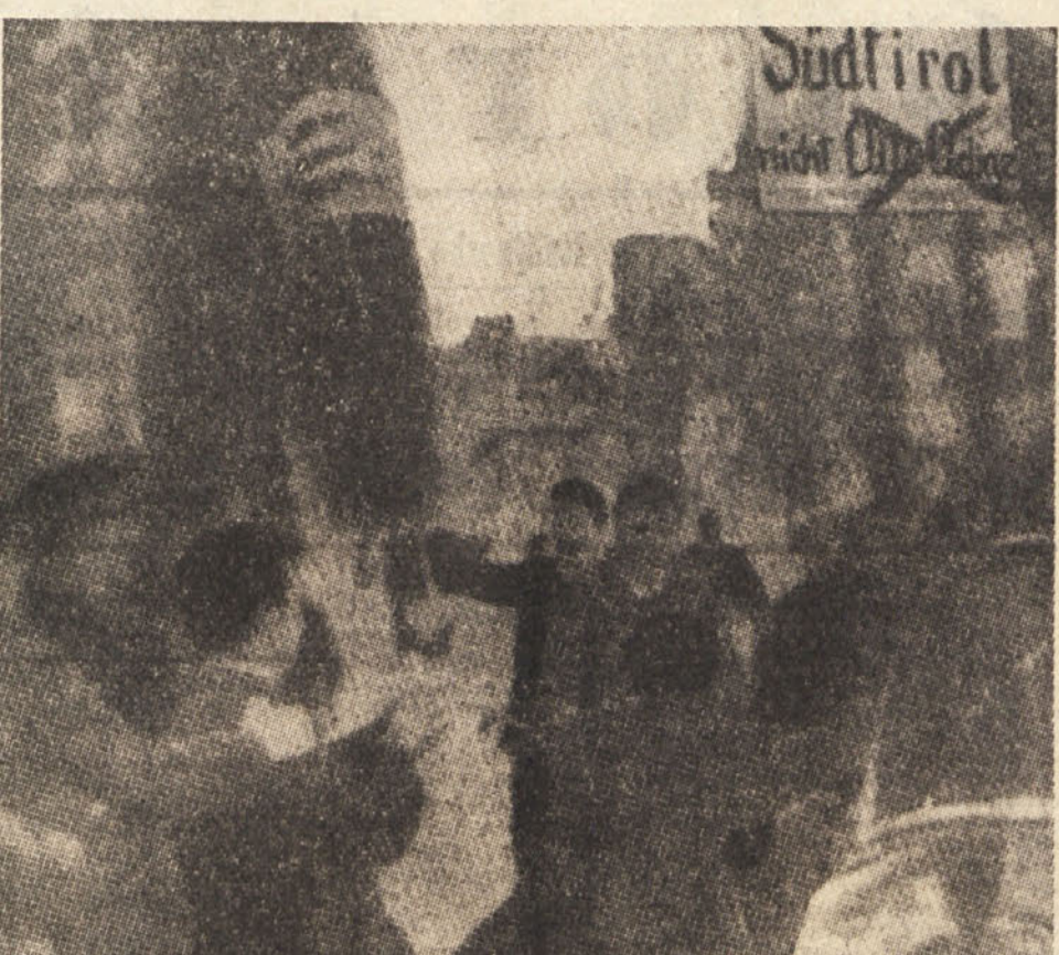
Preteklo nedeljo je Južnotroitska ljudska stranka priredila v bližini Bocna veliko protestno zborovanje proti italijanski vladi, ki so jo obdolžili, da namerno krši sporazum Gruber-De Gasperi in da hoče politizirati deželo. Pristojni je tudi do spopadov, a na srečo brez hujših posledic

svobodnega trgovinskega področja, tako da je bilo treba sprejeti ustrezne odločitve na najvišji ravni.