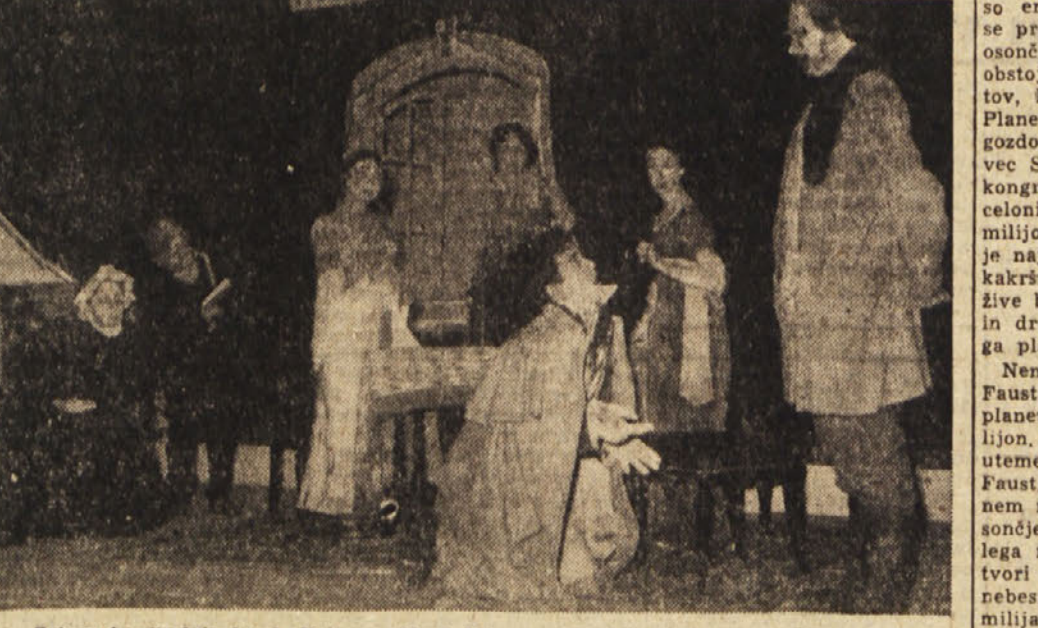
Prizor iz enodejanske I. Krilova «Nauk hčerama». Ostale slike bomo objavili jutri

manjkala vsaka smiselna opora in to kljub temu, da se delo zelo znano in da so si vsi lahko predstavljali manjkajoči dejavnosti. Vrh tega nememo pozabiti, da je drama mladini v režiji tujci, zlasti pa se takrat, kakršna je «Kralj na Betanovcu», ki se skituje na bričke socialne izključitve odraslega človeka.