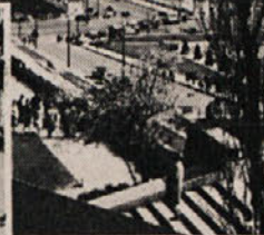
Pariz — pojem svetovne mode.