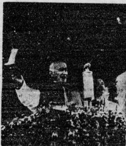
Slovenski vladika Jeglič govori

Ob štirih popoldne je bil na Glaziji nastop slo- venske mladine. Za dve uri poprej so se tisoči zbi- rali, da po dolgih letih spet vidijo naše fante. Pred pričetkom se je prvi pripeljal minister dr. Miha Krek s svojo soprogo, kmalu za njim drugi častni gostje, ter župani Ljubljane, Celja in Maribora. Ko se je pa pripeljal minister dr. Anton Korošec, se je množica spet razgibala in kar naprej klicala svojemu voditelju. Prav tako je nič manj navdušeno pozdravila prihod kraljevega zastopnika, koman- danta celje garnizije, ki je prispel v spremstvu dveh višjih oficirjev. Vsa množica je zaorila z vzklikom našemu kralju in jugoslovanski vojski.