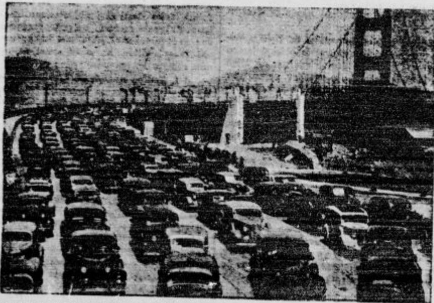
Največji most na svetu so nedavno odprli v St. Francisku v Ameriki. Slika nam kaže velikanski avtomobilski promet na novem mostu takoj ob otvoritvi.

d Minister Cvetkovič si je ogledal nekaj naših socialnih ustanov. Na potu iz švicarske Zeneve se je dne 24. t. m. socialni minister Dra- giša Cvetkovič ustavil za nekaj ur v Ljubljani. Najprej je obiskal bolnišnico. Minister Cvetkovič se je posebno zanimal za nove parne kotle v bolnišnici, ki so najno potrebni pri centralni kurjavi ter je uprava zaradi njih prosila mini- strstvo za potrebni kredit v znesku 1.312.000 dinarjev. Minister si je dosedanjo centralno kur- javo ogledal ter obljubil, da bo s svoje strani nabavo novih kotlov zelo priporočal, ker se je prepričal, da je sedanje stanje v bolnišnici ne- vzdržno. Iz bolnišnice se je minister Cvetkovič odpeljal s svojim tajnikom na Okrožno urad.