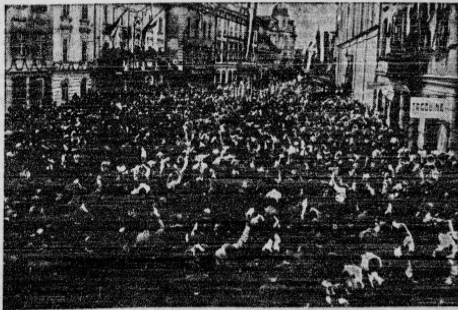
Množice pozdravljajo voditelje pri slavnostnem zborovanju