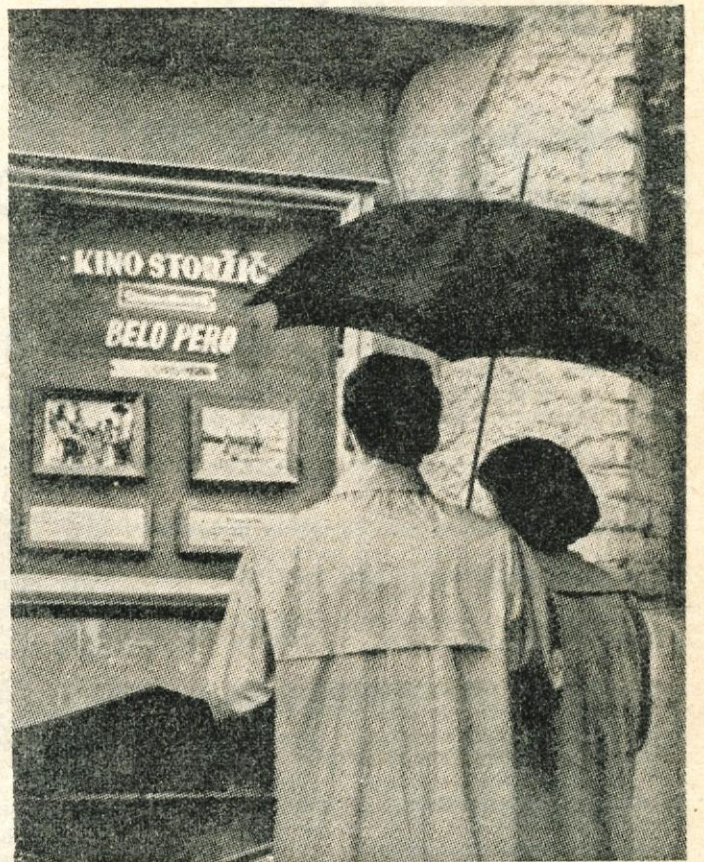
KAM PA DANES ZVEČER?

Taka in še druga vprašanja so tu pa tam, o katerih se na samoupravnih organih premalo govori. Zato posamezni uslužbenci ves sklop težav izvoza tolmačijo kot »stvar instrumentov« in ne iščejo niti tistih možnosti, ki jih imajo v kolektivih za reševanje tega vprašanja.