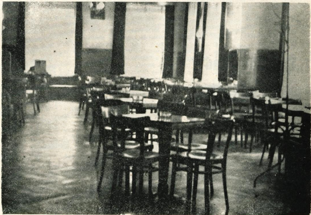
DOPOLDANSKO TIHOŽITJE V KAVARNI HOTELA »EVROPA«

Kmalu po osmi zvečer ulice v Krangju opuste. Samo kak razgret gost še kali spokojni nočni mir. »Kje pa naj vzamemo denar za