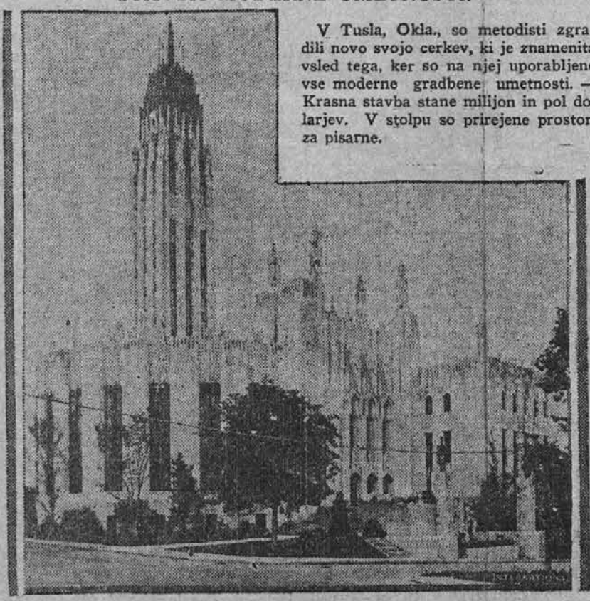
V Tulsa, Okla., so metodisti zgradili novo svojo cerkev, ki je znamenita vsled tega, ker so na njej uporabljene vse moderne gradbene umetnosti. — Krasna stavba stane milijon in pol dolarjev. V stolpu so prirejene prostori za pisarne.