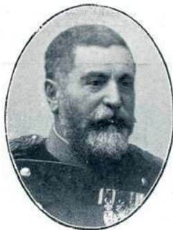
GENERAL PUTNIK, vrhovni poveljnik srbske armade, imenovan vojvoda.

Kdo bi bil pričakoval od majhne Črne gore takega nastopa? Kralj Nikita je vmešavanje Avstrije in Italije ponosno zavrnil . . .