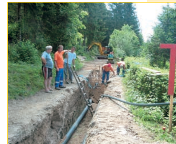
Do leta 2010 bo Tržič postal komunalno ena najbolj urejenih občin na Gorenjskem, kar bo nudilo dobre možnosti za razvoj gospodarstva, podjetništva in obrti.