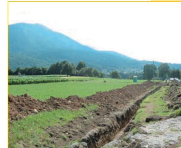
3. julija 2008 so se pričela prva obnovitvena dela na vodovodu Žegnani studenec in sicer na več delih trase od zajetja do vodohrana Kovor in proti Zvirčam.

Celotna vrednost projekta znaša 24,4 MIO EUR.