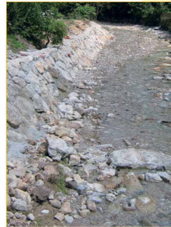
Nov oporni zid na Slapu, s kamnito zložbo in ustalitvenimi pragovi od »Kodrovega mostu« do jezua na Lepenki, v dolžini 300 m. Poleg ceste smo pred poplavno ogroženostjo rešili tudi hiše najbližjih stanovalcev.

V tržiške vodotoke se zadnjih deset let praktično ni vlagalo, zato je bilo tudi stanje izredno slabo. Zavedati se moramo, da se investicije v urejanje vodotokov v času vremenski ujm nekajkratno povrnejo in da se na ta način močno zmanjša morebitna škoda. Veseli nas, da smo v lanskem letu od države za odpravo posledic neurij uspeli pridobiti 237.000 EUR sredstev (Občina Tržič je k temu dodatno prispevala še 107.000 EUR), do leta 2010 pa pričakujemo še približno 1 MIO EUR s tega naslova. V tržiške vodotoke bo letos država preko Agencije RS za okolje vložila 1,2 MIO EUR.