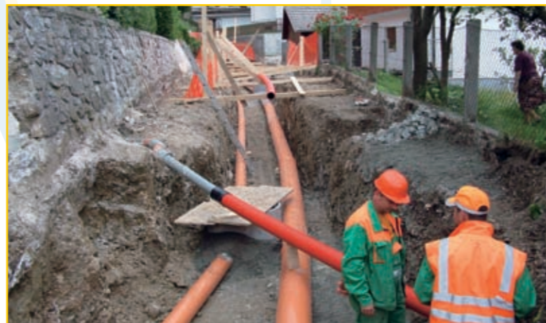
Na Podvasci smo zamenjali več kot 40 let star vodovod in zgradili ločen kanalizacijski sistem. Položili smo tudi plinovod, optiko, telefonski in elektro kabel in obnovili javno razsvetlavo. Najbolj nas veseli, da bodo Podvasci postopoma sledili ostali deli Tržiča. Pri tem bomo sledili načelu: kopljemo enkrat in takrat kvalitetno. V zemljo vstavimo kar največ možne komunalne infrastrukture.