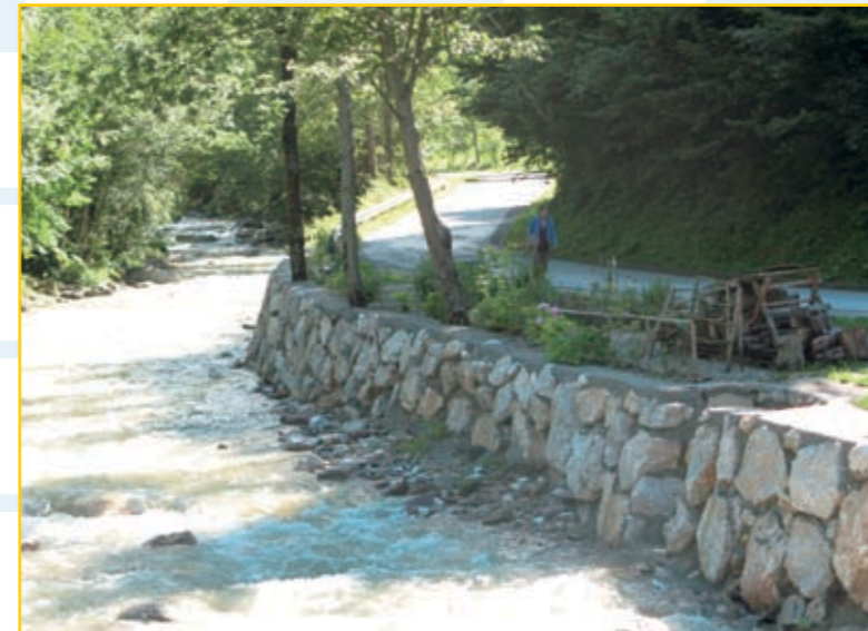
S sanacijo usada v Čadovljah smo preprečili spodkopavanje lokalne ceste.

V tržiške vodotoke se zadnjih deset let praktično ni vlagalo, zato je bilo tudi stanje izredno slabo. Zavedati se moramo, da se investicije v urejanje vodotokov v času vremenski ujm nekajkratno povrnejo in da se na ta način močno zmanjša morebitna škoda. Veseli nas, da smo v lanskem letu od države za odpravo posledic neurij uspeli pridobiti 237.000 EUR sredstev (Občina Tržič je k temu dodatno prispevala še 107.000 EUR), do leta 2010 pa pričakujemo še približno 1 MIO EUR s tega naslova. V tržiške vodotoke bo letos država preko Agencije RS za okolje vložila 1,2 MIO EUR.