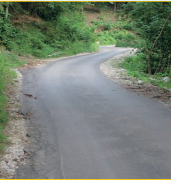
Asfaltiranje ceste Podljubelj–Čežovnik z ureditvijo odvodnjavanja.