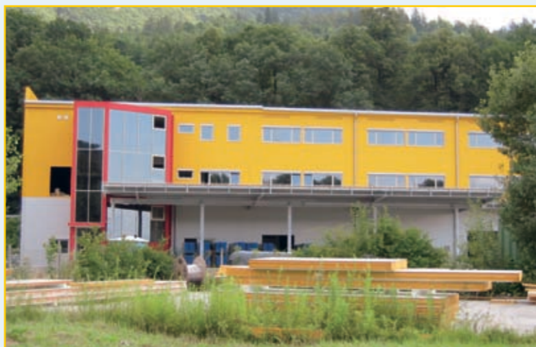
Na poti gospodarskega preboja na Mlaki.