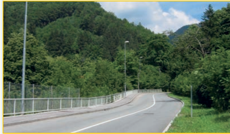
Dokončanje ceste Tržič–Slap.

Največ pozornosti smo namenjali obnovi in preplastitvi najbolj nujnih cestnih odsekov. Prav tako smo veseli, da so naša prizadevanja obrodila sadove pri obnovi državnih cest, kot je npr. cesta Bistrica–Ljubelj, kjer se je poleg vozišča obnovilo tudi predor. V načrtu Direkcije RS za ceste za leto 2009 pa so še investicije za ureditev ceste Begunje–Bistrica skozi naselje Bistrica v dolžini 250 metrov in ureditev avtobusnega postajališča .