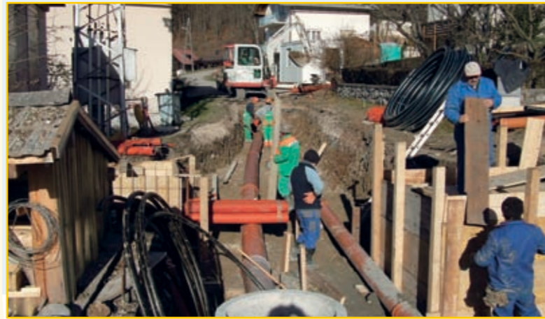
Na Podvasci bodo v avgustu dobili prenovljene ulice z najsodobnejšo komunalno infrastrukturo.