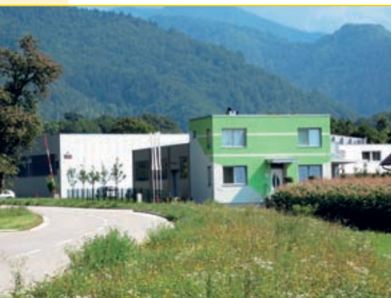
Vzpostavljane pogojev za industrijsko in obrtno-podjetniško cono Loka – plin in voda.

Občina Tržič je in bo podpirala aktivno zaposlovanje z zagotavljanjem neposrednih pomoči za novo zaposlene. Prav tako smo vstopili v gorenjsko štipendijsko shemo.