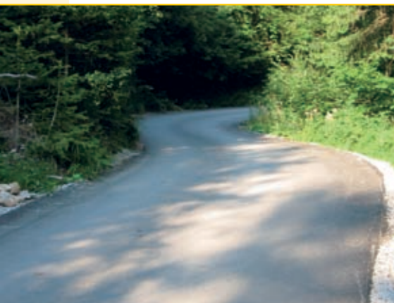
Asfaltiranje odseka ceste Potarje–Tič v Lomu. Še letos bomo pričeli z ureditvijo ceste v centru vasi.