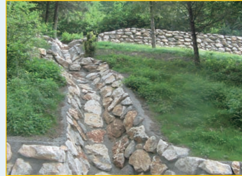
Nov odvodnik hudourniške vode na Ravnah skupaj s podpornim zidom. Obnovili bomo tudi porušeni leseni jez pod mostom na vhodu na Ravne.