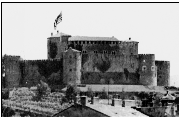
Goriški grad. Na stolpu plapola ameriška zastava.