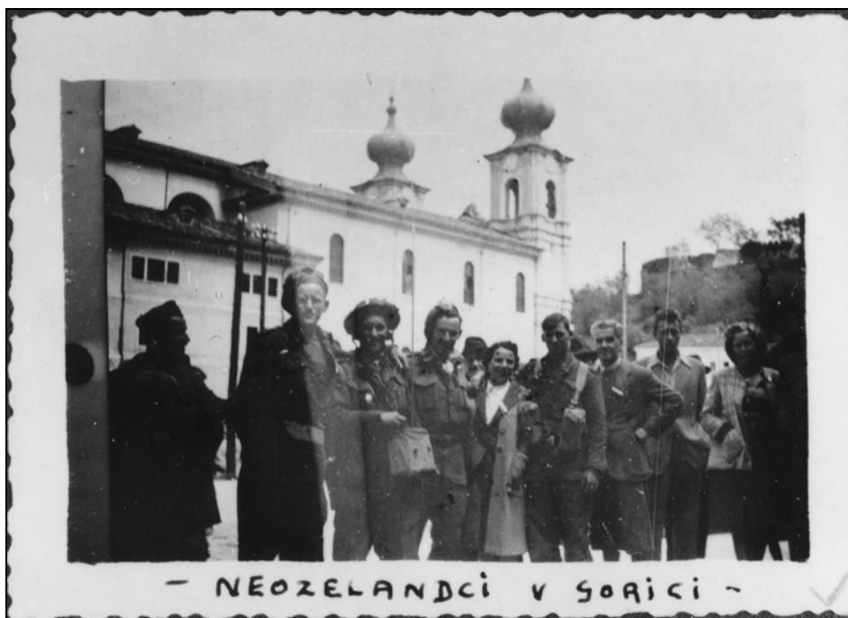
Novozelandske enote v Gorici, maj 1945.