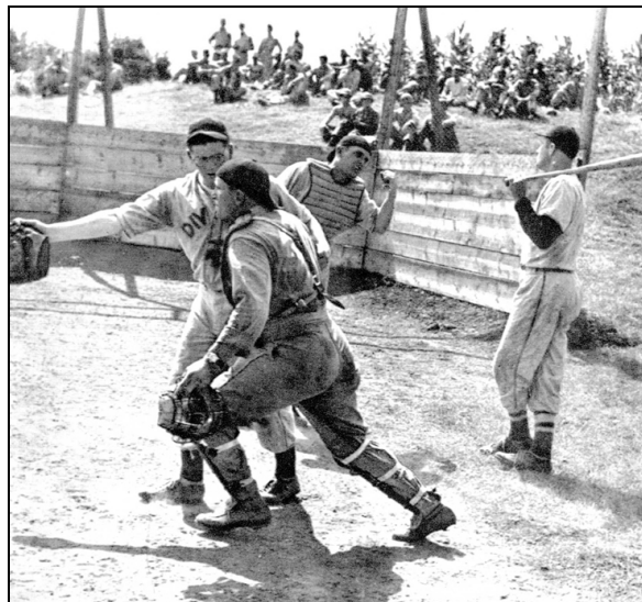
Zavezniški vojaki igrajo baseball na športnem igrišču Baiamonti v Gorici.

Tako pri italijanskih kot slovenskih pričevalcih omenjene enote kolaborantov poosebljajo zlo, barbarski primitivizem, ki se je udejanjal v zgodbah o nasilju, posiljevanju žensk in grobem ravnanju z vsakim sumljivim civilistom. Dodatni občutek gnusa je vzbujal njihov zanemarjeni videz. 38 Opisi angleških kolonialnih enot se povsem razlikujejo od opisov omenjenih vojaških formacij. Če je pri prvih prevladovala pripoved o zaraščenih in umazanih barbarih v razcapanih oblekah, nam opisi novih prišlekov prinašajo eksotične in pisane podobe skrivnostnih