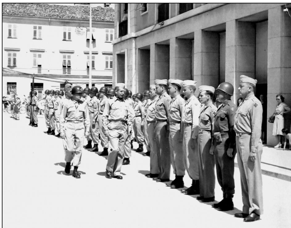
Postroj za dvig zastave in pregled enote. Enote 88. divizije pregleduje general Bryant E. Moore, poveljnik Blue Devilsov.

dela v drugih predelih Italije razlikovala v nekaterih točkah – niso širili predpisov postfašistične italijanske vlade, niso nameščali karabinerjev in drugih enot italijanske policije, pritožba na kasacijsko sodišče v Rimu ni bila mogoča, pokrajina se je imenovala area – 'okrožje', zamenjali so nazive funkcionarjev, za prehod v Italijo so vpeljali posebna potna dovoljenja. 12