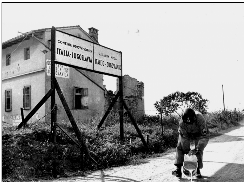
Ameriški vojak označuje novo razmejitveno območje, za postavljeno tablo so vidni proslovenski grafiti (hrani: Selvino Ceschia).

zahajali v bordele. Opiti so se tudi preteпали in razbijali imovino, 44 a so svoje dolgove tudi poravnali. Težave z alkoholom med zavezniškimi vojniki potrjuje peta točka poročila Gorizia Area Weekly & Monthly Reports , 45 ki navaja večje število opitih ameriških vojakov. Slednjih naj bi bilo po mnenju pisca poročila celo več kot v prejšnjem mesecu, kar naj bi bilo posledica prihoda novih vojakov, ki so prispeli iz Amerike in še niso bili navajeni tukajšnjega alkohola. Obravnavanih je bilo šestnajst primerov. 46