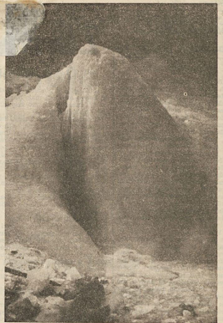
Lepote našega podzemja — Ledena jama

Po končani razstavi bodo razstavljene predmete prodali.