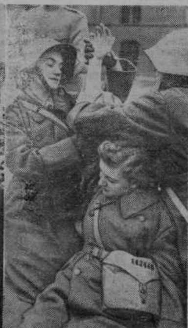
V nemško armado so uvedli ženske sanitetke kot pomožne čete. Slika nam predstavlja tri sanitetke pri vezbanju

da so nesrečnemu bitju ohranili življenje. Deček je dobil rento, naučil se je krojaštva. — Regent Horthy mu je rento spet obnovil ter jo bo najmlajši invalid svetovne vojne dobival do kraja življenja.