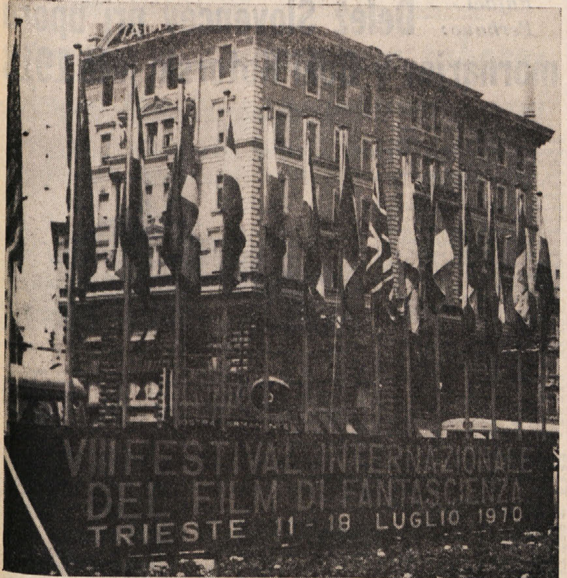
Jutri zvečer se bo na tržaškem gradu začel mednarodni festival znanstveno-fantastičnega filma. Na Trgu Oberdan že plapolajo zastave vseh sodelujočih držav

Svoja izvajanja je ravnatelj Košuta zaključil z ugotovitvijo, da je vodstvo Doma z gojenci zadovoljno. V domu so disciplinirani, v šoli uspevajo, prav lepo se udeležujejo na raznih področjih in se bopeta po ulicah ali poseba v gostinlah. Zaradi tega stariši tudi finančno skrbijo za vzdrževanje svojih otrok v zavodu. Vendarle to