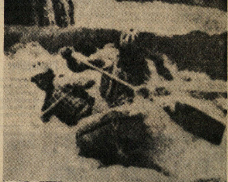
V teh vročih dneh se s športom ni prijetno ukvarjati, razen če smo dovolj pogumni, da se tako spustimo po hladnih valovih bistre gorske reke. Sicer pa bi kljub hladni vodi ob taki vožnji marsikomu postalo še bolj vroče...

Goriški Splügen Brüu je v preteklih dneh že začel s pripravami za prihodnjo sezono. Prva skupina košarkarjev se je že zbrala pod vodstvom trenerja McGregorja. V prihodnjih dneh pa bodo prispeili v Gorico še drugi igralci, ki jih je društvo kupilo za prihodnjo sezono.