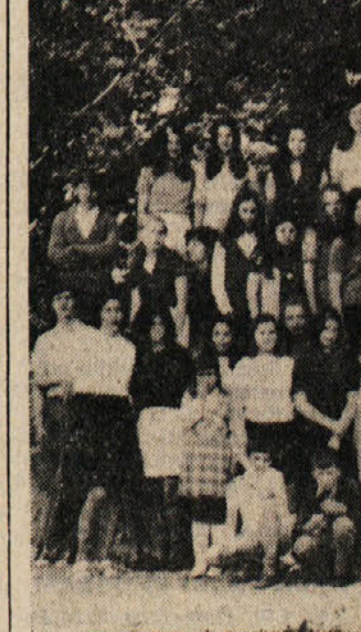
Gojenci dijaškega doma v Gorici v šolskem letu 1969-70

● Začetni sporazum so dosegli sindikati z zastopniki vodstev namakalnih konzorcijev. Ustnužen so dobili mesečni pretujem 10.000 lir. Pogajanja se nadaljujejo.