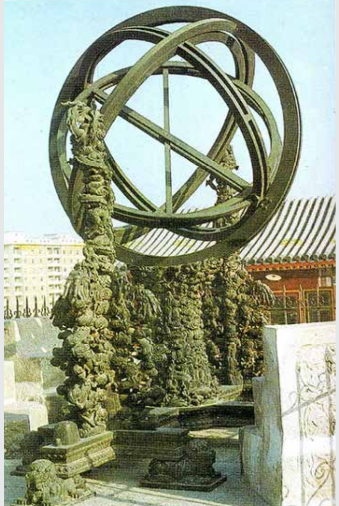
Hallersteinova obročasta krogla