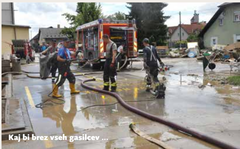
Kaj bi brez vseh gasilcev ...