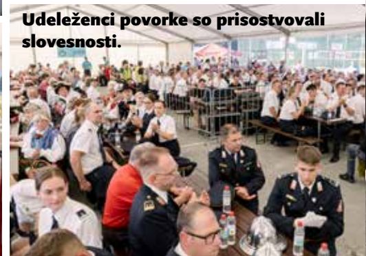
Udeleženci povorke so prisostvovali slovesnosti.