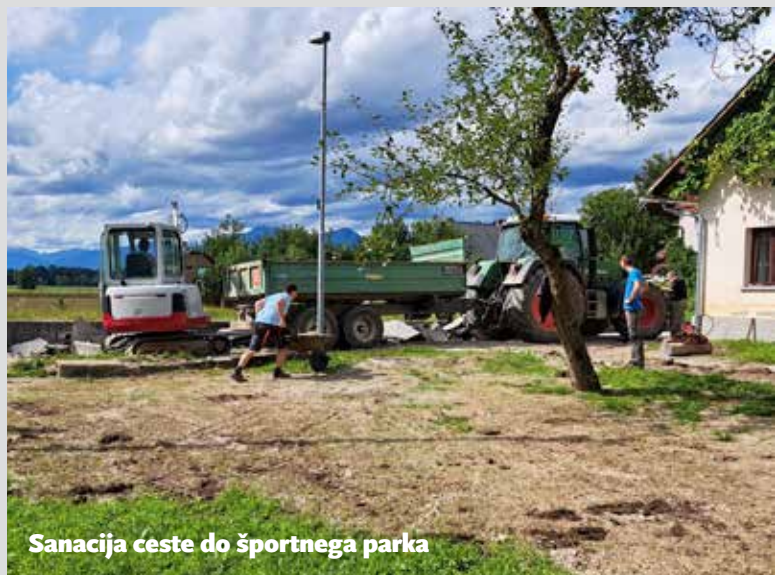
Sanacija ceste do športnega parka

Besedilo: Janez Koncilija za PGD Topole