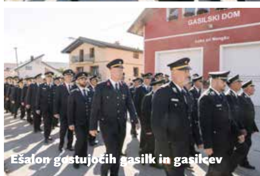
Ešalon gostujočih gasilk in gasilcev