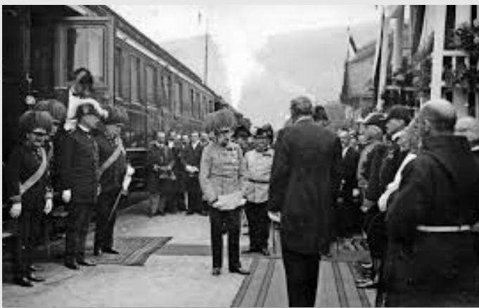
Sprejem na železniški postaji v Ljubljani