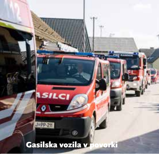
Gasilska vozila v povorki