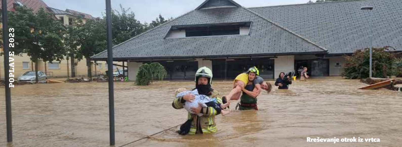
Reševanje otrok iz vrtca