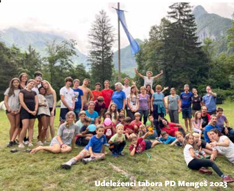
Udeleženci tabora PD Mengeš 2023