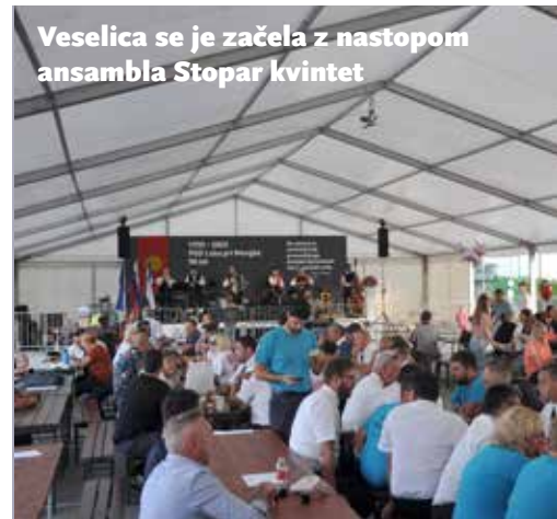
Veselica se je začela z nastopom ansambla Stopar kvintet