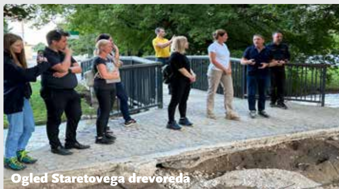
Ogled Staretovega drevoreda

Besedilo in foto: Barbara Kopač za Občinsko upravo