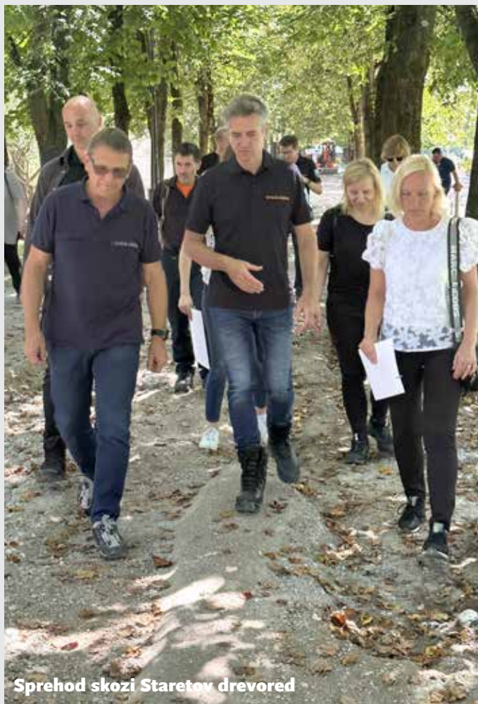
Sprehod skozi Staretove dreved

Besedilo in foto: Barbara Kopač za Občinsko upravo