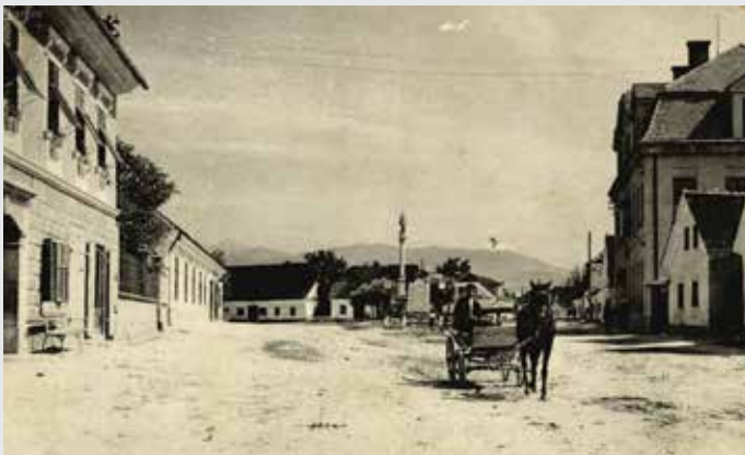
Glavni trg v Mengšu z znamenjem in spomenikom zadaj, 1930