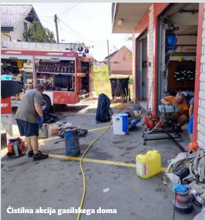
Čistilna akcija gasilskega doma