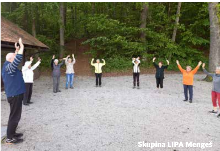
Skupina LIPA Mengeš