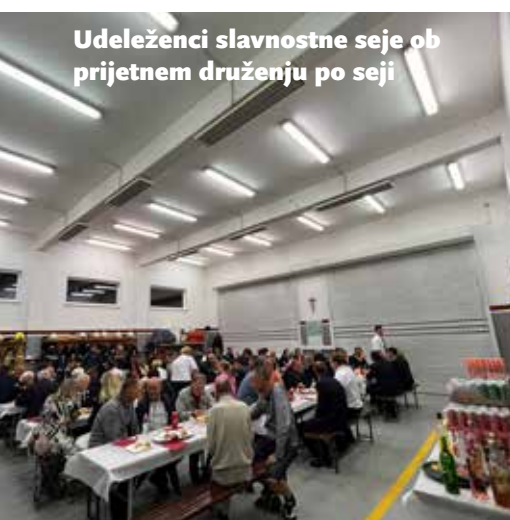
Udeleženci slavnostne seje ob prijetnem druženju po seji