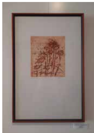
Leonida Goropevšek - Grafika rezervaž - Rožice