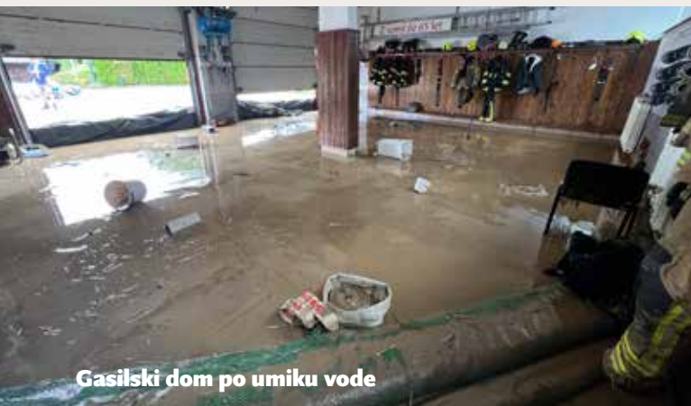
Gasilski dom po umiku vode