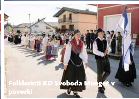
Folkloristi KD Svoboda Mengeš v povorki