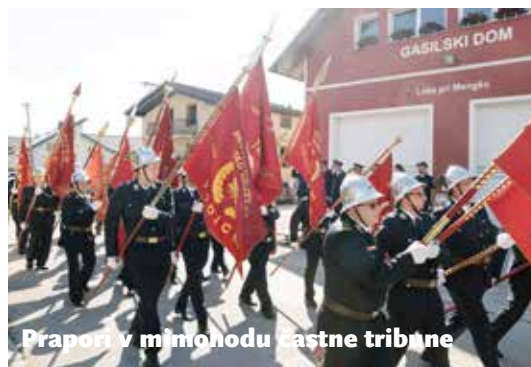
Prapori v mimohodu častne tribune