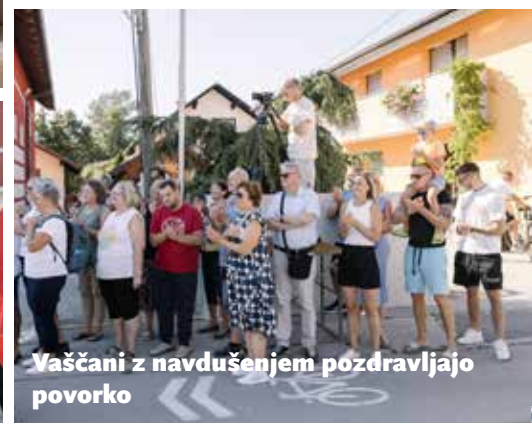
Vaščani z navdušenjem pozdravljajo povorko