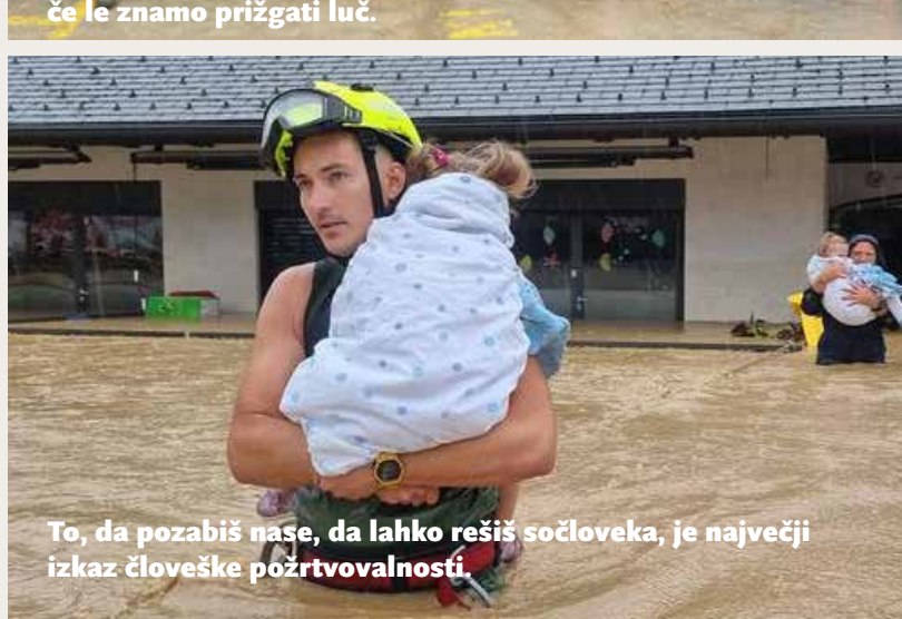
To, da pozabiš na sebe, da lahko rešiš sočloveka, je največji izkaz človeške požrtvovalnosti.