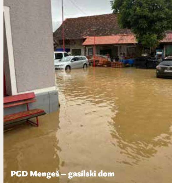
PGD Mengeš – gasilski dom

izvajali obhode na vsako uro in pregledovali struge, mostove ter hkrati stalno spremljali vodostaj Pšate.