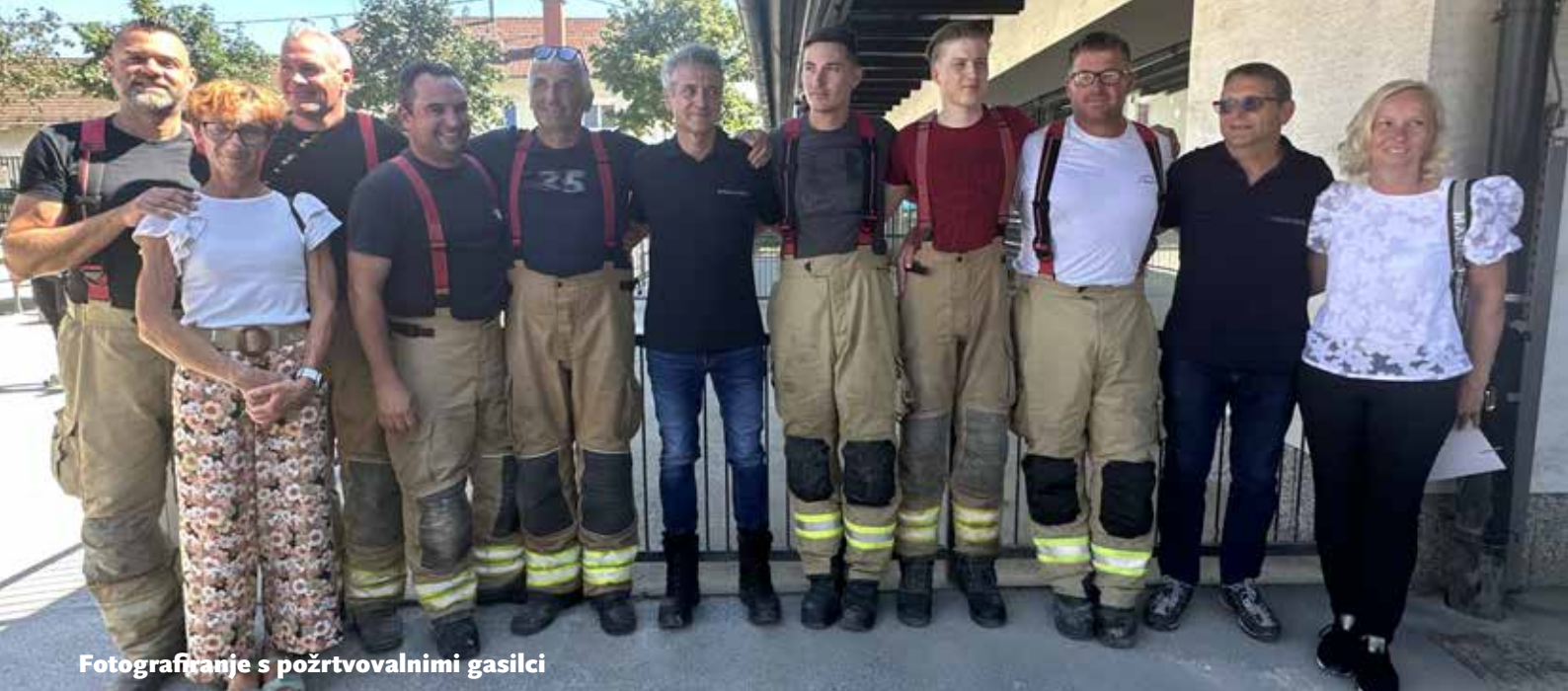
Fotografiranje s požrtvovalnimi gasilci