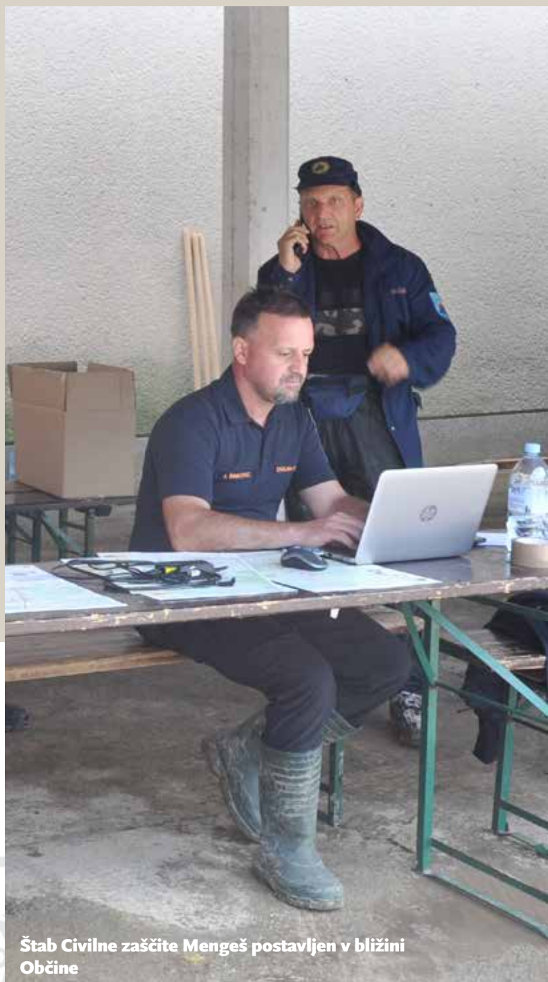
Štab Civilne zaščite Mengeš postavljen v bližini Občine

Glavni ključ za dolgoročno zagotovitev varnosti občine Mengeš – kot tudi sosednjih občin – tako predstavlja sistemsko ureditev vseh vodotokov – od izvira do izliva na našem širšem območju. Zato sem glasen zagovornik urgentne izgradnje že pred leti načrtovanega zadrževalnika vode v Komendi.