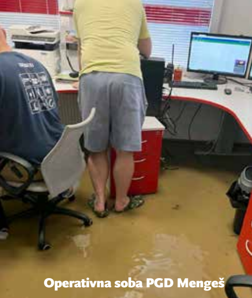
Operativna soba PGD Mengeš