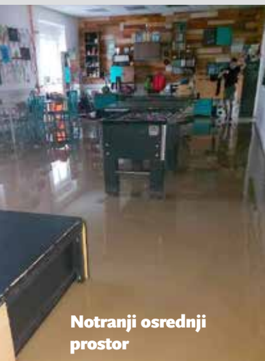
Notranji osrednji prostor

Besedilo: Tea Vuga, Blanka Tomšič