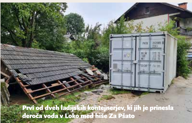
Prvi od dveh ladijskih kontejnerjev, ki jih je prinesla deroča voda v Loko med hiše Za Pšato