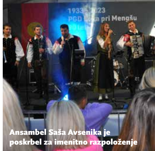
Ansambel Saša Avsenika je poskrbel za imenitno razpoloženje