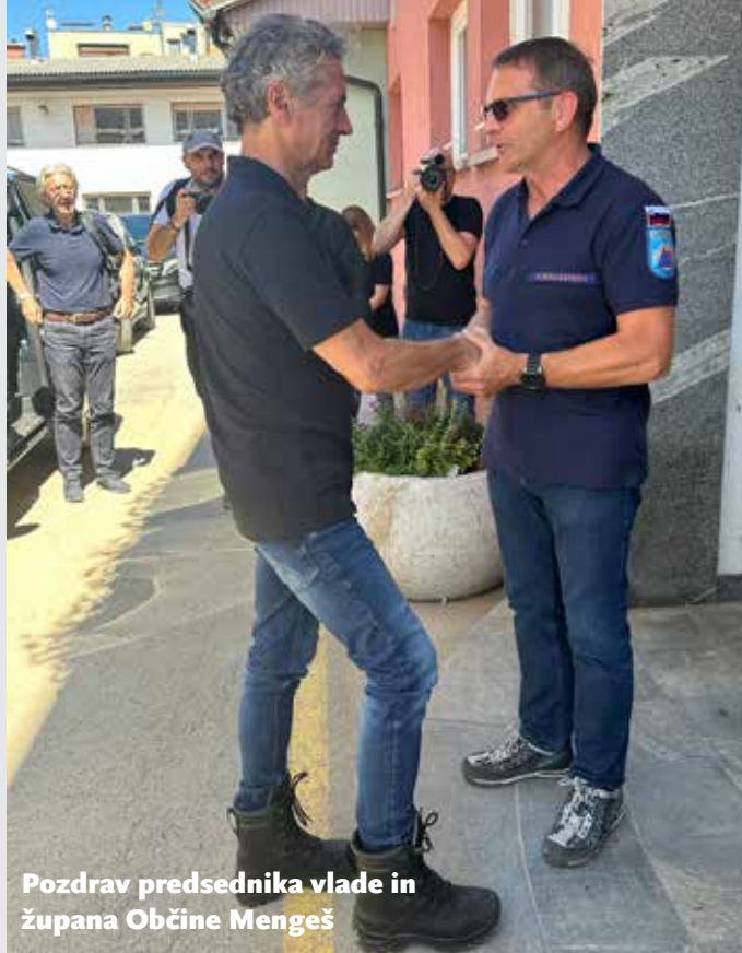
Pozdrav predsednika vlade in župana Občine Mengeš