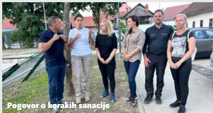
Pogovor o korakih sanacije