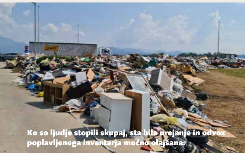
Ko so ljudje stopili skupaj, sta bila urejanje in odvoz poplavljenega inventarja močno olajšana.