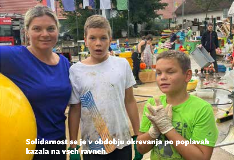
Solidarnost se je v obdobju okrevanja po poplavih kazala na vseh ravneh.