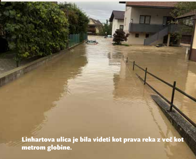
Linhartova ulica je bila videti kot prava reka z več kot metrom globine.