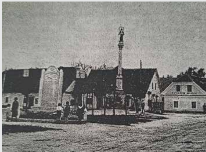
Mesto sprejema Mengeš