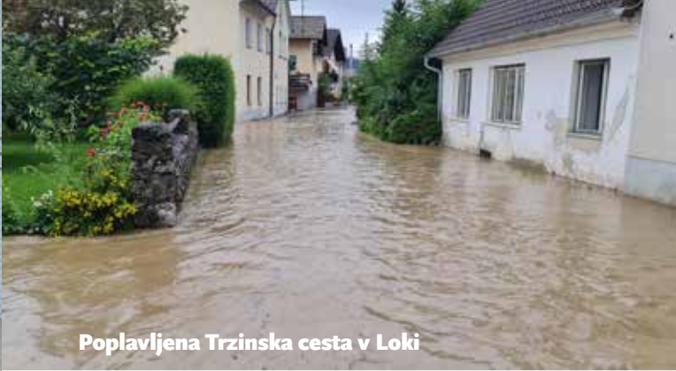
Poplavljeni Trzinska cesta v Loki