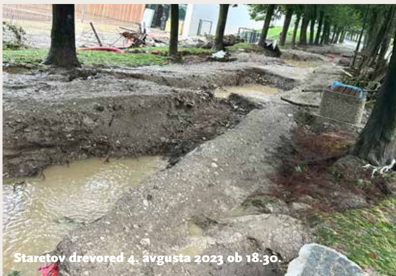
Staretov drevored 4. avgusta 2023 ob 18.30.