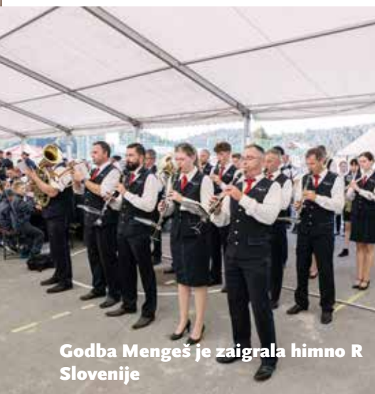
Godba Mengeš je zaigrala himno R Slovenije