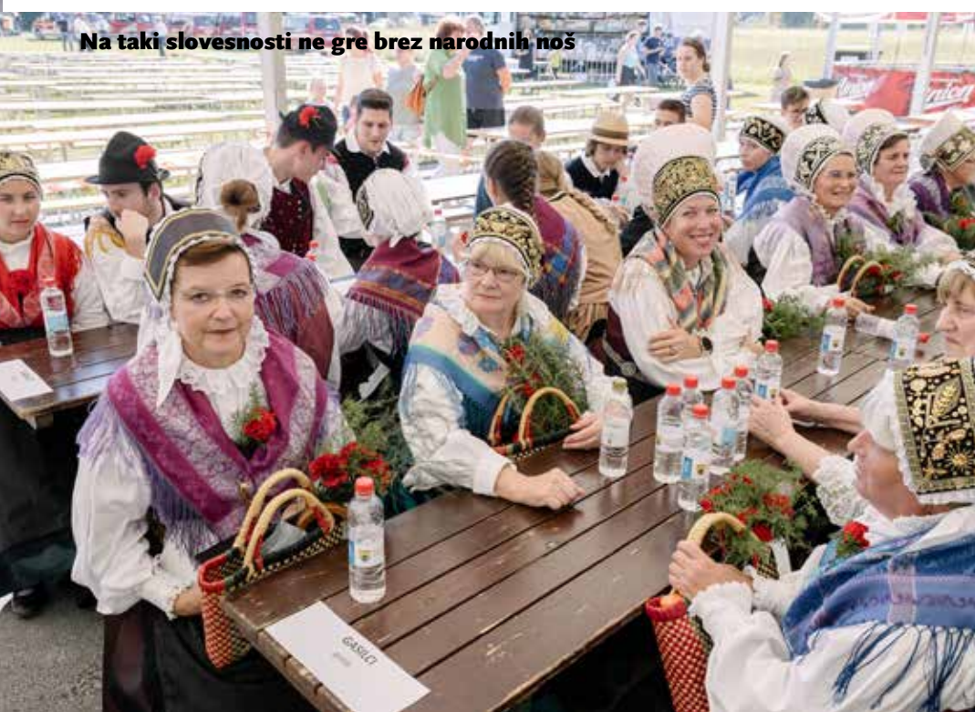
Na taki slovesnosti ne gre brez narodnih noš