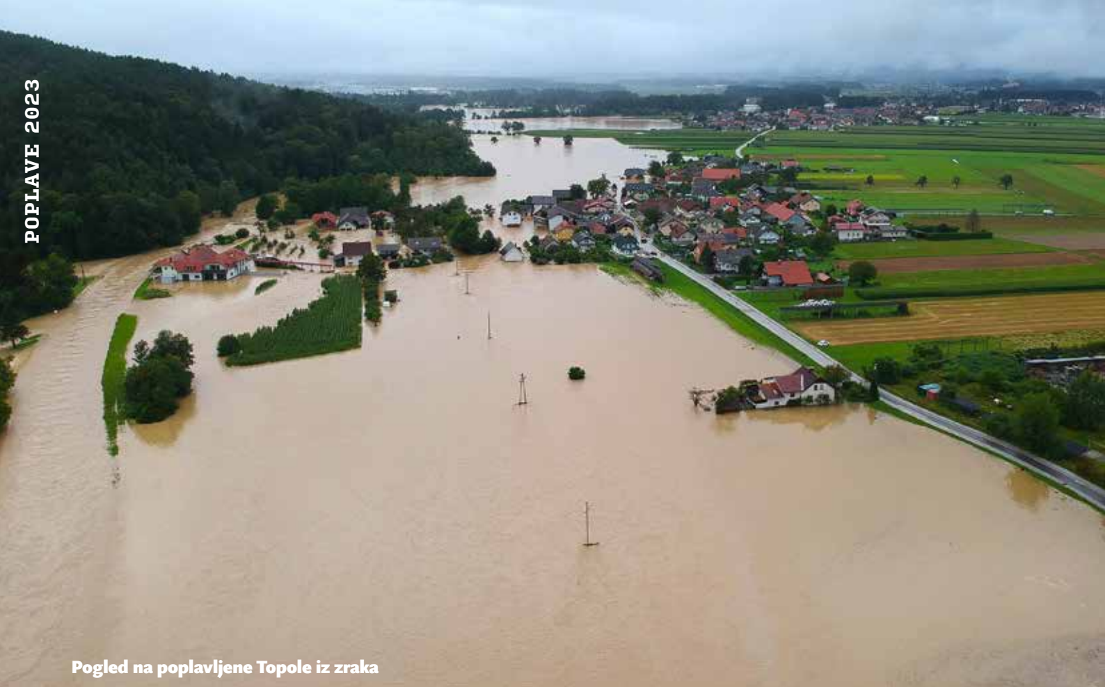
Pogled na poplavljene Topole iz zraka