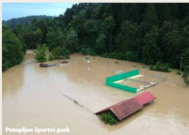
Potopljen športni park

Višina poplavnega vala je dala vedeti, da ne bo možno ustrezno zaščititi tistih objektov, ki so bili že v preteklem obdobju izpostavljeni vodnim ujmam, zato je bil zvok sirene tudi opozorilo za evakuacijo, kar so stanovalci najbolj ogrožene hiše k sreči upoštevali,