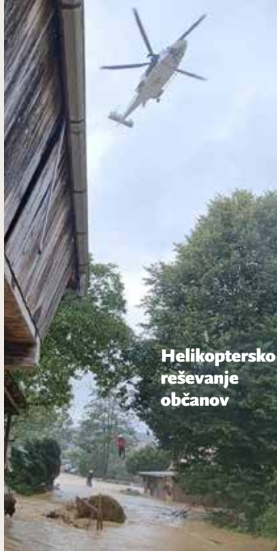
Helikoptersko reševanje občanov

skem domu in obiskuje mo tečajje ter vaje, organizirane na nivoju Gasilske zveze Slovenije, ki potekajo v gasilsko-izobraževalnem centru na Igu pri Ljubljani.