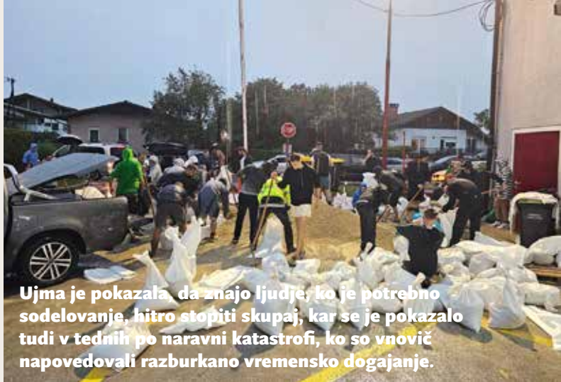
Ujma je pokazala, da znajo ljudje, ko je potrebno sodelovanje, hitro stopiti skupaj, kar se je pokazalo tudi v tednih po naravni katastrofi, ko so vnovič napovedovali razburkano vremensko dogajanje.