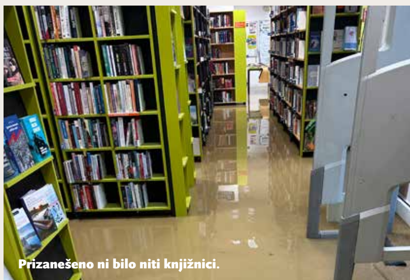
Prizanešeno ni bilo niti knjižnici.