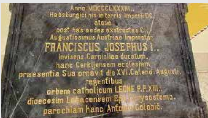
Spominska plošča v Cerkljah

uredili vse potrebno. Teden dni pred obiskom je na Kranjsko prišel tudi dvorni furnir (oseba, ki skrbi za cesarjevo prehrano in prenočevanje). Ta je osebno obiskal vse lokacije predvidenih nočitev in prehrane na poti in natančno razdelal vse jedilnike, prehrano, pijačo, kar je bilo potrebno.