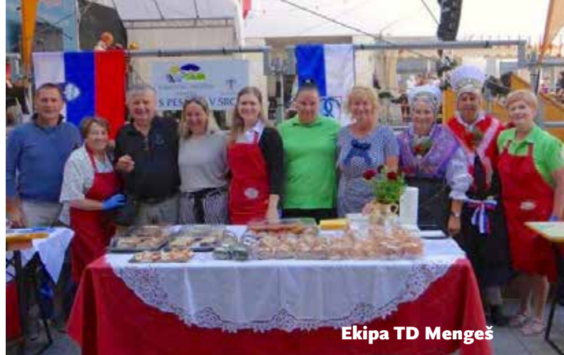
Ekipa TD Mengeš