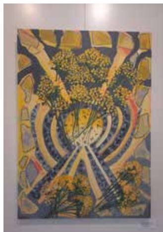
Helena Testen - mešana tehnika - Info Immortelle