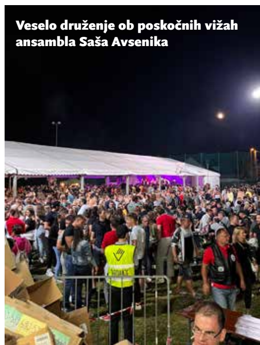
Veselo druženje ob poskočnih vižah ansambla Saša Avsenika