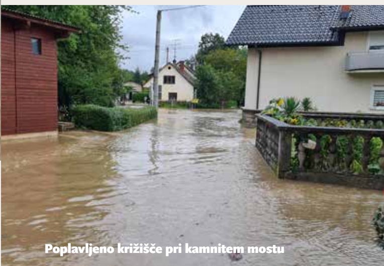
Poplavljeni križišče pri kamnitem mostu