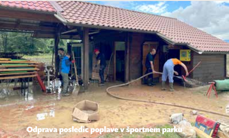
Odprava posledic poplave v športnem parku

delavci Metal profila, SS Metala in Filtopa iz industrijske cone, na razpolago so dali strojno opremo za prevoz palet s protipoplavnimi vrečami, pomagali so tudi delavci Trenda in AS AN. Na klic alarma so se odzvali gasilci iz Mengša in Loke, ki pa so morali zaradi naraščajoče vode kmalu oditi na pomoč na svoja področja. Pripravljeni pomagati so bili kmetje s traktorji in prikolicami. Prišel je tudi delavec podjetja HNG z delovnim strojem za morebitne zemeljske posege, ki bi zmanjšali nevarnost, kar pa žal ni bilo več možno. Z njegovim strojem smo skušali izvesti reševanje ogrožene osebe, ki je ostala v poplavljenem objektu, vendar je stroj že na polovici poti zalila voda, tako da se je moral umakniti. Položaj ogroženega se je zato preveril s klicem po telefonu, po njegovem zagotovilu, da je varen, pa je vsem odleglo; tudi zato, ker v vsej nesreči ni bilo poškodovanih ali še huje, ni bilo smrtnih žrtev, kar bi se ob nepravčasnem alarmiranju kaj lahko zgodilo.