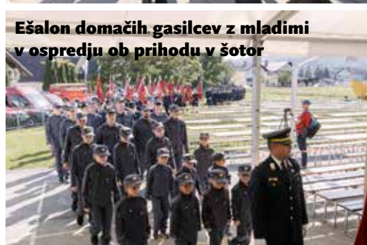
Ešalon domačih gasilcev z mladimi v ospredju ob prihodu v šotor