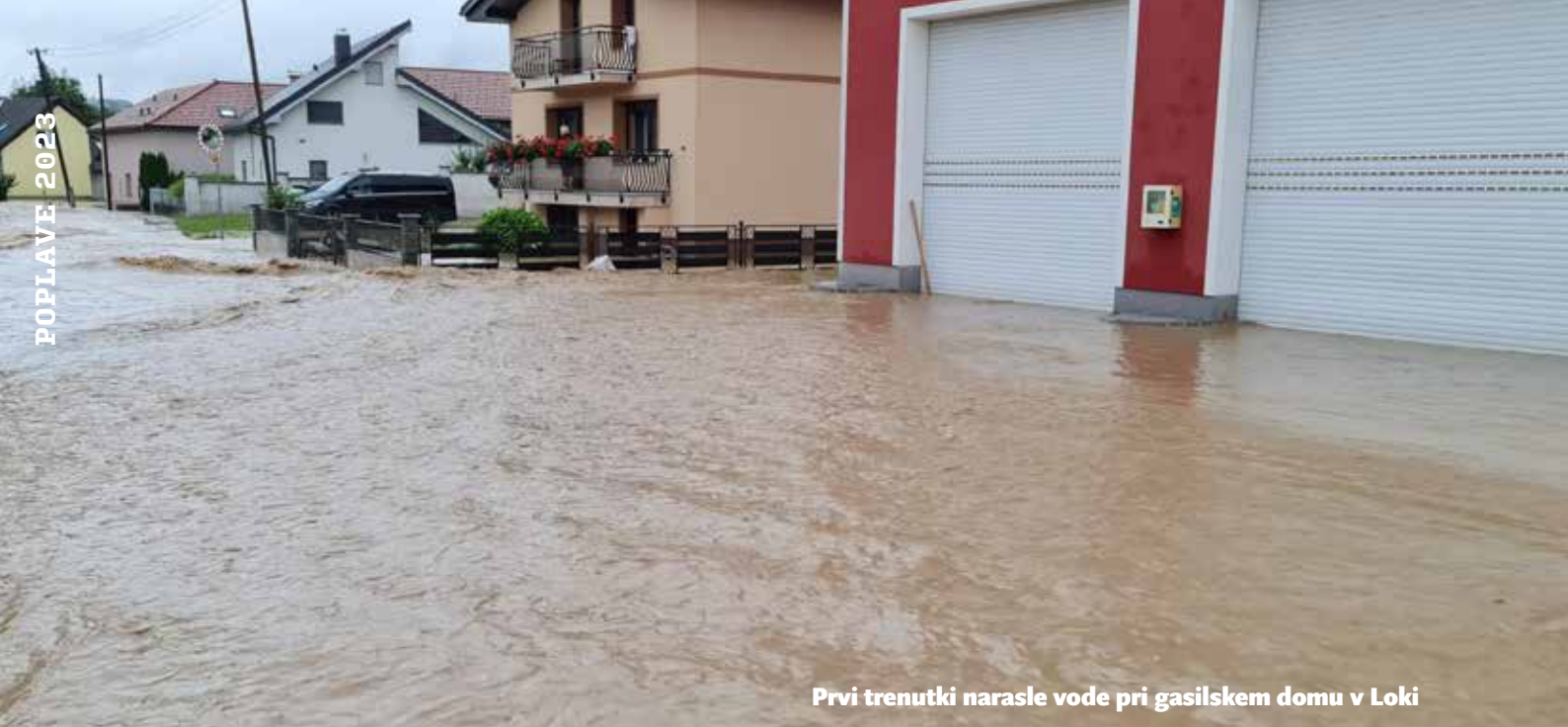
Prvi trenutki narasle vode pri gasilskem domu v Loki