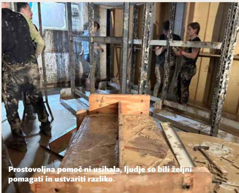
Prostovoljna pomoč ni usihala, ljudje so bili željni pomagati in ustvariti razliko.