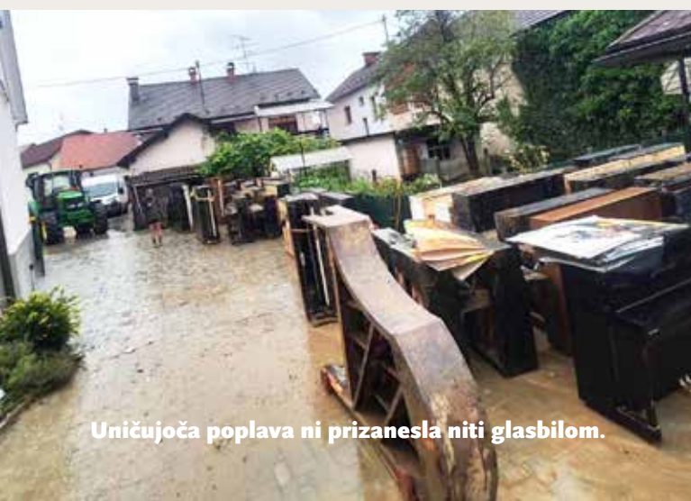
Uničujoča poplava ni prizanesla niti glasbilom.