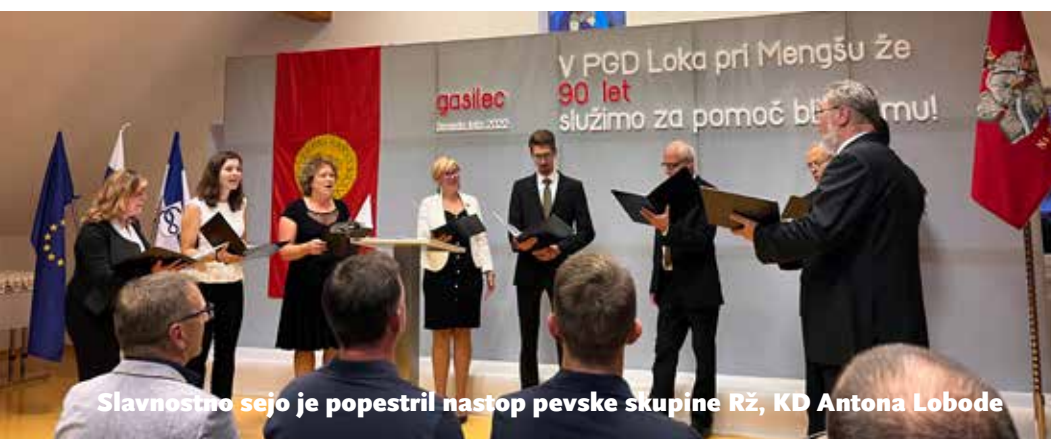
Slavnostno sejo je popestril nastop pevske skupine RŽ, KD Antona Lobode