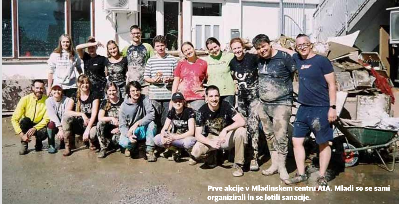
Prve akcije v Mladinskem centru AIA. Mladi so se sami organizirali in se lotili sanacije.