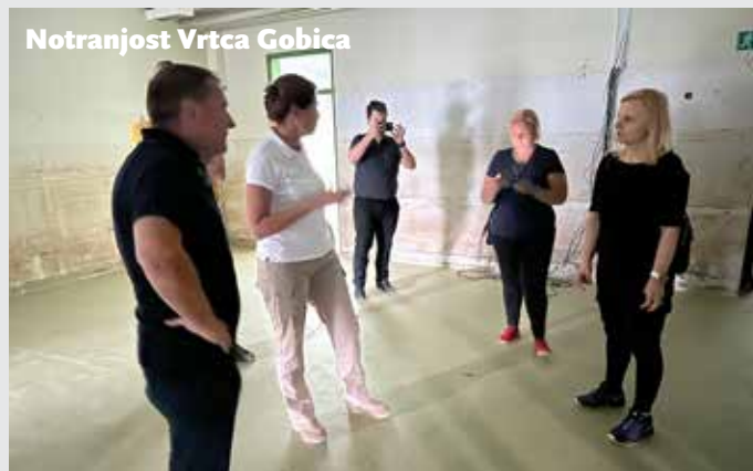
Notranjost Vrtca Gobica