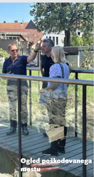
Ogled poškodovanega mostu