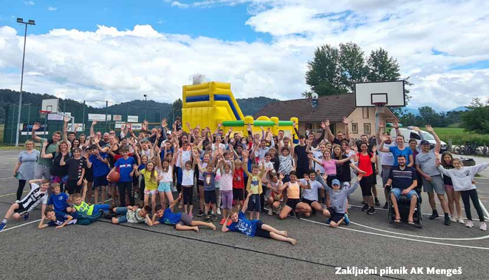
Zaključni piknik AK Mengeš