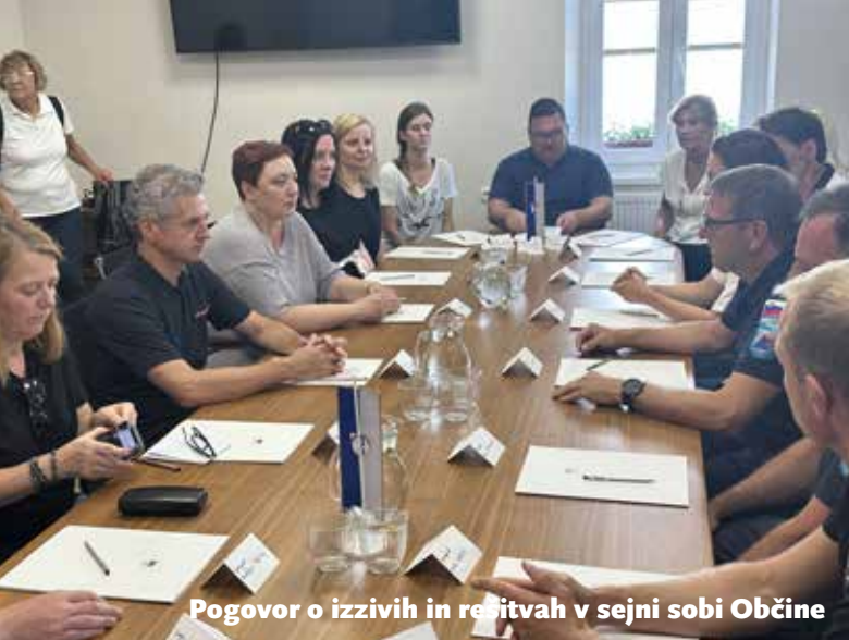
Pogovor o izzivih in rešitvah v sejni sobi Občine