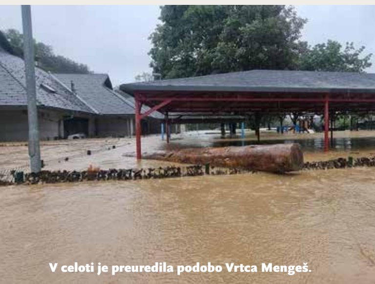
V celoti je preuredila podobo Vrtca Mengeš.