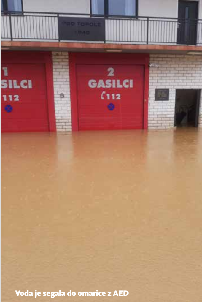
Voda je segala do omarice z AED