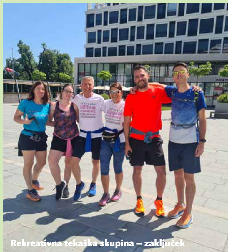
Rekreativna tekaška skupina – zaključek