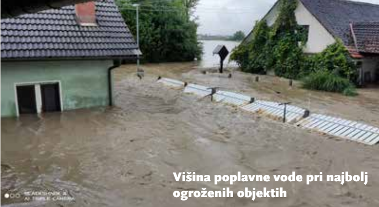
Višina poplavne vode pri najbolj ogroženih objektih