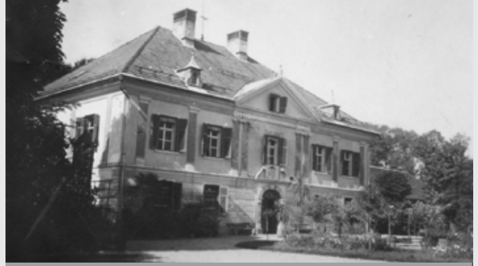
Ravbarjev ali Zgornji grad v Mengšu