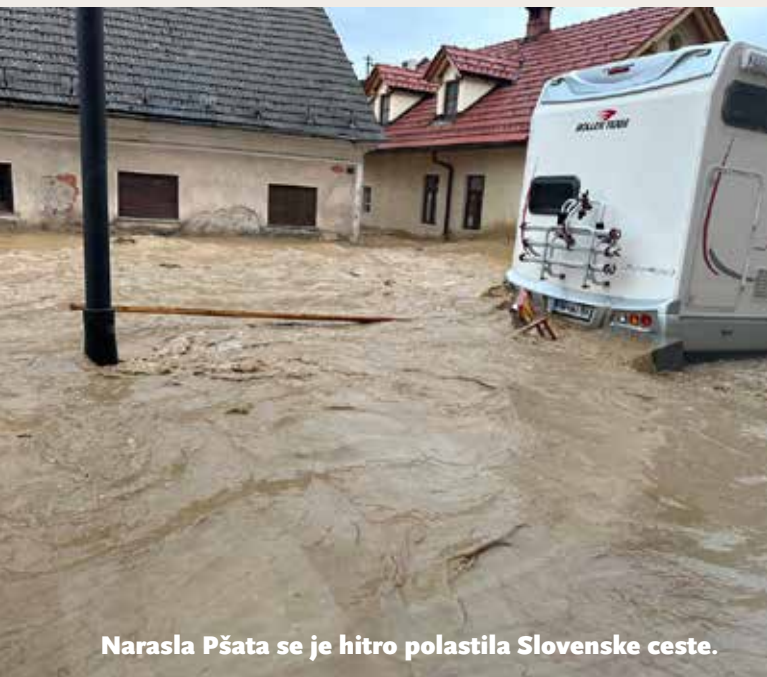
Narasla Pšata se je hitro polastila Slovenske ceste.