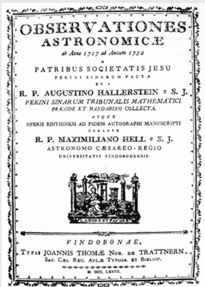
Naslovnica najobsežnejšega Hallersteinovega dela