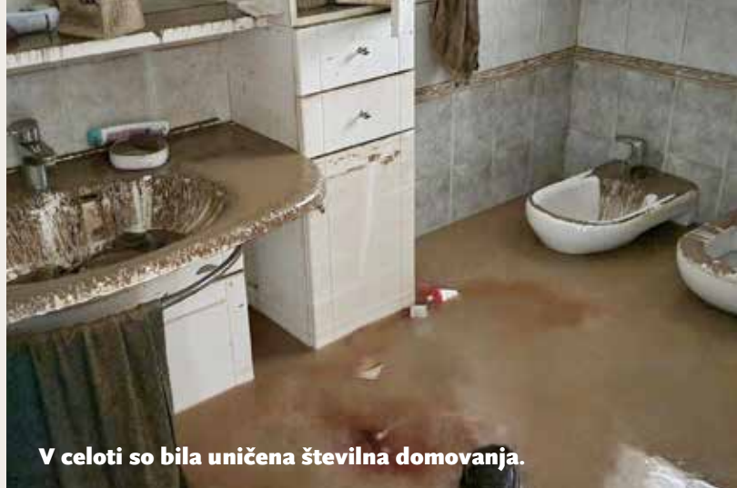
V celoti so bila uničena številna domovanja.