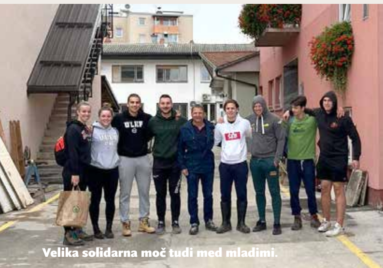
Velika solidarna moč tudi med mladimi.