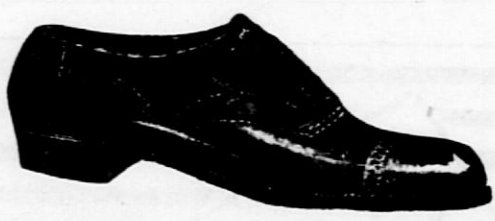
Črni ali rjavi za vsakdanjo nošo