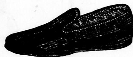
Gorki iz himalaja tkanine