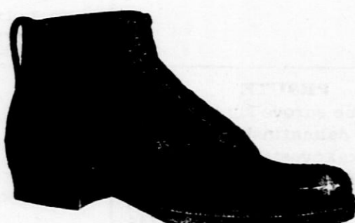
Iz čulboksa, posebno močni za štrapec