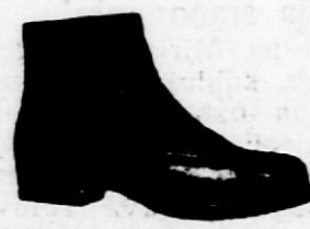
Iz črnega boksa srednje veliki