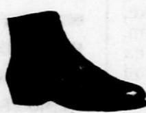
Za male otroke črni ali rjavi