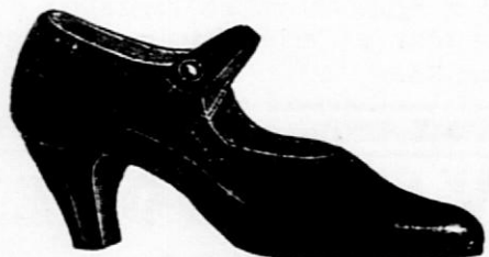
Kombinirani ali gladki