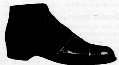
Črni ali rjavi za vsakdanjo nošo

Vsa pleskarska in sobosilkarska dela izvršuje točno, solidno in po konkurenčnih cenah pod garancijo