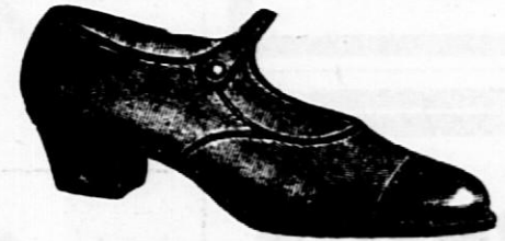
Kombinirani ali gladki črni ali rjavi