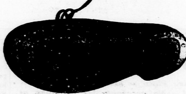
Iz rjave ali črne močne kravine za delavce