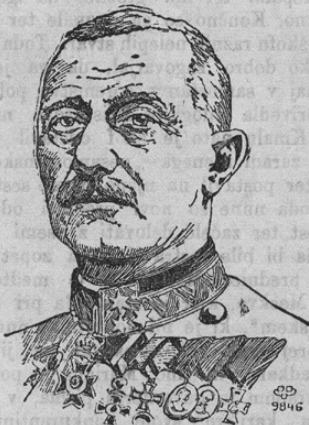
Armeinspektor Oskar Potiorek.

Naša slika kaže armadnega inšpektorja Oskarja Potioreka, ki je igral pri zadnjih krvavih dogodkih tako veliko vlogo v Sarajevu. Bil je