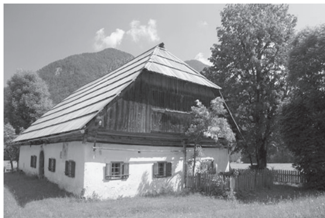
Slika 10: Pocarjeva domačija.

Foto: skiciral Miha Markelj, po predlogi (Fister, 1993: 24), Zgornja Besnica, junij 2009