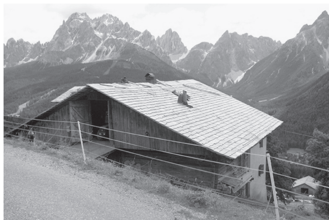
Slika 4: Domačija z lesenim mostom za dostop v podstrešne prostore. Foto: Miha Markelj, Sexten/Sesto, Südtirol/Alto Adige, julij 2009

stabilno podlago kot tista, grajena na pobočju. Vzorčni primeri domačij, grajenih na pobočju, so v vasi Zgornje Danje. Na širino hiše je vplivalo tudi umetno nasutje ali umetna gradnja terase na pobočju, hebel , 5 ki je statično omogočil gradnjo širše hiše. V tem času je bila hiša že delno zidana, s kamnitimi temelji in z večjim številom notranjih prostorov. Še vedno pa je ostajal v prednjem, čelnem delu hiše, ki je gledal proti dolini, bivalni prostor za ljudi, v zadnjem delu hiše pa prostor za živino (v večini primerov gre le za en prostor). V podstrešnih prostorih so shranjevali seno. Prav tako so pri taki hiši vidni različni vhodi vanjo, saj notranjih stopnic v tem času ni bilo. Najnižji vhod je na prednji čelni strani, ki gleda proti dnu doline in vodi v klet – keler ali v poznejših obdobjih v domačo delavnico. Drugi vhod je bil s strani in je vodil v bivalni del hiše, tretji vhod, ki je vodil v zgornji del hiše, pa je lahko prav tako s strani ali pa v zadnjem delu hiše s pobočja. Njegova postavitve je bila odvisna od naklona pobočja in od velikosti hiše. Zadnji, četrti vhod na senik – dah je bil vedno v zadnjem delu hiše, vstop vanj pa je bil mogoč neposredno s