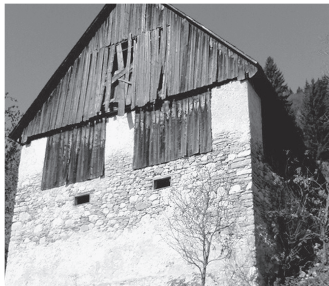
Slika 6: Domačija Zgornjega Trojarja. Foto: Miha Markelj, Zgornje Danje (zaselek Trojar), oktober 2008

pobočja ali pa čez leseni most (Slika 4.) V Zalem Logu, kjer pobočje ni bilo tako strmo, so ljudje seno v prostor pod streho nakladali z vilami, neposrednega dostopa do senika pa ni bilo. Domačija Gajger je imela glavni vhod s strani tako kot domačija Tschurschentaler. Strehe so bile še vedno pokrite s škodlami, vendar so jih v Selški dolini v začetku 18. stoletja začele zamenjevati škrlilaste kritine. 6 Tudi zato je Gajgerjeva hiša v Zgornjih Danjah še danes pokrita s škrlilom. Za hiše, kot sta Gajgerjeva in Tschurschentalerjeva, je bil značilen tudi velik zatrej, redkokatera hiša pa je v tem času imela neposredno pod zatrejom tudi zunanji balkon. Ta se je začel v večji meri pojavljati v poznejših obdobjih.