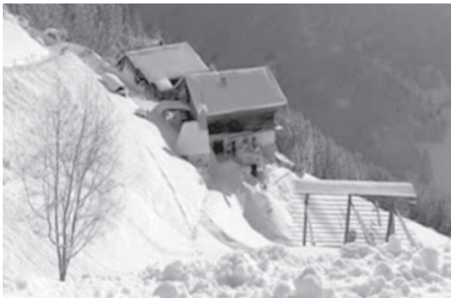
Slika 7: Geigerieva domačija.

Foto: Angelika Burgmann, Innichen/San Candido, Südtirol/Alto Adige, februar 2008