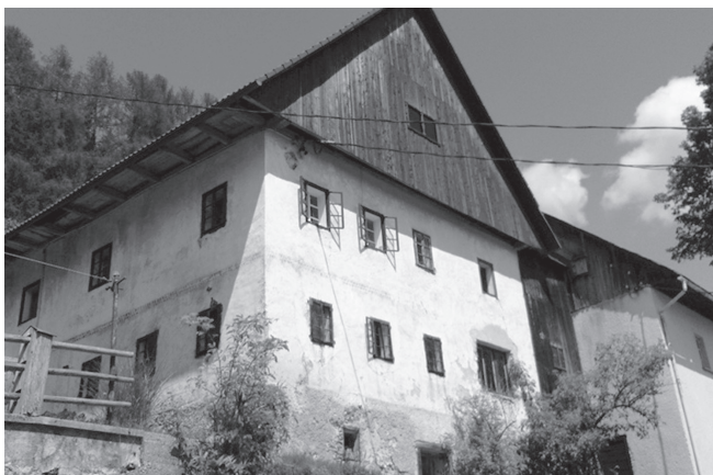
Slika 2: Domačija Gajger. Foto: Miha Markelj, Zgornje Danje, julij 2009

Hišo, v celoti zgrajeno iz lesa, so vedno postavili na prisojno stran hriba, s čelno stranjo obrnjeno proti dnu doline. V tej fazi kamnitih temeljev najverjetneje še ni bilo. Okna na hiši so bila majhna, kar je bilo pomembno za akumuliranje toplote v prostoru. Hiša je imela s skodlami krito ozko in strmo ostrešje, da bi velike količine snega čim hitreje zdrsele s strehe. V najzgodnejši fazi je bil prostor za živino v isti stavbi, vendar v prostoru, ločenem od bivališča ljudi, v podstrešnih prostorih – dahu pa so shranjevali seno. Sorodne strukture prvotnih hiš je danes mogoče prepoznati v najstarejših senikih, ki so bili grajeni na podoben način kot najzgodnejša bivališča (Slika 1).