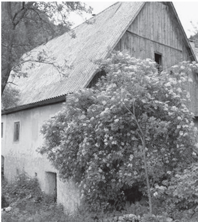
Slika 11: Domačija nad Baško grapo. Foto: Miha Markelj, Stržišče, junij 2009

Gajger v Zgornjih Danjah (Slika 2). Če jo primerjamo s Štihlovo hišo v Zgornji Besnici (škofjeloški tip) (Slika 9) in Pocarjevo domačijo v Zgornji Radovni (gorenjski tip) (Slika 10), lahko med njimi opazimo tipološke razlike.