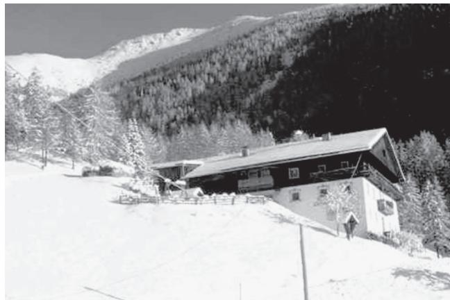
Slika 3: Tschurtschenthalerjeva domačija. Foto: Miha Markelj, Sexten/Sesto, Südtirol/Alto Adige, januar 2009

Lep primer gradnje objektov do leta 1800 je domačija Gajger v vasi Zgornje Danje nad Selško dolino. V primerjavi s Tschurtschenthalerjevo domačijo nad vasjo Sexten (ital. Sesto ) v Pustarški dolini lahko vidimo, da sta pri obeh usklajena čas nastanka ter lokacija postavitve (Slik 2 in 3). V tej razvojni fazi se je tirolski tip hiše zvišal in razširil v dolžino in širino. Širina hiše je bila odvisna od naklona pobočja; večji je bil naklon, ožja je bila struktura. Tako so bile tiste hiše, ki so stale visoko na pobočju, praviloma ožje od tistih, ki so stale bližje dolinskemu dnu, saj je imela struktura v dnu doline več prostora za gradnjo ter bolj