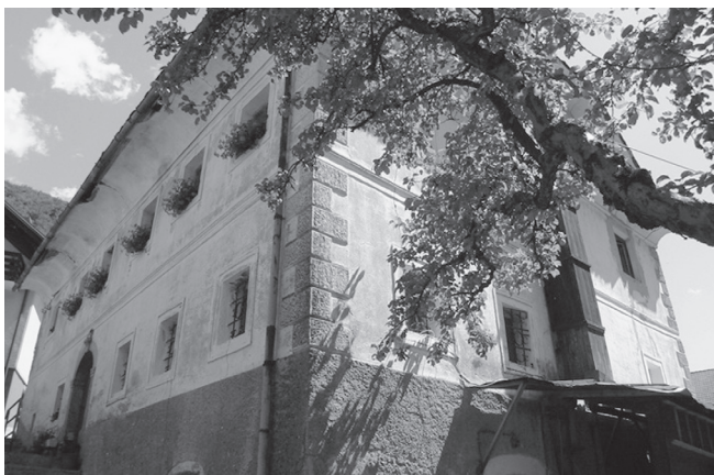
Slika 8: Domačija Habjan.

Foto: Angelika Burgmann, Innichen/San Candido, Südtirol/Alto Adige, februar 2008