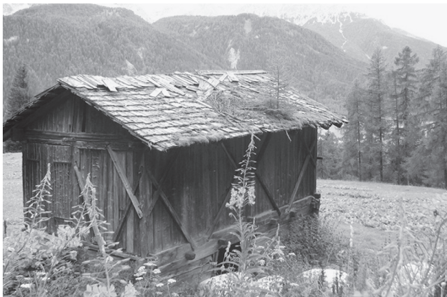
Slika 1: Lesena struktura v Zgornjem delu Pustarške doline. Sexten/Sesto, Südtirol/Alto Adige, julij 2009