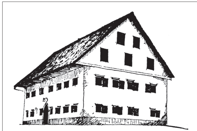
Slika 9: Štihlova hiša.

V drugi polovici 19. stoletja je na Tirolskem vidna kontinuiteta gradnje enakih stanovanjskih struktur kot stoletje pred tem. Dozidavali so le balkone, ki pa funkcionalno niso imeli pomembnejše vloge. Vzorčni primer sta domačiji Raut in Egarthof v vasi Sexten. Na arhitekturo zgornjega dela Selške doline pa so v tem času močno vplivala bližnja mesta in trgi (Železniki, Škofja Loka), saj so se na fasadah bogatejših hiš pojavljali tipični meščanski ornamenti: polkrožno zaključeni portali iz zelenega tufa, železne rešetke – gautre na okenskih odprtinah ter zidana notranja stopnišča. Takrat se je na tem območju razmahnilo tudi škriklarstvo, ki je skodlaste strehe nadomestilo s kamnitimi. Omenjena obrt se je najbolj razširila v Zalem Logu, zaradi blagostanja, ki ga je prinesla, pa je tu največje število hiš z meščanskimi elementi. Tipičen objekt takega načina gradnje je domačija Habjan na Zalem Logu številka 12 (Slika 8). V tej fazi se je po-