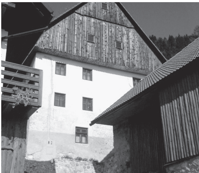
Slika 5: Domačija Zgornjega Trojarja. Foto: Miha Markelj, Zgornje Danje (zaselek Trojar), oktober 2008