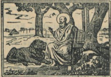
Kapljice sv. Marka.