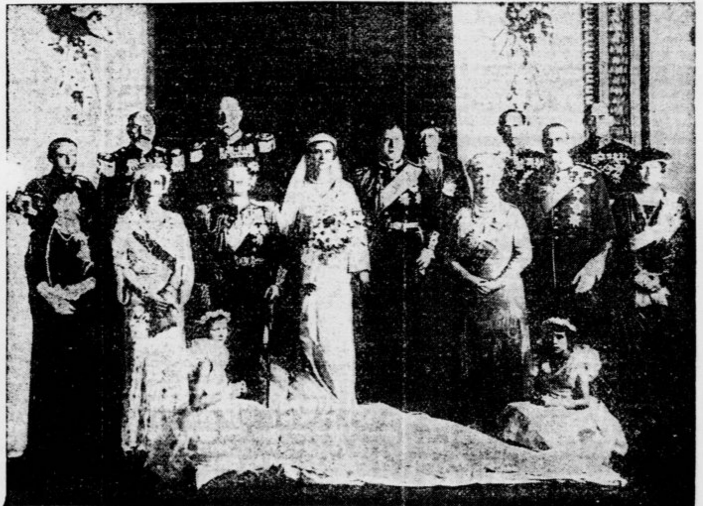
Na levi: Poročna ceremonija v Westminsterski opatiji — Na desni: Novoporočena v rodbinskem krogu po poroki (Naš knez-namnestnik Pavle stoji v drugi vrsti)