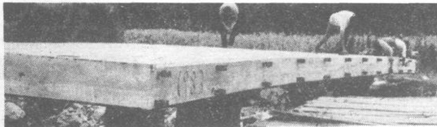
Ob dotrajanem lesenem mostu so kmetje iz Škofij pri Polhovem Gradcu zgradili nov most iz armiranega betona. Večino sredstev zanj so dali sami.