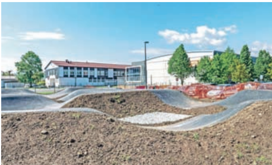
Grbinasti poligon, ki je še posebej med mladimi zelo priljubljen, bo po Pirničah tudi v Medvodah.

Izvajalec del je podjetje Zavod Aliansa, ki je že zgradilo prvi tovrstni poligon v medvoški občini, ki je v Pirničah. Vrednost del je 35 tisoč evrov (z vključnim DDV). Odprtje poligona načrtujejo še ta mesec, do takrat pa prosijo, da se ne gibate na območju gradbišča in upoštevate opozorila izvajalca. "V drugi polovici maja je predvidena še izvedba gumijaste podlage na novozgrajenem košarkarskem igrišču. V načrtih je tudi postavitve ograjenega manjšega otroškega igrišča ter postavitve naprav za ulično vadbo, t. i. street workout (vadba z lastno težo)," še pravijo na Občini Medvode.