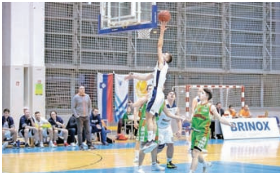
Za medvoškimi košarkarji je uspešna sezona v drugi slovenski ligi.