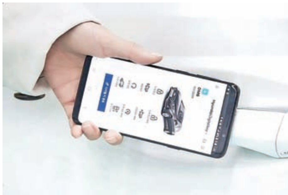
NFC – avtomobilski ključ na mobilnem telefonu

Kartice in ključi za prostoročni dostop nedvomno spadajo med najboljše avtomobilske rešitve; s kartico v žepu se približamo avtu, se dotaknemo kljuge in s tem odklenemo avto, sedemo za volan,