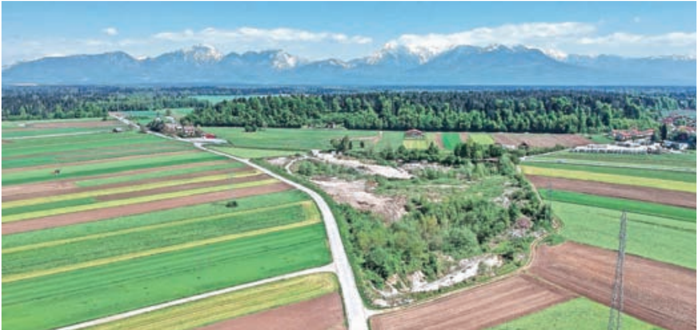
Na delu gramozne jame, ki je v lasti občine (ob lokalni cesti Jeprca – Goričane), bo zbirni center za odpadke.

Občina Medvode je eden izmed treh največjih lastnikov območja gramozne jame na Jeprci – poleg podjetja Spekter Kranj in Župnije Sora. Gradnja zbirnega centra za odpadke je predvidena prihodnje leto.