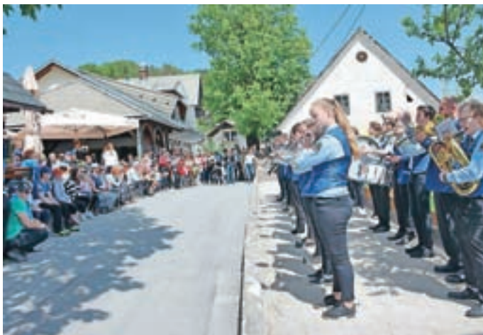
Godba Medvode je obkrožila občino in prvomajsko budnico zaključila na Topolu.

Na Topolu je bilo prvega maja veliko obiskovalcev in prostih parkirnih mest je bilo malo. Prvomajsko dogajanje je že