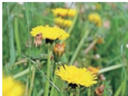
Regrat še cveti na travnikih.

Limone narežemo na kolobarje in damo v vodo ter zavremo. Dodamo re-