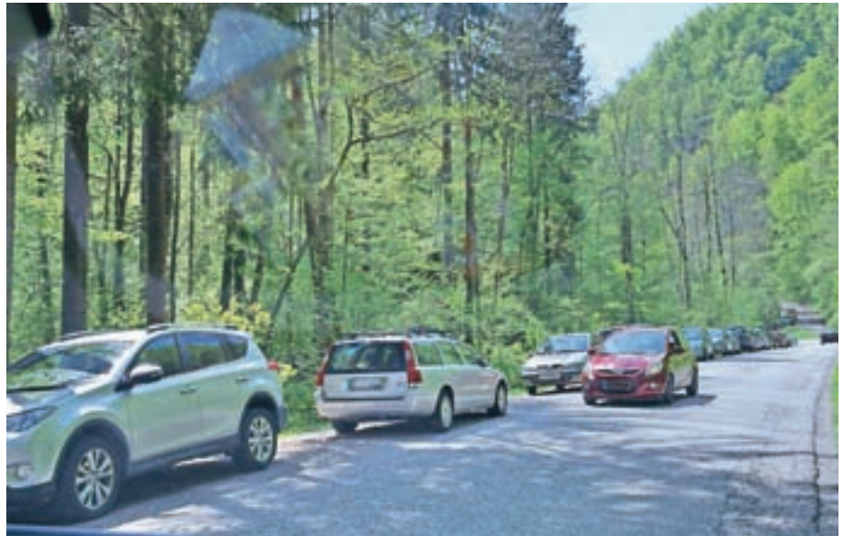
Problem parkiranja v dolini Ločnice (fotografija je bila posneta med prvomajskimi prazniki na izhodišču za Osolnik) bo težko rešljiv, bo pa občina letos pristopila k ureditvi parkirišča na Topolu.

"V sami dolini Ločnice je težko, da bi našli kakšno dobro rešitev. Soglasodajalci gradnje parkirišč ne dovolijo, ker je praktično povsod petmetrski pas ob vodotoku in so posegi tako nemogoči.