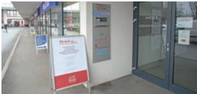
Dostopna lokacija podjetja Geslo plus, d. o. o., v centru Medvod v trgovsko-poslovnem centru Spar