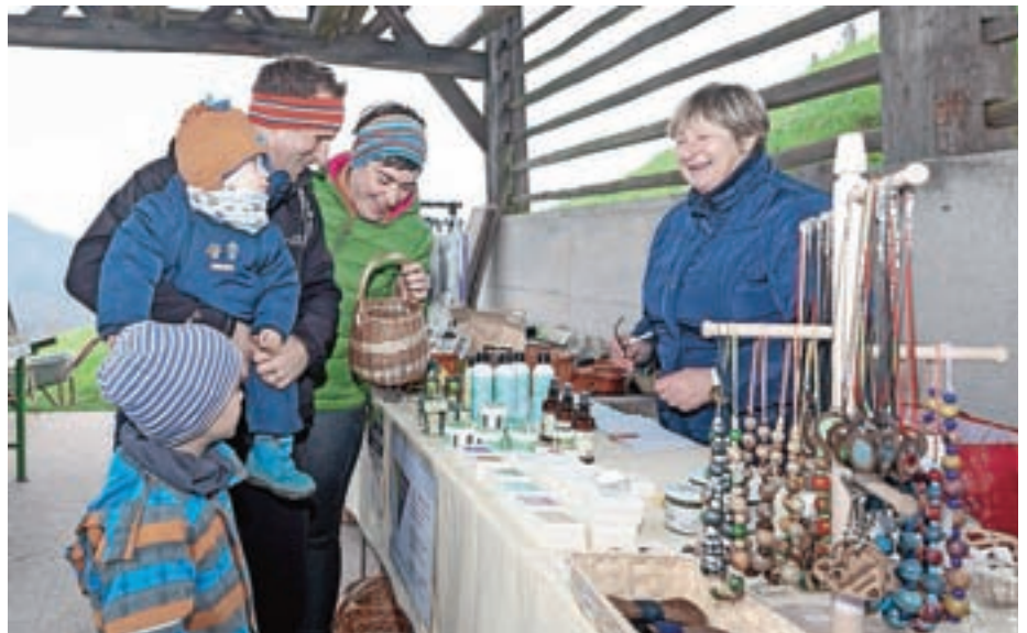
Spomladanska tržnica na Katarini popestri turistično ponudbo na tej priljubljeni izletniški točki.