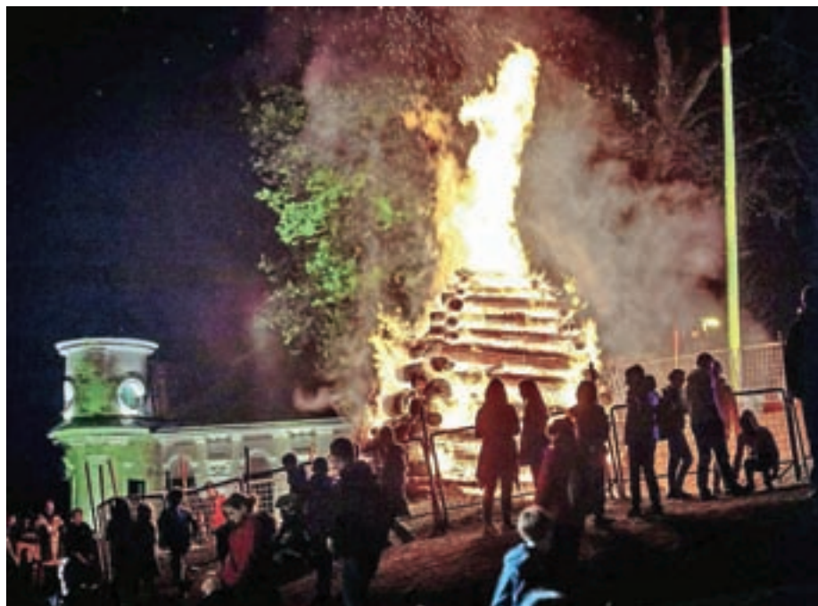
Kresovanje v Goričanah

Komaj dobro se je kresovanje zaključilo, so na prvega maja ob šesti uri zjutraj pri Godbenem domu s tradicionalno prvomajsko budnico začeli člani Godbe Medvode. "Zbujali" so na skoraj 15 lokacijah po celotni medvoški občini. Po skoraj osmih urah so svojo pot zaključili na Topolu, kjer so še popestrili dogajanje Turističnega društva Katarina, ki je v sodelovanju z Gostilno Dobnikar pripravilo prav tako tradicionalno prireditev Prvomajski nagelj na Katarini. "Za nami je zabavno, lepo, tudi nekoliko naporeno dopoldne. Imeli smo veliko srečo z vremenom. Zjutraj je bila še megla in potem smo tako pihali, da smo jo razkadili, in pokazalo se je sonce. Obujamo tradicijo. Letos je devetdeset let, odkar je bilo ustanovljeno društvo Godba Medvode. Podatka, ali je bila prvomajska