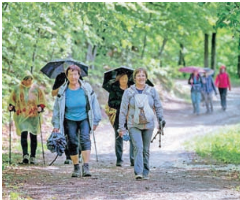
Pohodnike je med pohodom močil dež, ob vrnitvi na Stari grad pa je posijalo sonce.

Začetek je resda bil sončen, a je nato pohodnike skoraj ves čas preganjal dež, tako da so dežniki in pelerine prišli zelo prav. Ob vrnitvi na Stari grad je sonce spet posijalo in druženje po pohodu je potekalo v lepem spomladanskem vremenu.