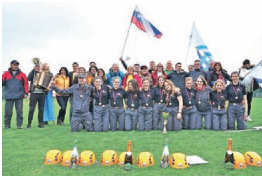
Ekipe mladink PGD Zbilje se je skupaj z navijači veselila uvrstitve na gasilsko olimpijado v Švici.

"Morda se sliši preprosto, a za tem uspehom je ogromno dela in odrekovanja. Samo od 1. januarja do 13. aprila letos smo skupaj tako individualno kot ekipno opravili 94 treningov. Čez zimo smo trenirali v športni dvorani Medvode, poleg tega je večina deklet športnic, tako