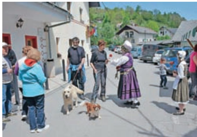
Rdeč nagelj za praznik dela – obiskovalci so bili te pozornosti veseli.