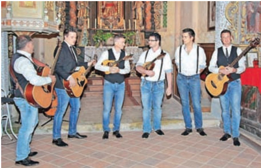
Klapa Gallus na koncertu v cerkvi sv. Marjete