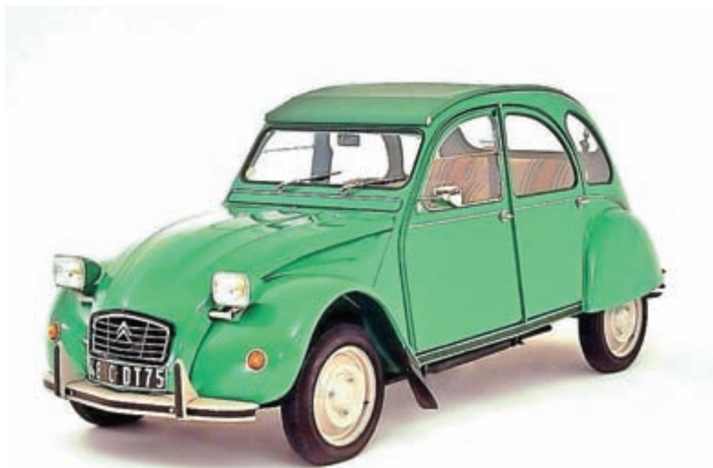
Legendarni spaček in citroën C1 – sto let gibčnosti

Ob praznovanju 100-letnice je Citroën predstavil posebno serijo vozil Citroën Origins, ki je na voljo za pet modelov vozil: