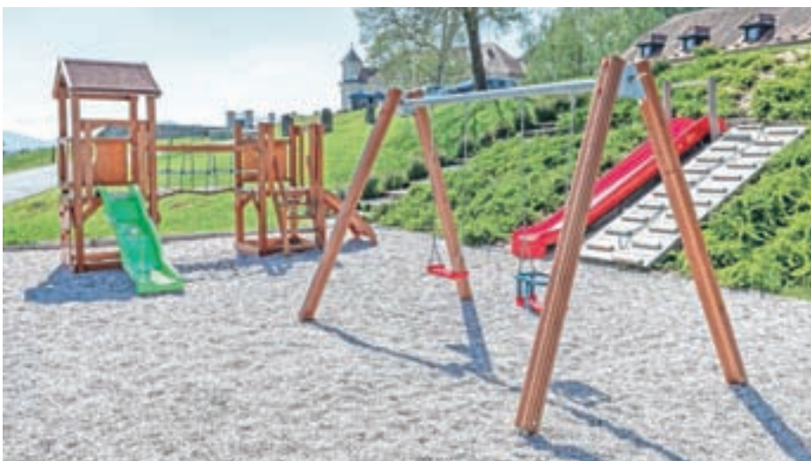
Novo otroško igrišče je investicija, na katero so v preteklem mandatu najbolj ponosni.

Glavna znamenitost krajevne skupnosti je Grad Goričane, ki pa je za javnost zaprt. "Krajevna skupnost Grad Goričane jemlje kot zasebno lastnino, lepo pa bi bilo, če bi bila odstranjena zelena zastirka na ograji, ki kazi tako lepo prenovljen baročni dvorec in jedro vasi, 'grajska štala' pa tudi nujno potrebuje novo preobleko," je Luštrik dodal nekaj besed na to temo.