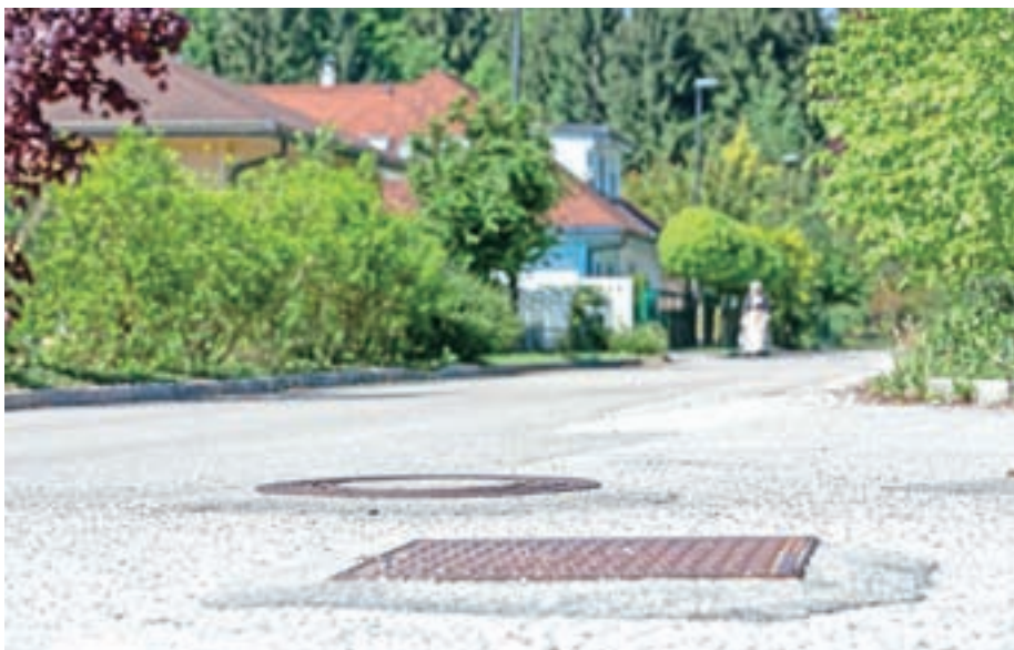
Zaključna plast finega asfalta na Zbiljski cesti še ni položena, jaški so dvignjeni in velik problem je to še posebej pozimi pri pluženju.