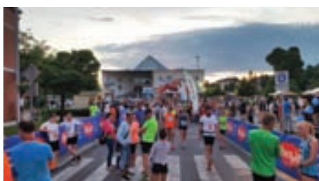
3. NOČNI TEK MEDVODE