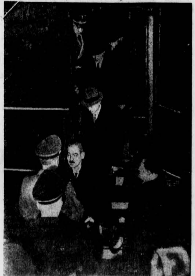
Matsuoka bei seiner Ankunft in Berlin

allg. Erörterungen seine Auffassung vom Weltfrieden dargelegt. Mit Rücksicht auf den rein theoretischen, abstrakten Charakter seiner Denkschrift sei eine unrichtige Auslegung seiner Meinung nach unmöglich.