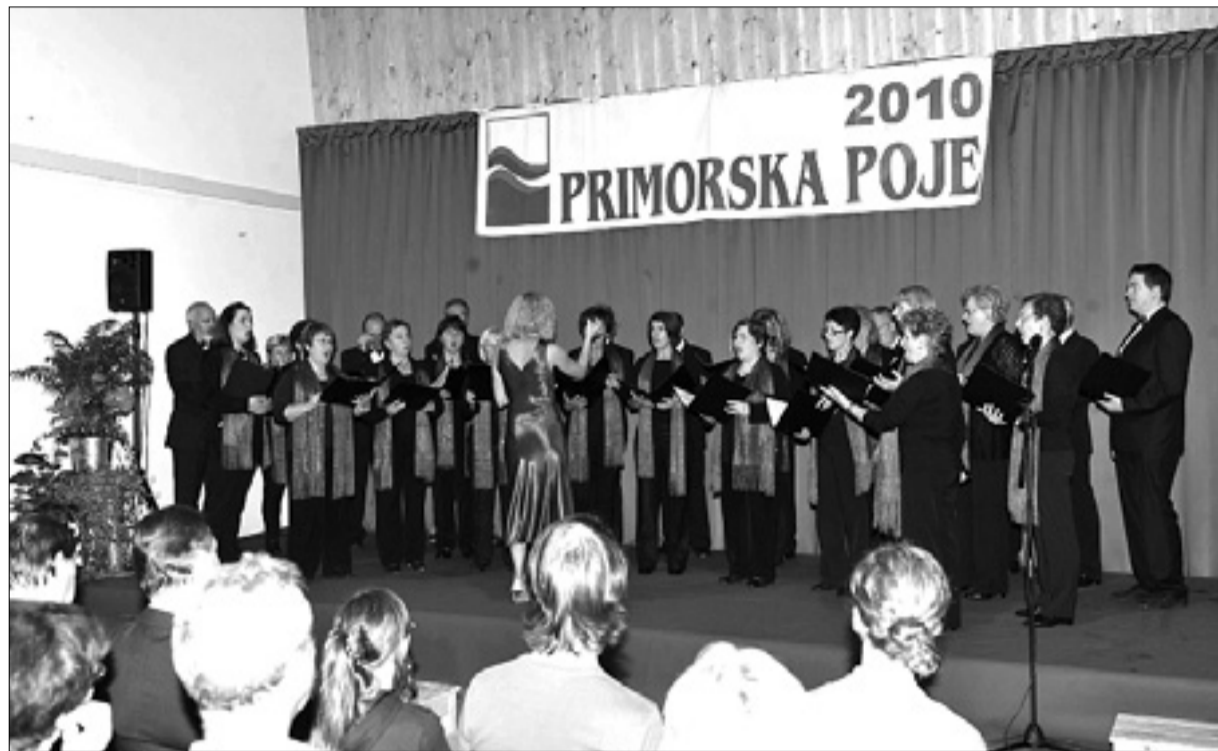
Posnetek s koncerta v Bazovici