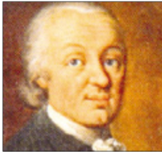
BALTASAR (BELSASAR) HACQUET

dost, bi rekli danes. Staršev menda ni nikoli poznal, bil pa je menda sin visokega plemiča, ki ga je kasneje, ne da bi se razkril, tudi gmotno podpiral. Že zelo mlad je veliko potoval in se tudi tako naučil tujih jezikov (veliko njegovih del je v nemščini). Burna so bila tudi njegova mladeniška leta, ko je kot vojaški kirurg prepotoval po Evropi, bil nekajkrat ujet in v smrtni nevarnosti. Poznanstvo z osebnim zdravnikom Marije Terezije, van Swietenom, je pripeljalo do namestitve v Idriji in s tem povezanega delovanja na Slovenskem. Po Hacquetu je poimenovanih kar nekaj rastlinskih vrst, ki jih je na Slovenskem prvič našel in znanstveno opisal prav nemirni Bretonec.