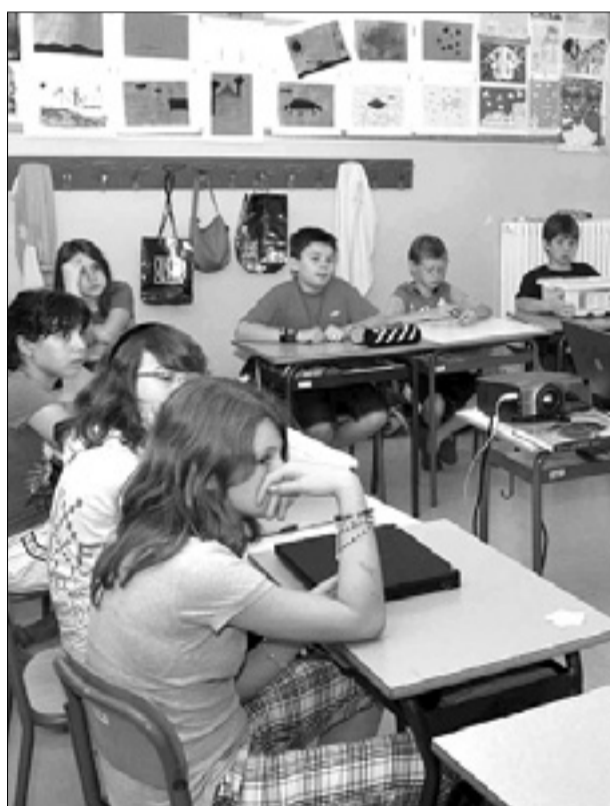
Doberdobski vrtce (zgoraj) in otroci sovoedenjske osnovne šole (desno)