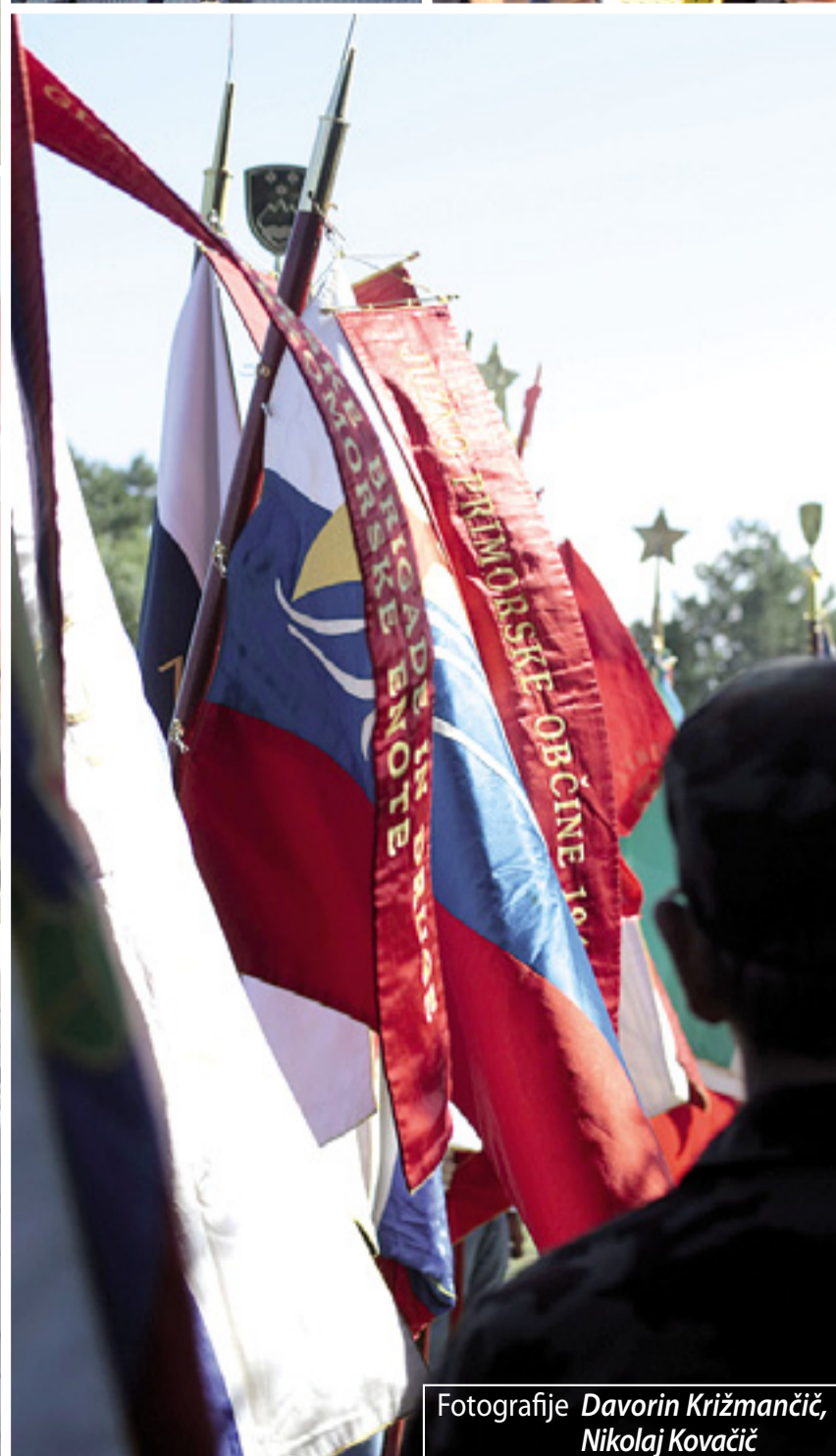
Fotografije Davorin Križmančič, Nikolaj Kovačič