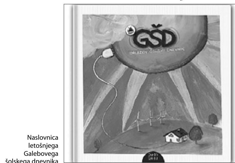
Naslovnica letošnjega Galebovega šolskega dnevnika

Prve septembrske dežne kaplje nas spominjajo, da se poletje poslavlja in da so šolska poslopja ponovno polna otroškega živčava. Na prvi šolski dan otrokom v slovenskih šolah v Italiji že več kot 20 let dobrodošlico zaželi Galebov šolski dnevnik. Žal se to letos (še) ni zgodilo. Tokrat nas je na cedilu pustila tehnologija, tako da bo treba