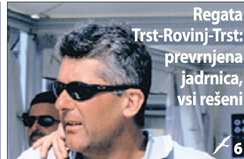
Regata Trst-Rovinj-Trst: prevrnjena jadrnica, vsi rešeni