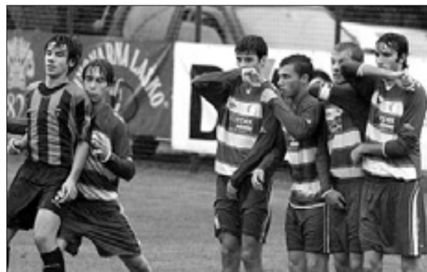
Krasovi mladinci so sezono v državnem prvenstvu začeli z zmago

Ostale tekme: Aquileia - Ponziana 4:3, Muggia - Monfalcone 1:2, Trieste Calcio - San Giovanni 2:1, Zaule - Fincantieri 0:0, San Luigi - Pro Gorizia 2:1; v ponedeljek: Fincantieri - TS Calcio 2:2.