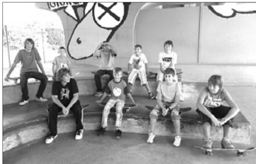
Tečajniki SZ Olympia

Deset let pa je odkar AŠZ »Olympia« ni osredotočena le na odbojgarske ekipe, ampak tudi na otroške športne dejavnosti, ki od leta 2000 dalje redno