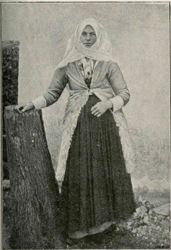
Staroločanka v nekdanji zimski noši.

Dalje na vshodu so bivali Japodi ali Japydi, pri morju, ob Snežniku in kraj Kolpe, pa tudi preko julskih Alp, v današnji dol. Kranjski. Tudi Japodi so bili národní mešanci od Ilyrov in Gallov (Keltov), in Strabo IV. 6, pravi, da