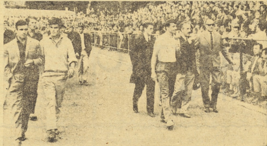
Stadion Glazija je bil minulo nedeljo nabit do zadnjega kotička. Tekmo so si med drugim ogledali tudi igralci Partizana iz Beograda

Vse je še v fazi začetnih razgovorov in ni mogoče že teden dni po zaključku kvalifikacij govoriti o novem oz. spremenjenem moštvu Kladi-