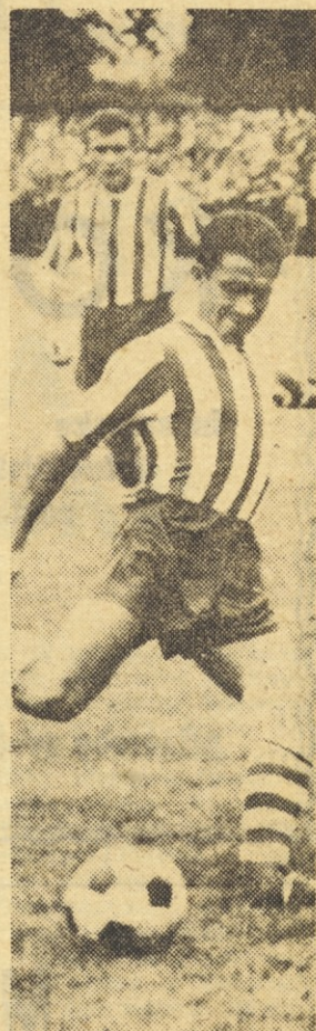
Hribernik je bil na obeh kvalifikacijskih tekmah med najboljšimi