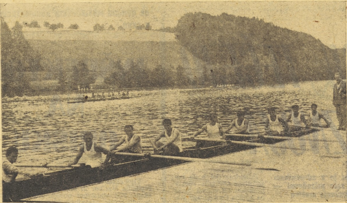
Ali pomeni zmaga v Luzernu tudi optimizem pred evropskim prvenstvom in olimpiado v Tokiu?

Ljubitelji atletike bodo imeli 1. in 2. avgusta priložnost videti na centralnem stadionu v Ljubljani srečanje moških in ženskih reprezentanc Bolgarije in Jugoslavije. Dvoboj, ki bi moral biti v Celju, je pred dnevi sprejela v organizacijo Atletska zveza Slovenije. Celjani so morali odpovedati dvoboj zaradi nedokončanih del na stadionu. Dvoboj z Bolgari bo največji letošnji atletski dogodek v državi, saj sodi bolgarska reprezentanca tako moška, kakor ženska, med prve na Balkanu. Dvoboj je tudi zadnja priložnost, da se naši olimpijski kandidati, med katerimi jih je kar pet iz naše republike, še pred nastopom na olimpijskih igrah predstavijo gledalcem v Ljubljani. Več o dvoboju bomo poročali v naslednji številki.