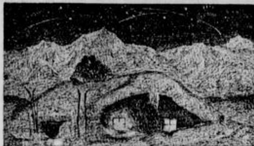
Domačija v snegu.

K prvom šolskim skrbem, ki se nemara pojavijo, spada tudi šolska utrjenost, ki se pokaže navadno v dobi pubertete pri obeh spolih. V tej dobi je to naravni pojav zaradi duševnih in telesnih sprememb. Tu naj starši dobrohotno pomagajo, da se težavna doba premaga, ne smejo pa