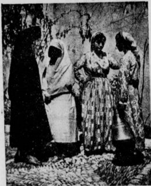
Muslimanke z zagrinjalom in brez zagrinjala.

Pravi musliman je redko zadovoljen z eno samo ženo. Ima jih toliko, kolikor jih lahko redi. Pravoverni musliman navadno čaka s poroko tako dolgo, da lahko vzame vsaj dve ženi. Ena sama bi mu bila v sramoto. V severni Afriki, kjer še mnogo dajo na islam, žive žene po haremh. Razen moža ne sme stopiti v harem noben moški.