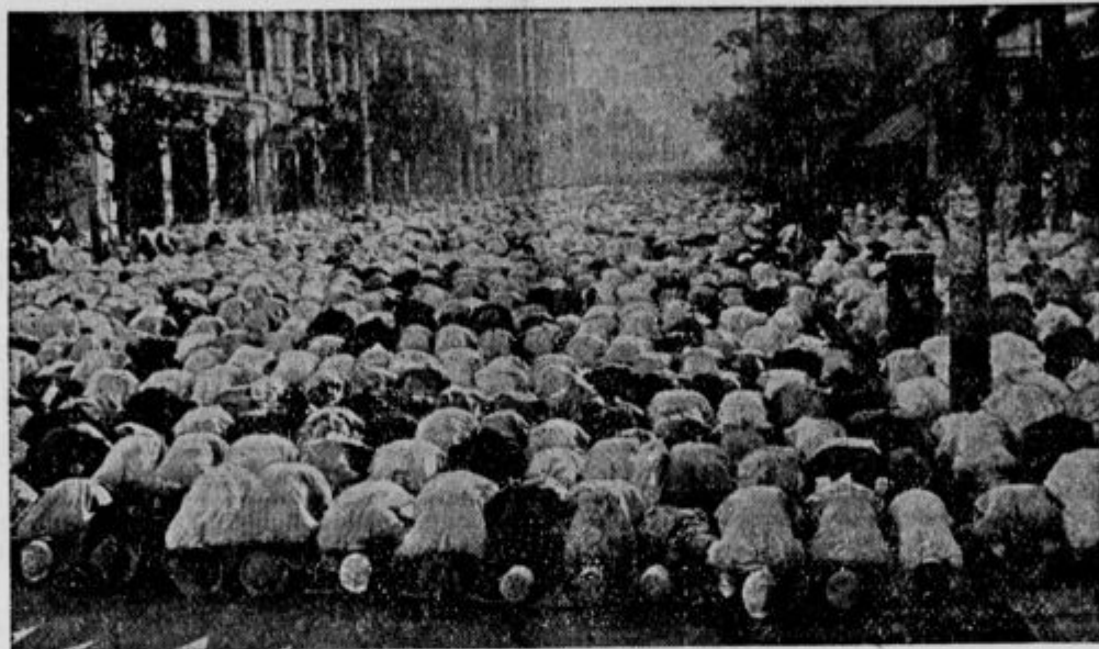
Muslimani — samj moški — pri molitvi.

Kako pa je Mohamed sicer gledal na ženske? Poročajo, da so ga nekoč vprašali, če bodo ženske tudi prišle v nebesa in če ženske smejo obiskovati mošeje. Mohamed je odgovoril: »V nebesa bodo mogoče prišle, kar pa se obiskovanja mošej tiče, je bolje, da ne zahajajo v mošeje, kadar moški opravljajo svoje molitve, ker s svojo navzočnostjo motijo moške med pobožnostjo in odvrtaajo njihove misli od Alaha na sebe.« Zaradi tega je po večini muslimanskih dežel ženskam vstop v mošeje prepovedan.