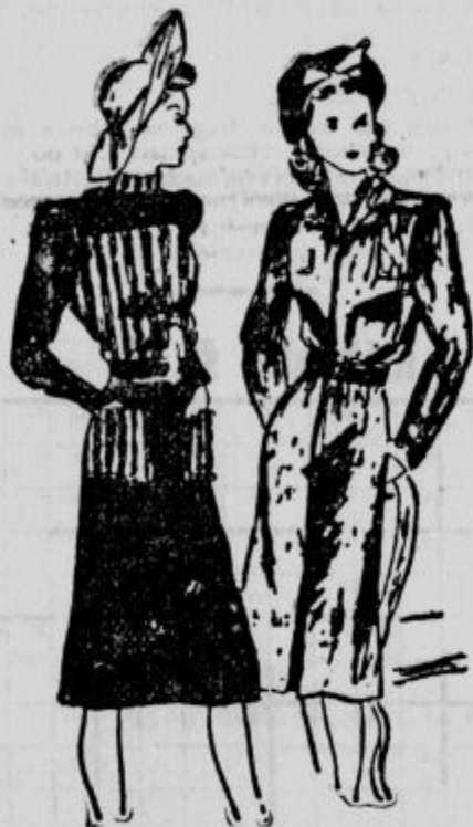
Dve zimski obleki za pod plašč.

Morala brez vere, kakršno nekatere knjige in vodilne besede še zmeraj proslavljajo, si mora nujno poiskati nadomestek za vero, da utegne svojim naukom nuditi potrebno hrbtnico, brez katere nimajo enotnosti in spricho splošnosti tudi nobene moči, ki bi te nauke vezale in držala skupaj. Laično vzgojstvo se je, zlasti v Franciji, pomagalo z raznimi nadomestki, med drugimi tudi s »solidarnostjo« in »socializmom«. Toda tisti, ki so bili med njimi bolj uvidni, so se kmalu prepričali o pomanjkljivosti teh surrogatov. Zakaj, navadno občutenje solidarnosti samo po sebi ni, da bi moglo brzdati in krotiti vse tiste različne protimoralne in protisolidarne elemente, ki jih že zgolj zaradi izvirnega greha človek vsebuje in ki nasprotujejo temu, da bi utegnili ljudje zares socialno živeti drug z drugim. Za to so potrebne krepkejše, nadsocialne sile! Robespierre je bil hudo v zmoti, ko je zamenjal križ na oltarju cerkve Notre Dame v Parizu za »bojinjo razuma«, to je z našemljeno igralko, in je menil, da je na ta način nadomestil mistično abstraktnost z živo stvarnostjo. V resnici pa je pobožanstvena pamet jako onemogla ab-