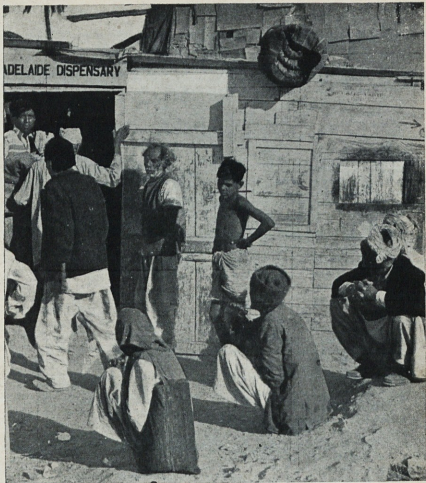
Pred misijskim dispanzerjem v Indiji