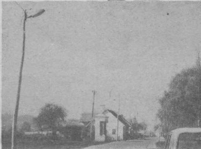
Nova cestna razsvetljava ob Cesti II. grupe odredov

Po večletnem negiranjju in prošnjah so se stvari le premaknile z mrtve točke in delavci so le pričeli postavljati cestno razsvetljava na celotni dolžini ceste od Podlipoglavja do Dobrunj, Litijsko cesto skozi Zadvor, ki je glede tega najbolj kritičen, bo še letos osvetljena, toda le provizorično na križišču pri Glastovcu, ker pripravljajo TOZD Javna razsvetljava po naročilu občinske Komunalne skupnosti moderno