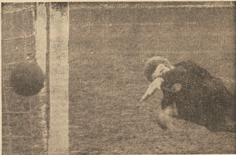
Jereb je ostro Zdravkovičovo žogo uspel odbiti v kot (zgoraj), iz katerega pa je Odred dosegel prvi gol

Na posvetu so govorili o predlogu programa dela za prihodnje leto in ga z manjšimi dopolnitvami tudi sprejeli. Tako bo »Partizan« v prihodnjem letu priredil 35 tečajev za atletike, igre z žogo, ritmiko, plavanje, smučanje, laborjenje, vaje na orodju in več splošnih in nadaljevalnih tečajev za društvene prednjake. Poleg množičnih tekmovanj bo priredil v različnih panogah tudi 11 dvodnevnih vadb v vajah na orodju ter 16 posvetov in seminarjev. Temu programu bodo okrajna načelništa prikojila svoj načrt dela. Če seštejemo vse republiške tečaje in k temu dodamo še vse one, ki jih bodo priredile okrajne zveze, potem bo treba najti primerne oblike zbiranja kandidatov za vse tečaje. Pošiljanje članstva v tečaje mora biti načrtno, vzgoja prednjaštva naj bo enotna od zveznih pa do društvenih tečajev. Sklenjeno je bilo tudi, da morajo vsi tisti člani »Partizan«, ki želijo v tečaje raznih športnih zvez, popreje absolvirati osnovni tečaj v partizanski organizaciji. Poleg zletov Okrajnih zvez ne smemo pozabiti na množično tekmovanje v vseh panogah, od meddruštvenih, okrajnih, medokrajnih in republiških. Tekme naj bodo propagandnega značaja, na katerih naj se med seboj kosajo emote po znanju, predvsem pa po številu nastopajočih. Tekme pa morajo seveda biti sestavni del našega dela, toda s poudarkom na množični udeležbi. Obiski bližnjih društev v svojem in sosednem okraju, združenj z različnimi nastopi, akademijami in