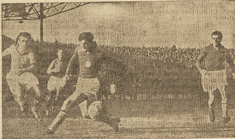
Horvat je bil v Parizu eden najboljših mož na terenu in je zanesljivo držal v kleščah slavnega Koppo

V Avstraliji so že prišli z atletsko sezono. Nekaj prvih rezultatov: 2 milji: Price 9:01.4; 5 milje: Clohessy 13:48.4, Power 13:48.6; 440 y ovire: 54.0; ženske — 100 y: Strickland 11.1; 80 m ovire: Strickland 11.4. Nekaj dni pred prvenstvom Sovjetske zveze v atletiki je rekorder na 800 m Ivakin še za desetinko sekunde popravil svoj rekord, ki znaša sedaj 1:48.4. Japonska metalka diska Yoshino je dosegla nov japonski rekord z metom 46.37 m. Češki tekmovalc v hitri hoji Ladislav Choc je dosegel v Znanju nov svetovni rekord na 50 km s časom 4:27.28. Madžarska rekorderka v metu kopja Erzeseth Vigh je dosegla na treningu odličan rezultat preko 54 m. Hokejska reprezentanca CSR je v svoji prvi tekmi na gostovanju po Angliji premagala profesionalno moštvo Nottingham Panthers, v katerem igra večje število Kanadčanov, z 9:2.