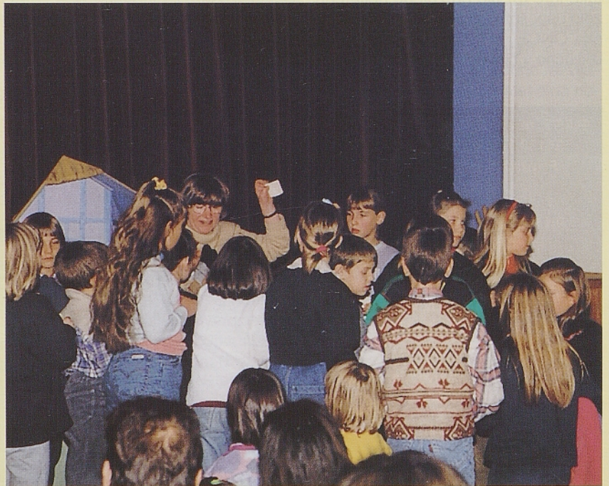
Po predstavitvi Sapramiške na Gledališkem vrtljaku. Škoda, da je bilo tako kratko...