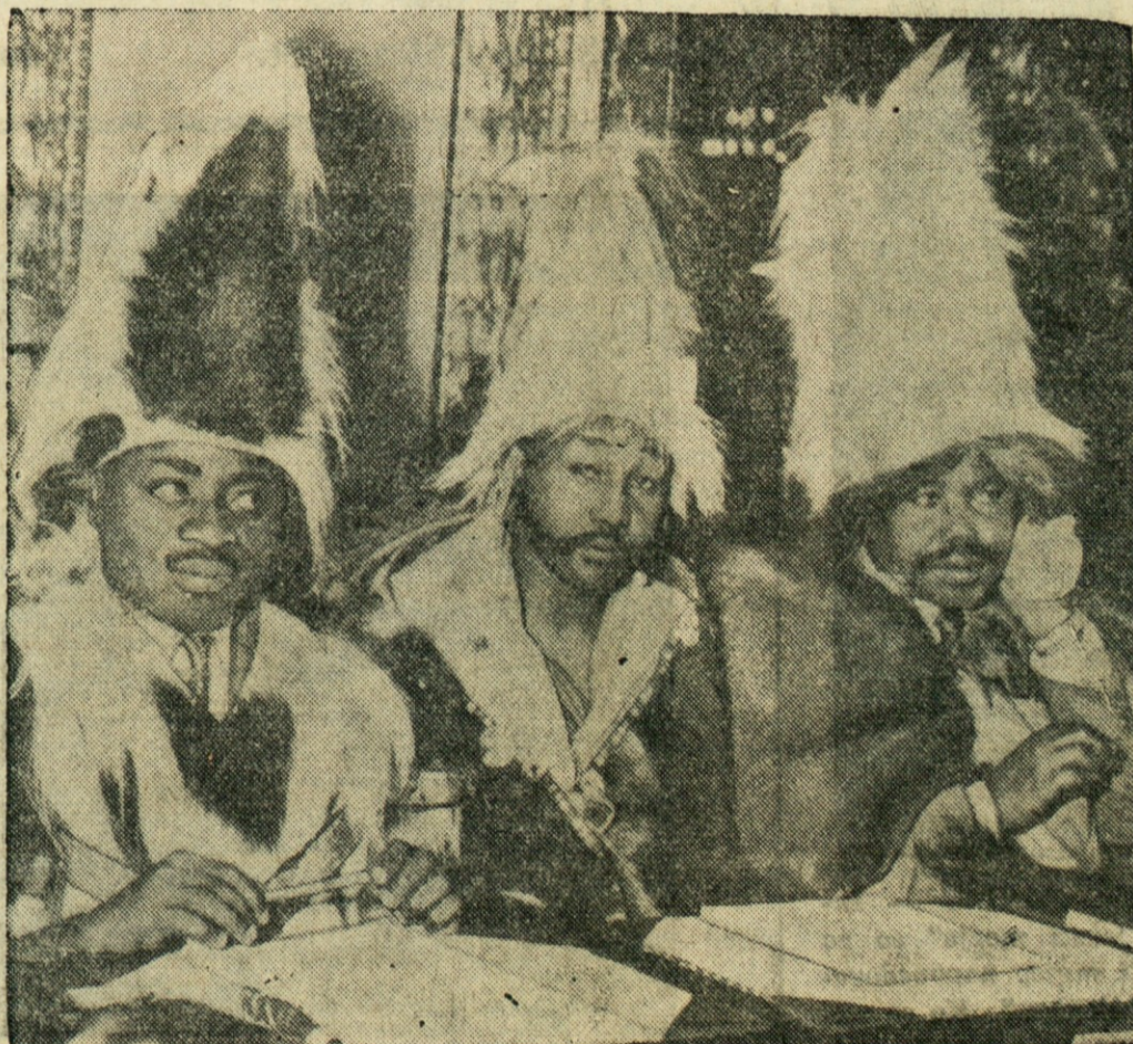
AFRISKI PLEMENSKI GLAVARJI V LONDONU — Pretekli mesec so se zbrali v Londonu predstavniki domačinov Kenije, angleške kolonije v vzhodni Afriki, ki naj v bližnji bodočnosti dobi neodvisnost, da se pomenijo o tem vprašanju. Na sliki vidimo tri delegate oblečene v slikovite domače noše.

555 St. Clair Ave. Tel. LE 5-7269 W. Toronto, Ont., Canada