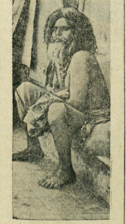
TEZEK POKLIC — Indijski "sveti možje" so za pretekli mesec napovedovali "sodnji dan." Ko se njihove napovedi niso uresničile, je njihov ugled močno trpel. Enega izmed teh "sadujev" vidimo sedeti na robu ceste v Kalkuti.

Nemara ne bo nič hudega. Novi leonsteinski valpet Ulrik, visok, košat človek, je spod čela opazoval moške. Gradovi so zgrabili skoraj vsi hkrati. Pod v etrovski, ostroviški, vajškrški, leonsteinski in humberški. Tisti večer pred Malim Šmarnom so leonsteinski biriči povezali Samčevega. Ni se branil, ko so stopili v hišo. Vse noči sem jih je že čakal, čeprav je tolažil Barbaro, kakor je le mogel. Oštirnikov se je otepaval in bil po biričih, da so krvavi odletavali proti peči. Ko se je zagnal po sekri, ga je eden biričev mahnil z mečem. Ko se je zvezan zavedel, so odgnali oba. Ubupno Barbarino tuljenje je rezalo srce vsem ženskam. Še do Šekolč niso mogli priti biriči z jetnikoma, ko je kakor nora planila na vas Pavličeva z Raven. Oštirnikovi so znova bruhnili v vek. Vaznikova je skušala pomiriti Samčeva. Ni si dala blizu. (Dalje prihodnjič)