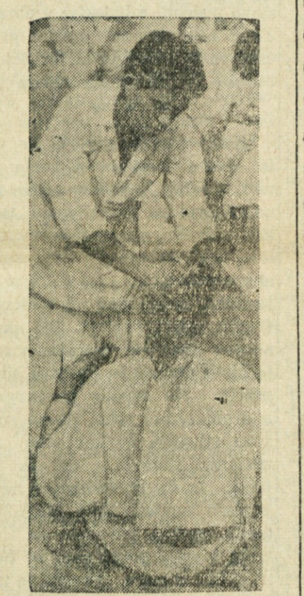
KAR NA CESTI — Kal-kuta v Indiji ima nad dva milijona prebivalcev, katerih več deset tisoč spi kar na cestah. Tako ni prav nič čudno, če tudi frizerji odpro svoje "delavnice" kar na cestah ali na njihovem robu.

je našel. S spačenimi obrazi ne morejo verjeti, da jih je sredi upanja zadela smrt. Iz dolgih ran mezi kri. Psi hodijo med mrlični, brenče se sprepašajo muhe po krvi. Na brezglavnem trupelu drobnega otroka jih je cel roj. Z grozo beže ženske nazaj v mesto. V zraku je sladkoben vonj po trohnenju, po razpadajoči krvi. Voda po vodnjakih je usmrjena. Mrlični z nabuhlimi trebuhii plavajo na vrhu. Trume psov in zverjad žre človeško meso po lesovih. V tem času gredo turške procesije pri Mohličah čez Dravo. Drava nosi mrlične in na pol žive ljudi. Groza z ostrimi kremplji visi na slehernem srcu. XIII. Po odhodu Turkov se Zilja ni prav oddahnila. Še kar naprej je v zraku ležalo nekaj težkega in pritiskalo na ljudi. Ubežniki in rešenci s Kakovega so skoraj zavidali Matjažu in Smrečnikovemu. Bog vedi, kje sta že! Gradovi so se odprli in izbruhnili valpote in biriče. Samčeva Barbara se je stisnila, zgrabila se je Pavličeva z Raven, v tila so zlezle žene po Zilji. Možje so omahovali okoli hiš, so tiho pomenkovali, na skrivaj ogledovali grajske stolpe in v strahu omenjali ječe. "Po vseh bodo planili, ker