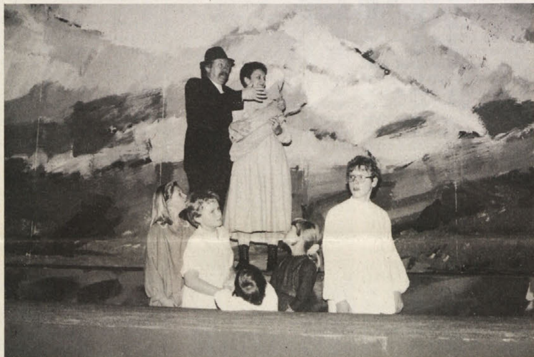
Prizor iz Prežihovih dnevov

rekonstrukcijo Vorančevih proznih del – gre za soočenje s problemi, ki jih njegova dela