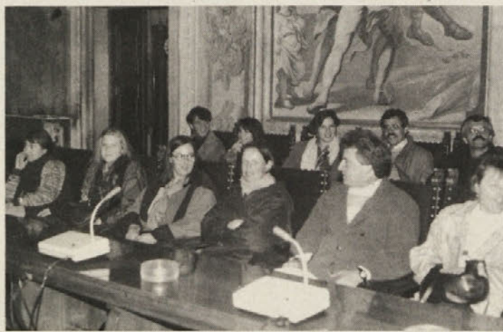
Pevci MePZ „Rož“ med sprejemom v Vidmu

je, da bo v videmski pokrajini odslej še več takih in podobnih prireditiv. Koncert „Pesem upanja – Cjant di sperance“ pa je zbudil zanimanje tudi na deželni vladi, to je videmski pokrajinski upravi in pri videmskem škofijskem centru za socialne komunikacije, ki sta prevzela pokroviteljstvo nad prireditvijo ter jo tudi finančno podprla. Predstavniki deželne vlade so pred koncertom za pevke in pevce zbora „Rož“ priredili pokrajinski upravi uraden sprejem.