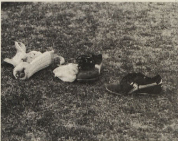
Nogometni čevlji bodo nekaj časa samevali – sezone je konec in vsem privoščimo nekaj počitka