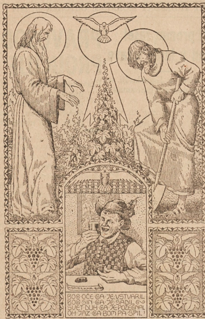
"En starček je živel..."

CLEVELAND, O. — Stajerski klub vabi v soboto, 2. novembra 1974, v avditorij pri Sv. Vidu na svoje vsakoletno MARTINOVA-NJE. Na razpolago bo odlična večerja — svinjska, goveja ali gosja pečenka. Za zabavo in ples bo gral orkester Sonet, v vse-