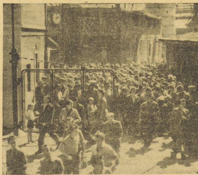
Na vratih jeseniške železarne je že silna gneča, ura pa je šele prvkar odbila dve...

Vodstva Ljudske mladine pričakujejo, da bodo upravna vodstva podjetij tudi njim posredovala osnovne podatke in druge pokazatelje, tako da bodo lahko, še preden bi gradivo obravnavali na seji DS, dali svoja mnenja, stališča in zahteve. Zaželeno pa bi bilo, da sindikalne organizacije povabijo tudi mladinska vodstva na razgovor, ko bodo govorili k polletnemu obratovanju. M. R.