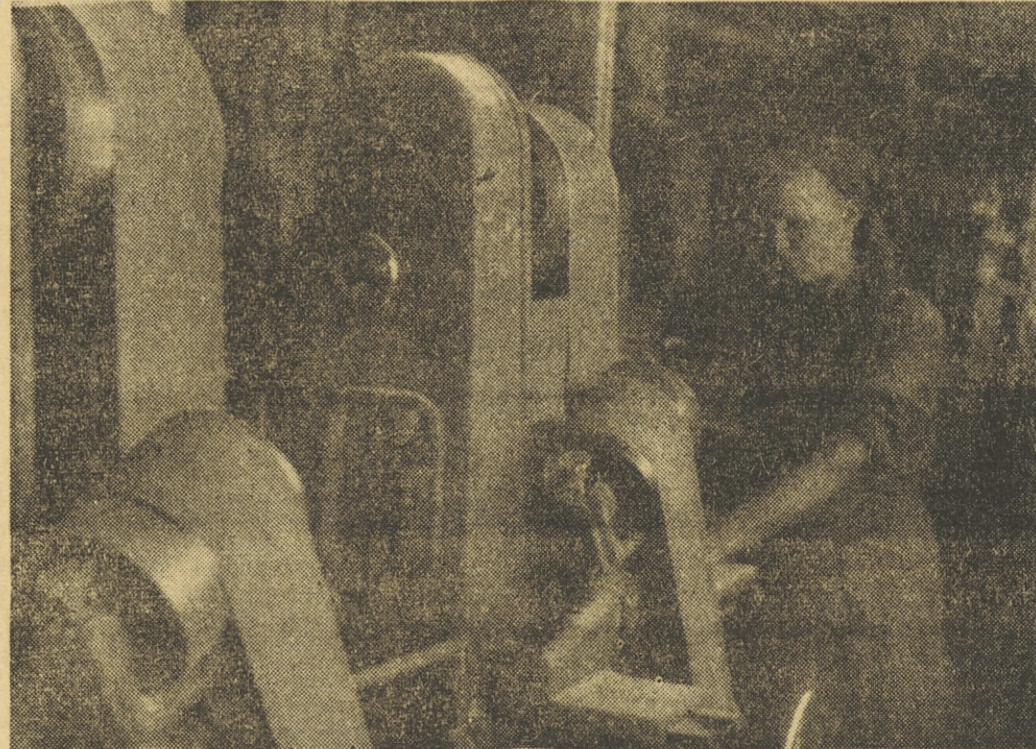
Lesno-predelovalna industrija v Podpeči je že star proizvajalec lesne galanterije. Danes izvaja svojo proizvodnjo večidel v tujino, za domači trg pa ostanejo le izdelki z napakami... Tovarno bodo letos obnovili, da bodo lahko proizvodnjo še povečali. Takrat bo morda tudi več dobrih izdelkov za domače kupece. V podjetju imajo v zadnjem času več novih strojev, razveseljivo pa je, da so jih skonstruirali in izdelali večidel doma, v svoji strojni delavnici.