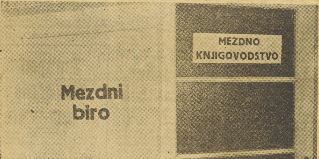
Človek kar ne bi verjel, koliko »mezdnih« oddelkov je še po naših administracijah