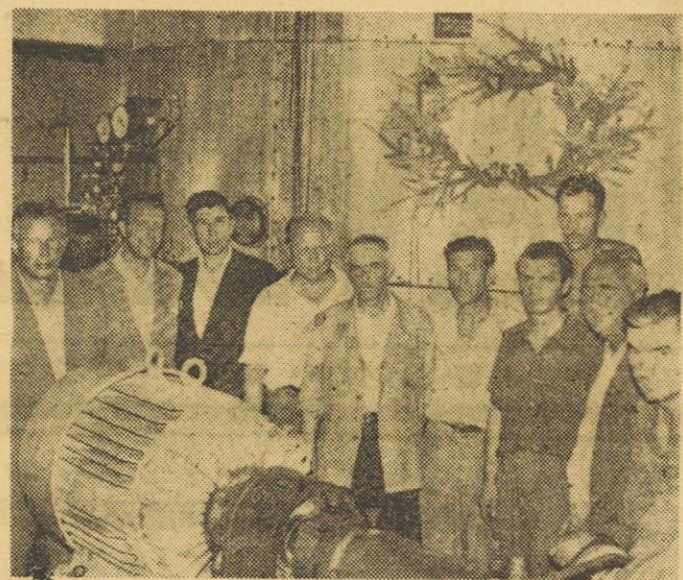
Ko je naš reporter minul teden obiskal tovarno celuloze in papirja »Djuro Salaj« v Vidmu-Krškem, je imel posebno srečo, saj se je nameril kar na dva pomembna dogodka. Poleg rekordne dnevnne proizvodnje časopisnega papirja so v oddelku, kjer kuhajo celulozo, tisti dan strojno proslavili še en uspeh: dvanašt dni pred rokom so naložili v kotle tisočo »kuho« celuloze. — Na sliki vođa oddelka za kuho celuloze s pomočniki, predsednikom delavskega sveta in direktorjem tovarne.

S tem pravilnikom so tudi določili, kdaj se otroški dodatek odšteje od štipendije. Dosele so to delali dokaj neenotno. Neki dijakinja, na primer, je železarna dajala 4.000 dinarjev štipendije, dejansko pa je dobivala na roko le 1.000 dinarjev, ker so ji odšteli 3.000 dinarjev otroškega dodatka. Prizadeta tovarišica teh 1.000 dinarjev ni imela za štipendijo, ampak za pomoč... Sedaj so določili, da se štipendistom — edincem, ki stanujejo v kraju solanja in pri starših, celotni otroški dodatek odšteje od štipendije, če pa štipendist stanuje ločeno od staršev, se pravi, v drugem kraju, pa se odšteje le 50% otroškega dodatka. Če ima družina dva otroka in živi štipendist v kraju solanja pri starših, se odšteje 50%, če živi ločeno od staršev, pa 25% otroškega dodatka; če je v družini troje in več otrok, se od štipendije odšteje v prvem primeru 25% otroškega dodatka, v drugem primeru pa ostane dijaku celotna štipendija.