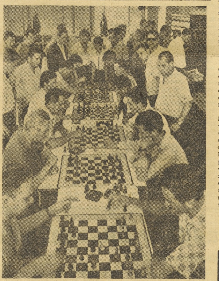
Iz albuma delavskega športa pri nas: Prizor z letošnjih XI. grafičnih letnih športnih iger v Mariboru.

Murskosoboški jadranski letalci in padalci se v teh dneh pripravljajo na razveseljivo dogodke. Ob koncu tega meseca bodo namreč odprli nov hangar, kar bo hkrati pomenilo otvoritev pomurskega letalskega središča. Na ta dan — 31. avgusta — bo v Murski Soboti velik letalski miting, ki bo bržkone največja taka prireditev doslej v Pomurju. Sportnim letalcem v Murski Soboti so krajevna podjetja in delovni kolektivi pri delu zelo priskočili na pomoč in jim pravzaprav omogočili izgradnjo tega letalskega središča, za kar jim gre vsa zahvala in priznanje.