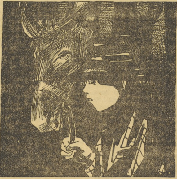
194. Komandant ni dolgo pomišľjal, kajti šlo je za življenje. Odredil je močno zaščitnico, ki je ostala pri ranjenih v votlini in stražila v okolici, z ostanki brigade pa se je skušal prebiti v bližino trga. Martinček je oblekel kmetov jopič, si del na glavo njegov klobuk in odrinil z mulo skoz gozdove proti trgu. Na oko je bil podoben mlademu konjskemu meštarju.