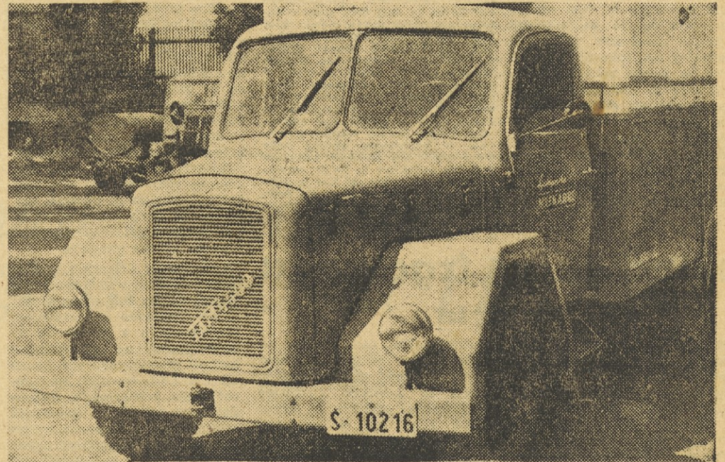
KDO BO UREDIL GOSPODARSKE TEŽAVE V TAM