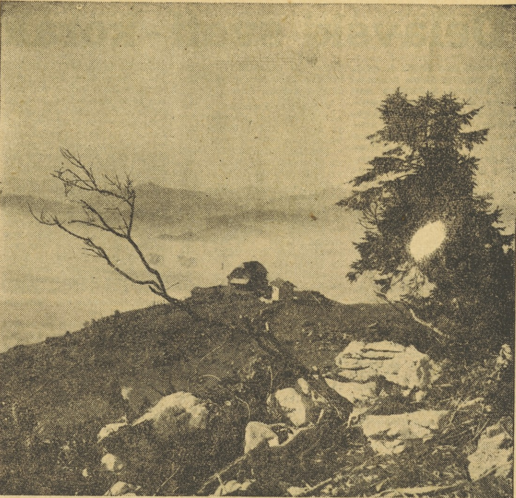
Motiv s Krvavca

Kdor bo torej v naslednjih dneh ali tednih optal nahrbtnik in obul kvedrovce, naj stopi kar do ene teh dveh spodnjih postaj in si privoščiti ščepec modernega planinstva. Vsaj za poskus in priokus, kako te stvari strežejo v svetovno znanih alpskih krajih, kjer so pač te zveze od hotela do vznožja, še bolj pa od onod do višinskih postojank, verjetno dvakrat dalje — vse v prid in za užitek tistih, ki jih pridejo obiskat.