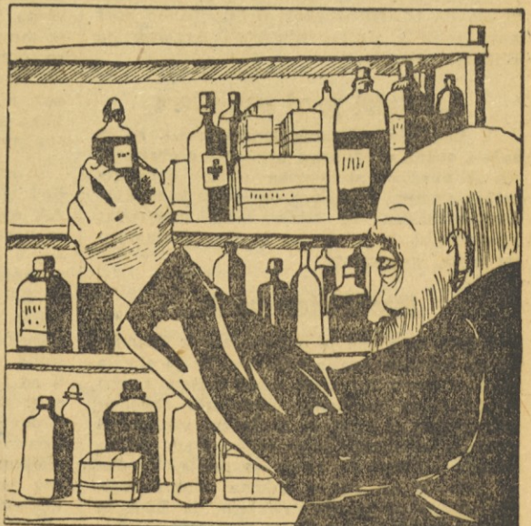
197. Ko mu je Martinček pojasnil, da bo jahal na mulo, zdravnik ni dolgo pomišľjal. Iz omarič je vzel nekaj zdravil, potaknil v žepu nekaj zdravniških instrumentov in dejal: »Veš, pobič, na srečo te poznam. Ti si Kovačev Martinček! Drugače ne bi šel nikamor, kajti domači izdajalec pazijo na vsak moj korak. Kje te naj počakam?« — »Pri križu na razpotju!«