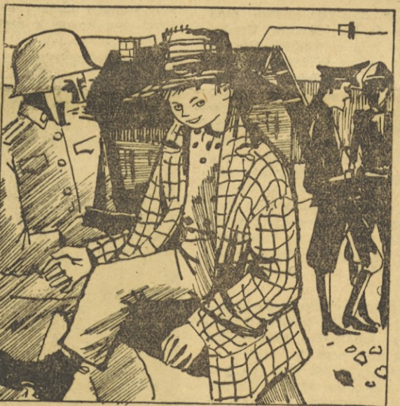
195. Mulo je privezal v gostem smrečju nad trgov, nato je počakal jutra in kot brezskrben kmečki fantič skočil na cesto in jo mahnil v trg. Nihče se ni zmenil zanj. Nemci, ki jih je bilo v trgu ko lista in trave, ga še pogledali niso. Kaj kmalu je našel hišo, v kateri je stanoval stari zdravnik. Pred hišo je stal tank z nemškimi vojaki, ki so brezskrbno kadili.