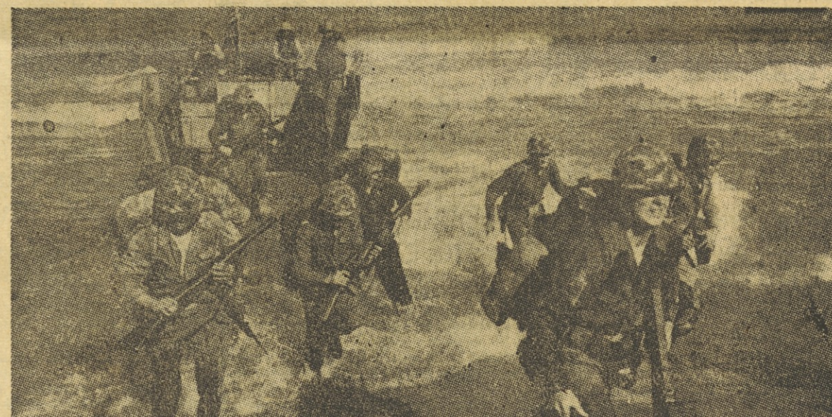
Preteklo je že mesec dni, odkar so se ameriški mornarji začeli izkrcovati na libanonsko ozemlje. Zdaj potekajo že več kot teden dni v OZN razprave o tem, kako doseči, da bi se ti mornarji zopet vrnili, od koder so prišli, kar bi odstranilo najnovejšo krizo na Blaznjem vzhodu.

Fevdalizem ni samo zaostri socialnih vprašanj, marveč se je pokazal tudi kot najhujša ovira slehernemu gospodarskemu razvoju. Zato je bil tudi prva tarča revolucije, potem ko je porušila stari režim in vzpostavila republiko. Nova vlada je že v začetni ustavi napovedala agrarno reformo, ki jo ljudstvo pričakuje z nepopisnim navdušenjem. Po uspešni odpravi starega režima bo to vsakogar največje dejanje iraške revolucije in hkrati nov korak k razvoju nove republike Iraka. T. M.