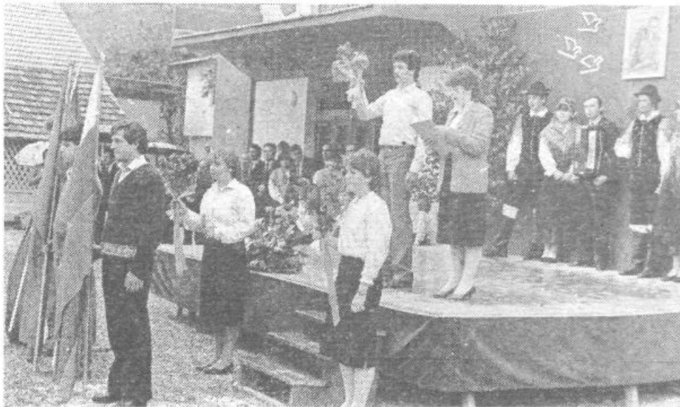
12. maja so štafeto mladosti ponesli mladinci tudi po naši občini. Osrednja svečanost je bila v Iški vasi od kjer je tudi posnetek.

Obraavnava in sprejem poročila o poteku kandidacijskih in volilnih opravil v OK SZDL, obraavnava in sprejem stališča o poročilih v preteklem delu in o predlogu programskih usmeritev OK SZDL ter njenih organov. Oblikovanje kandidatne liste in izvolitev predsednika, podpredsednika in sekretarja OK SZDL, predsedstva, nadzornega odbora ter drugih organov konference, delegacije za mestno, medobčinsko in republiško konferenco SZDL.