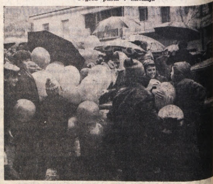
S «pogreba» v Boljuncu