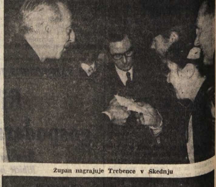
Zupan nagraduje Trebence v Škedenju