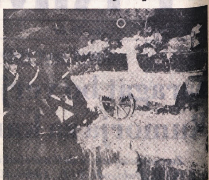
Pogreb pusta v Škedenju