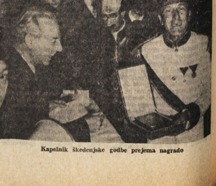
Kapelnik škedenjske godbe prejema nagrado