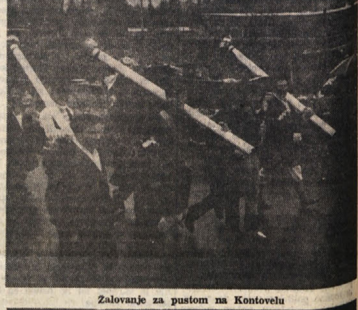
Zalovanje za pustom na Kontofevlu