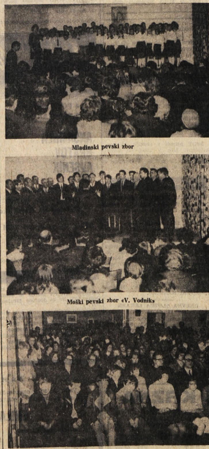
Mladinski pevski zbor