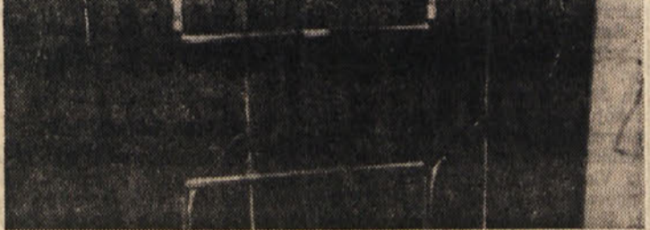
Zenska, ki jo vidimo na sliki, je stara 86 let in si je pri padcu zlomila vrat stegenice. Sedaj, kot vidimo, že spet hodi, pa čeprav ob vozilku.