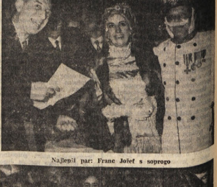
Najlepši par: Franc Jožef s soprogo