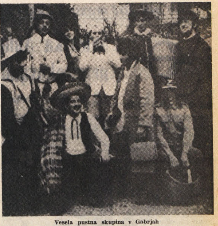
Vesela pustna skupina v Gabrjah