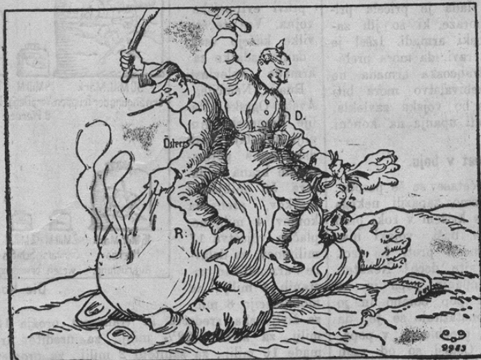
Geteilte Hiebe sind doppelte Hiebe.

Razdeljene batine so dvojne batine, — tako pravi naša slika, ki bode gotovo cenjene čitatelje zanimala. Na tleh leži Rus, poleg njega pa steklenica z žganjem. Na hrbtu pa mu sedita Nemeč in Avstrijec; medtem ko mu Avstrijec maže zadnico, da se kar vse kadi, spravil se je Nemeč nad njegovo glavo... Le po njem!