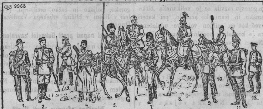
1. Vice-Admiral. 2. Stabs-offizier (Gren. Korps). 3. Turkestan-Infantist. 4. Terek-Kasak. 5. Ural-Kasak (Leibgarde). 6. Generaladjutant. 7. Off. d. Leibgarde - Gren. Rgt. 8. Off. d. Garde-Feldgen. d. Armee. 9. Dragoner-Offizier. 10. Kasaken-Artillerist. 11. Leibgardesoldat. 12. Leutnant zur See.

Ruska armada šteje v miru (skupaj z obmejno stražo) 60.000 oficirjev in 1,320.000 vojakov, to je 0,97% prebivalstva. V vojski zviša se to število na okroglo 6,000.000 mož. V tem velikanskem številu pa so vračunjeni tudi oni zbori, ki se nahajajo v Aziji ter v Kavkazu, ki