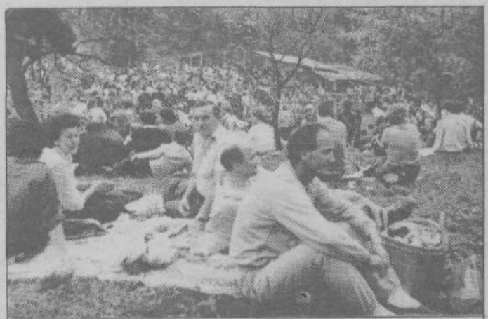
Najlepše je takole na travi, vendar prav tu je letos travnik zaoran v njivo in treba bo globlje v gozd, kjer je tudi lepo