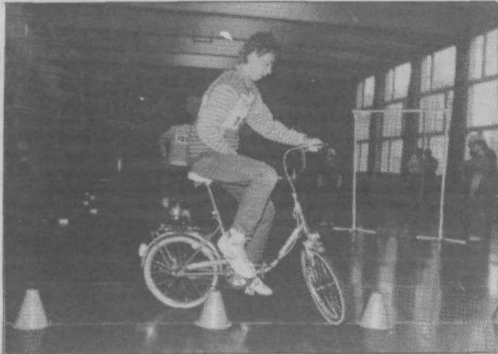
Preizkus v spretnostni vožnji na poligonu