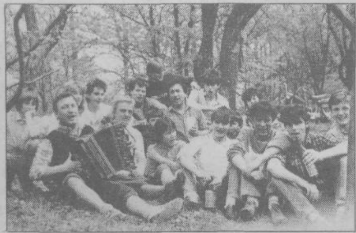
Sveže ozelenela hosta, mlade trave, harmonika in ljudje... Najbolj spontano ljudsko veselje