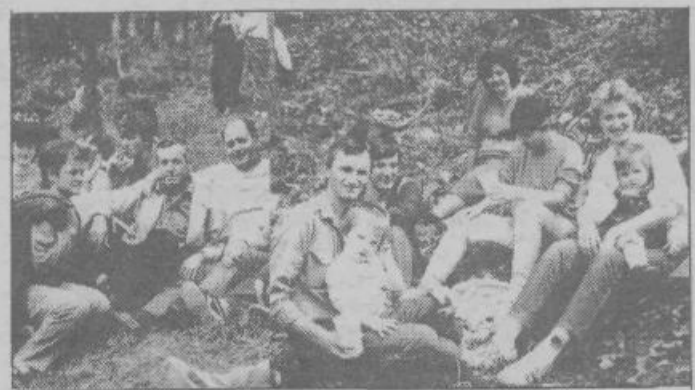
Nekaterim je dano, da se prvomajskega Pečarja že malih nog udeležijo. Kdo ve, kako bo čez 20 in več let, ko bodo oni stariši

Ne samo kmetovalci in vrtničkarji, prav vsi želimo v aprilu in maju veliko sonca, da se pomlad razcveti v vsem razkošju in da čimprej pozabimo tegobe zime.