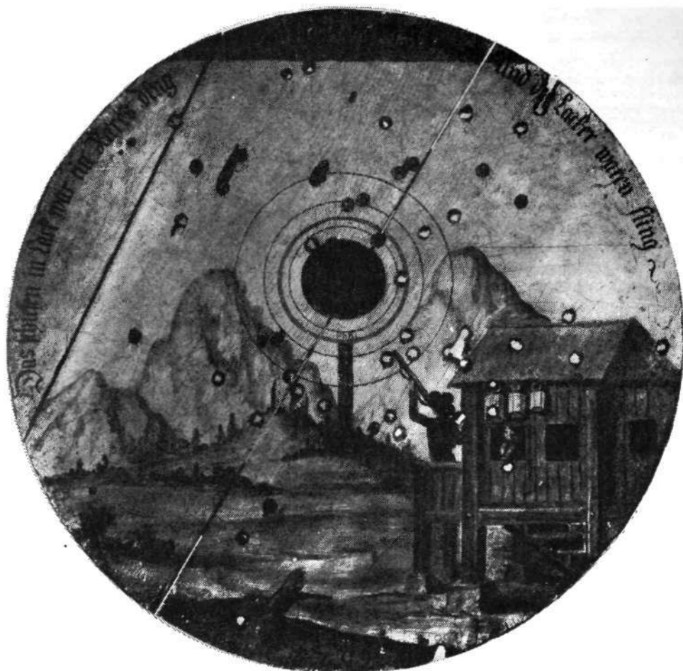
Tarča z upodobitvijo loškega strelišča

odprtih lin, saj je bila najbrž tudi stena na tej strani podobne oblike. Tako streljanja tudi dež ni zmotil in strelci so nasipali smodnik na suhem. Pa tudi sami so bili zavarovani, saj je bilo strelske uniforme še bolj škoda kot običajne obleke.