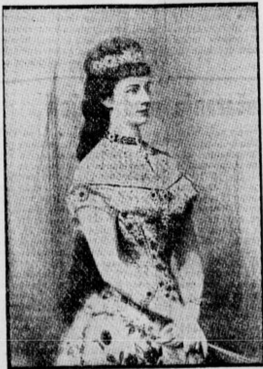
Cesarica Elizabetha v letu 1872 (stara 34 let)

Med to narodno krizo je Elizabeta zopet prihitela na Dunaj, kakor je to storila po porazu pri Solferinu leta 1859. Bila je pono- snna v svojem pogumu in neuklonljiva. Skrajna nevarnost je v njej vzbudila vse skrite sile. Cesarju je vrnila pogum in potolažila zbegane ministre. Hitela je od bolnišnice do bolnišnice in na vse načine lajšala splošno bedo.