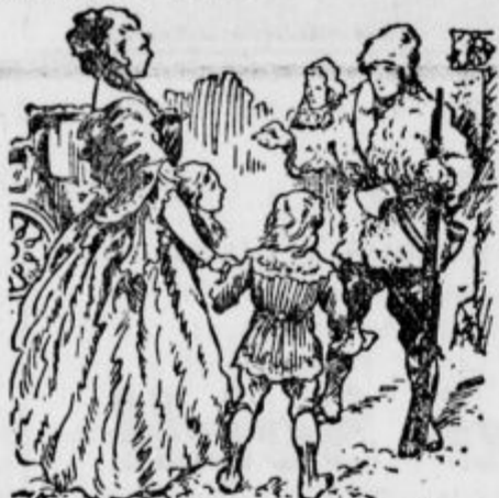
Vdova škotskega lorda s svojima sinovoma je obiskala pravega Robinzona.

Kmalu se je izvedelo, da je Aleksander Selkirk tisti Robinzon iz Defoejeve knjige. Zatorej je bil v posebni časti on in njegova škotska rojstna vas Largo, kjer je po svojem povratku prav siromajno živel. Ker ni imel nobenega veselja do dela in je njegov tast tudi rajši sedel po krčmah, je obema prav trda predla.