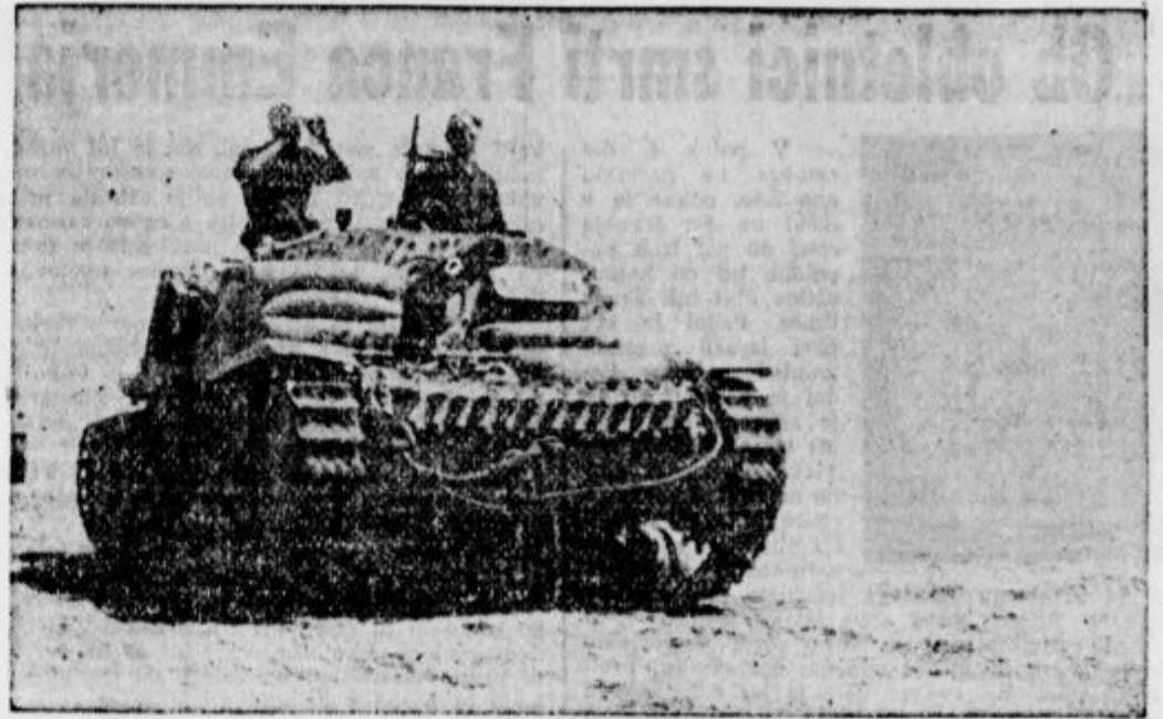
Severna Afrika: Italijanski tanki v akciji.

I Stanovanjske odpovedi. Ljubljansko okrajno sodišče je v 11 mesecih letos zaznamovalo 663 stanovanjskih odpovedi, ko jih je bilo lani v tem času 1138. Letos v novembru jih je bilo