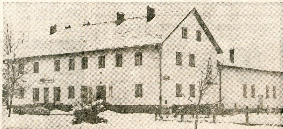
V krajevni skupnosti Vodice so lani med drugim uredili tudi pročelje združnega doma