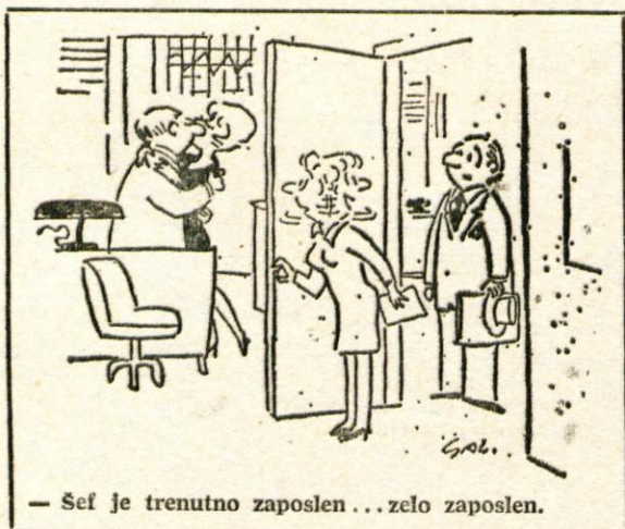
— Šef je trenutno zaposlen . . . zelo zaposlen.

re delovnega dne. Najbrž bo nova metoda zdravljenja utrujenosti in živčnosti najbolj uspešna pri ženskem spolu. Kdo se ne bi zdravil namesto z injekcijami z različnimi kremami in podobno.