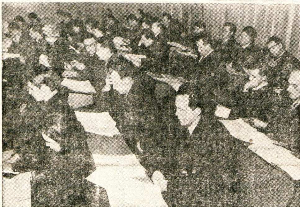
S seje družbenopolitičnega zbora kranjske občine