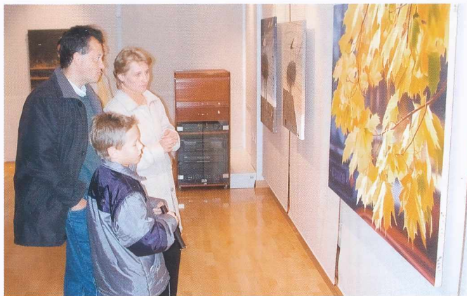
SLIKARSKA KOLONIJA PRIMOŽ TRUBAR 2004 – Bero jubilejne slikarske kolonije, ki že deset let domuje v Moravskih Toplicah, so v novembru postavili na ogled v galeriji Kluba Pac v Murski Soboti.