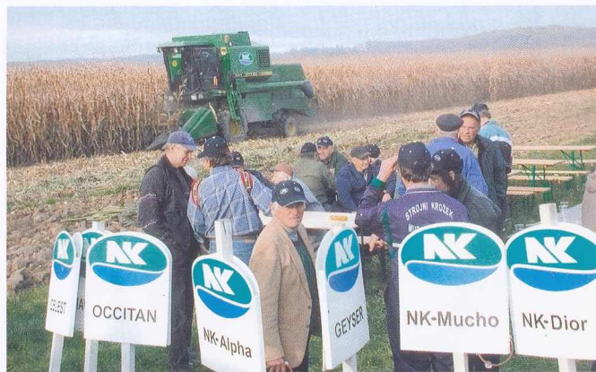
POSKUSNA PRIDELAVA KORUZE – Vitezovi iz Tešanovec so dolgoletni poskusniki semenske hiše Syngenta. Strokovnjaki so ugotavljali najboljše rezultate pri sorti NK Kanada: izjemno visok hektarski pridelek in nizko vlažnost v letošnjih neugodnih vremenskih razmerah.