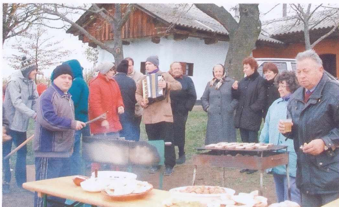
Veselje v Gaju.

Po degustaciji – največ zanimanja je vzbudilo vino, ki premore sokove kar 40 različnih sort grozdja – se je ob zvokih harmonike in s pesmijo začel družabni del. Brez nepogrešljivega pečenegega kostanja tudi v Gaju ni šlo, na voljo pa je bil tudi »pajani krčij« ter druge kulinarčne dobrote. Številni gostje so se potem preselili v tople izbe starih in večinoma še s slamo kritih vinskih kleti ter dolgo v večer modrovali o trti, vinu in življenju.