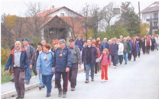
SEZONA POHODOV – Pohodi so pritegnili stotine ljubiteljev narave in postali imenitne rekreacijske in družabne prireditve. Posnetek je z letošnjega Martinovega pohoda na Jelovškov breg.