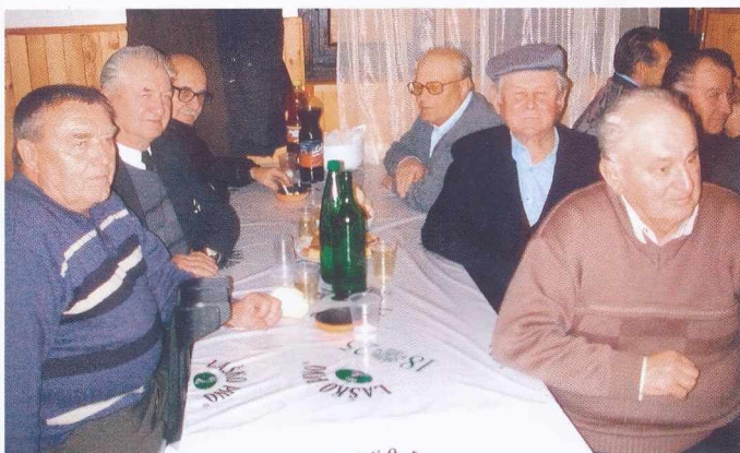
TRADICIONALNO SREČANJE GASILSKIH VETERANOV – Četrto srečanje je Občinska gasilska zveza pripravila zadnjo soboto v Fokovcih. Tudi tokrat se je zbralo veliko število veteranov, srečanje pa je minilo v prijetnem razloženju.