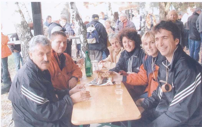
Skupina dobro razpoloženih pohodnikov iz Martjanec.