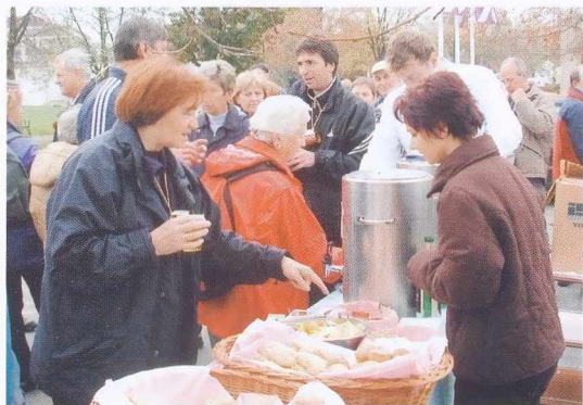
Prva postaja pohodnikov v Moravskih Toplicah.

Pred znamenito gotško cerkvijo sv. Martina s freskami Janeza Akvile iz 14. stoletja v Martjancih je začela najbolj vztrajna skupina, v Moravskih Toplicah, kjer je bila vmesna postaja s prvim okrepčilom, se jim je pridružila druga skupina, potem pa so dobro razpoloženi družno nadaljevali do bližnjih vinogradov.