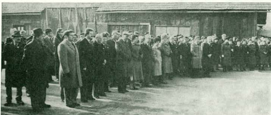
Svečana otvoritev rekonstruiranega obrata furniranih vratnih kril v Tovarni pohištva Prevalje

Takoj, v skladu s sanacijskim programom, pa se je začela načrtovati modernizacija in rekonstrukcija tovarne. Pri proučevanju rekonstrukcije in modernizacije proizvodnje furniranih vratnih kril se je pokazala vrsta težav, ki so izhajale predvsem iz zastarelosti tehnologije za proizvodnjo vratnih kril. Od leta 1972 ni bilo večjih vlaganj v strojno opremo, zato se je v tem času iztrošila in zastarela. Tako je bilo potrebno v celoti reševati energetska postrojenja, urediti zunanji in notranji transport, povečati sušilniške kapacitete ter povečati skladiščne kapacitete gotovih izdelkov. Ker je bil rok za izdelavo sanacijskega programa terminsko omejen, je pomenilo to omejen čas za izdelavo investicijskega programa. Potrebno pa je bilo temeljito proučiti tehnologijo izdelave furniranih vratnih kril na evropskem nivoju. Pridobiti je bilo potrebno dodatne informacije o raziskavi tržišča ter izdelati vso projektno dokumentacijo. Dela je bilo zaradi kratkega termina izredno veliko, kljub temu pa Prevaljčani ugotavljajo, da so sorazmerno v kratkem času uspeli vse urediti tako, da so upoštevali razvoj tehnologije in zahteve tržišča po kvalitetnem izdelku in v celoti upoštevali problematiko proizvodnje vratnih kril, ta-