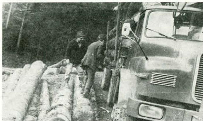
Tako, še srednjo verigo, pa gremo!

tako vsi več ali manj povezani. Moj namen ni povečevati delo voznika, ampak le opomniti, da tudi voznikom nismo zagotovili vsega, kar smo s pravilniki sprejeli. Obljuba, da bo imel vsak voznik na kamionu tudi stalnega merilca, ki bo vezan tudi na kamionsko normo, mu pomagal in ga spremljal, razen pri zadnji vožnji na skladišče, kar je bistvenega pomena predvsem v zimskih razmerah, ni povsod izpolnjena. Da bo les ob cestah sortirano po dolžini in ustrezni debelini, tudi ne; še najmanj pa drži tisto zagotovilo, da bo za poln tovor potrebno prestaviti kamion največ petkrat. V praksi niso redki primeri, ko morajo vozniki prestaviti vozilo tudi po 30 krat, preden je kamion naložen. Zaradi neizpolnjenih pogojev za normalno delo pa so še bolj kot vozniki prizadeti traktoristi pri mehaniziranem spravilu lesa.