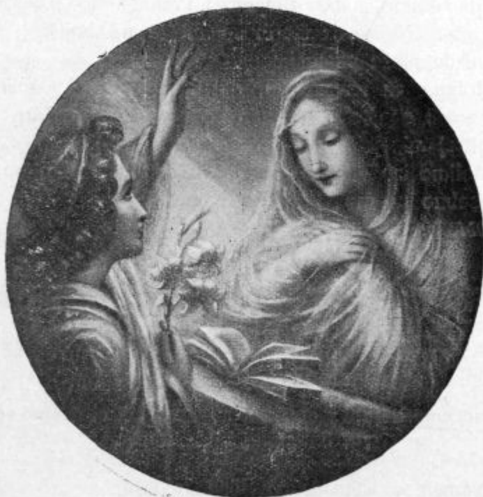
„Blagoslovljena si med ženami!“

Čeni si zato prizadevleš, ka bi kem več dobička pa posvetne hvale meo že na tom sveti, pa zakaj si ráj ne prizadevleš, ka bi si kem več zaslūženja spravo za nebesa ?