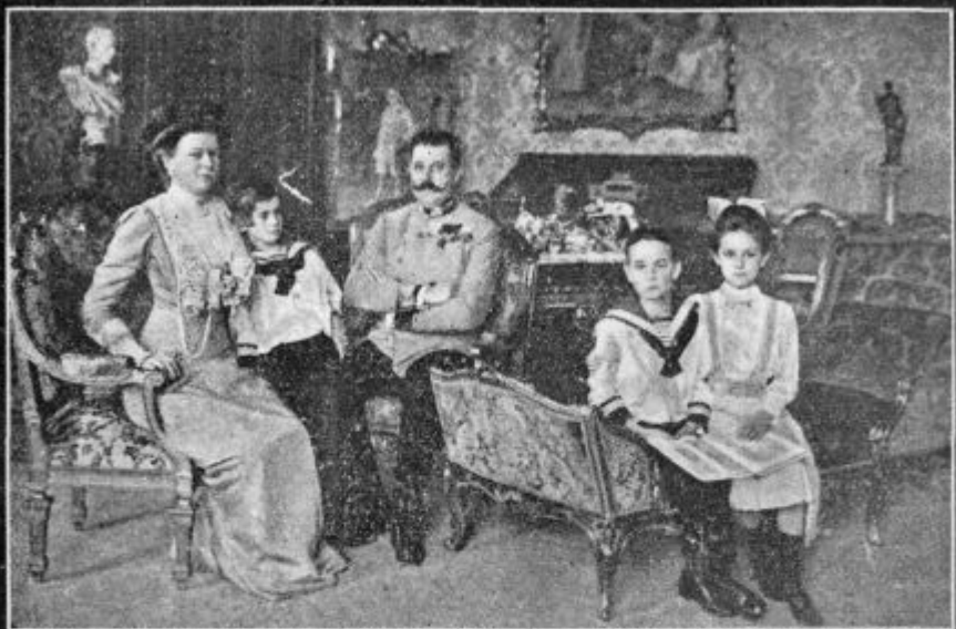
Pokojni Franč Ferdinand z svojov družinov.